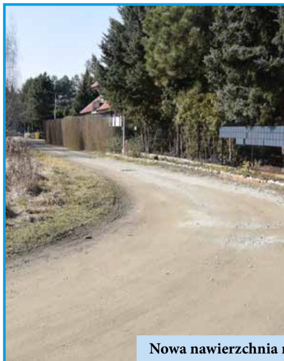
Nowa nawierzchnia na ul. Kwiatowej w Szewcach