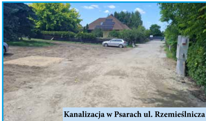
Kanalizacja w Psarach ul. Rzemieślnicza

miejsowościach, funkcjonuje nowoczesna sieć kanalizacji sanitarnej, do której można i warto się podłączyć. To nie tylko obowiązek wynikający z przepisów, ale przede wszystkim korzyść dla Waszego zdrowia, wygody i środowiska. Ponadto gmina dofinansowuje budowę przyłączy kanalizacyjnych w wysokości max. 5 tys. zł. (75% wartości robót).