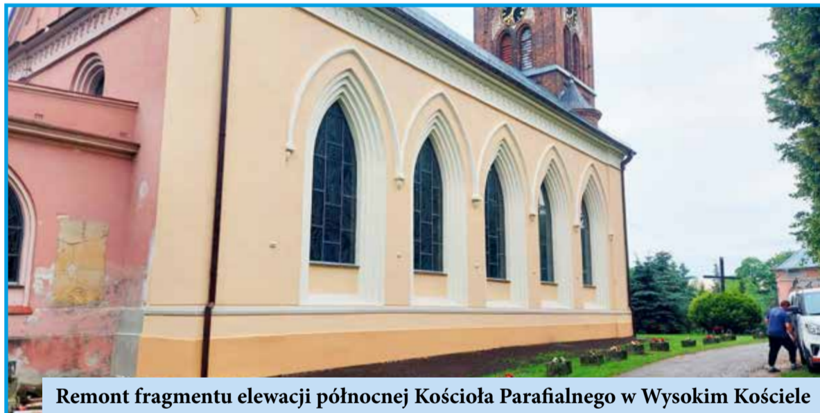
Remont fragmentu elewacji północnej Kościoła Parafialnego w Wysokim Kościele