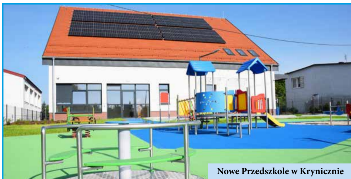
Nowe Przedszkole w Krynicznie