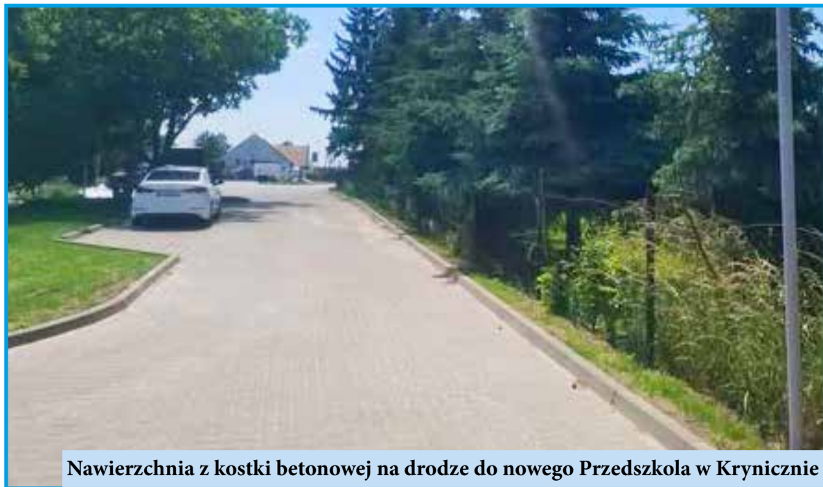
Nawierzchnia z kostki betonowej na drodze do nowego Przedszkola w Krynicznie