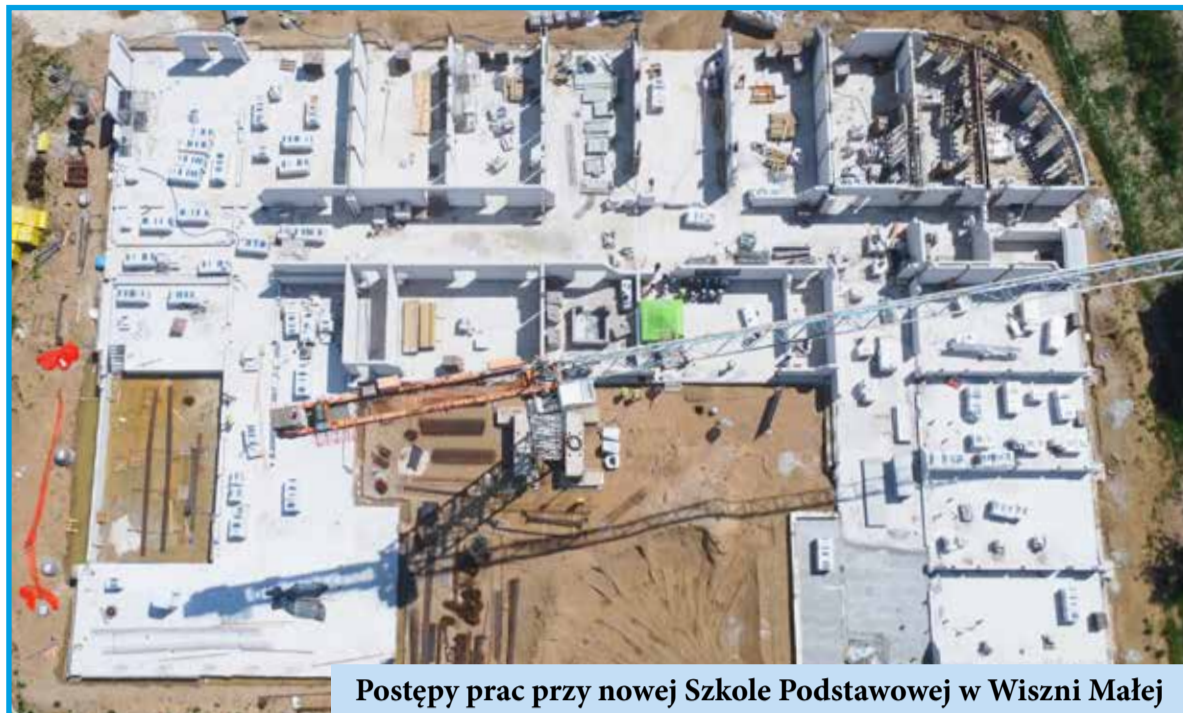
Postępy prac przy nowej Szkole Podstawowej w Wiszni Małej

To wszystko sprawia, że Wisznia Mała staje się nie tylko wygodnym i bezpiecznym miejscem do życia, ale także gminą, z którą mieszkańcy mogą się utożsamiać i z dumą ją reprezentować.