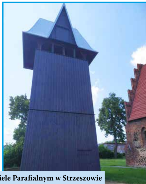
Remont dzwonnicy przy Kościele Parafialnym w Strzeszowie