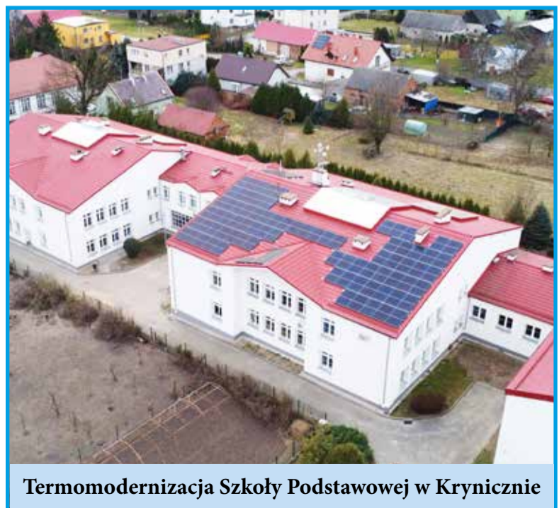
Termomodernizacja Szkoły Podstawowej w Krynicznie