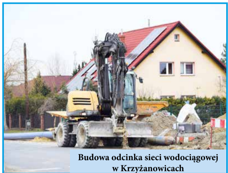
Budowa odcinka sieci wodociągowej w Krzyżanowicach