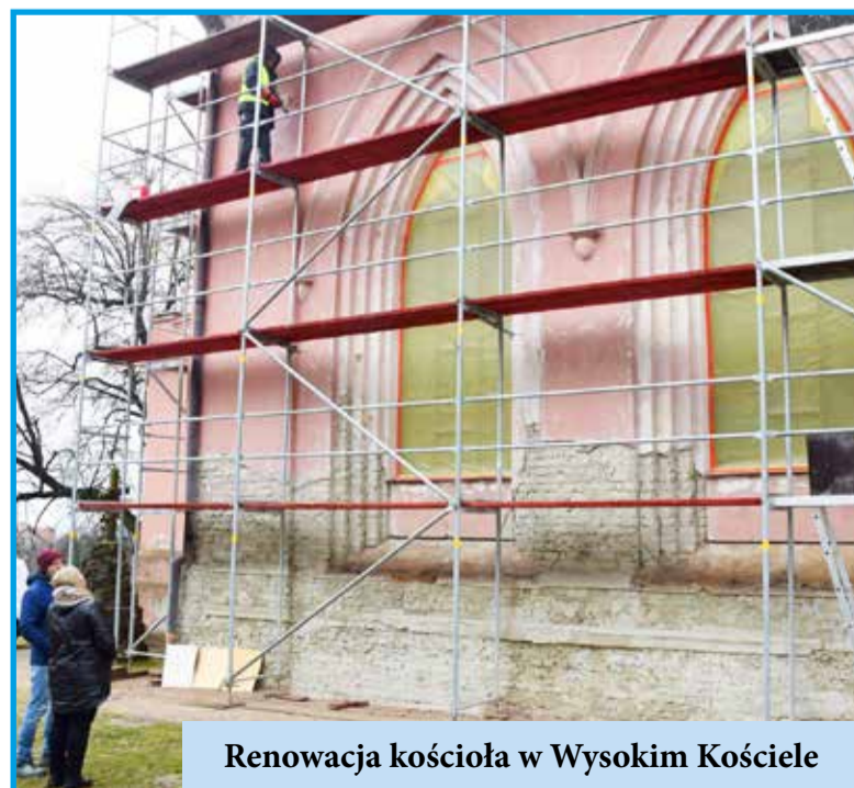
Renowacja kościoła w Wysokim Kościele