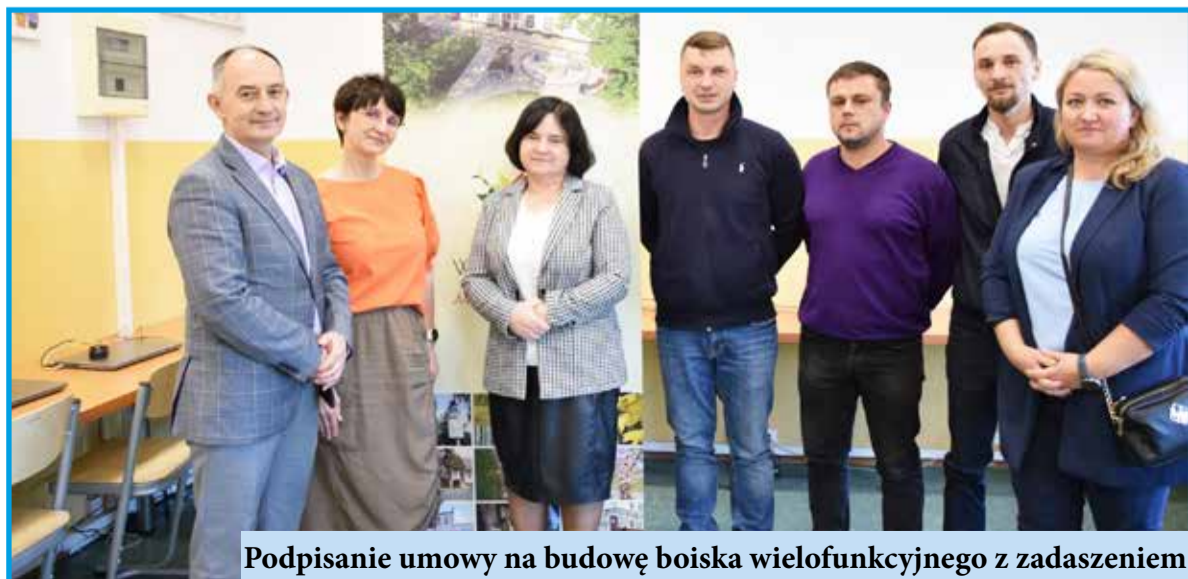
Podpisanie umowy na budowę boiska wielofunkcyjnego z zadaszeniem