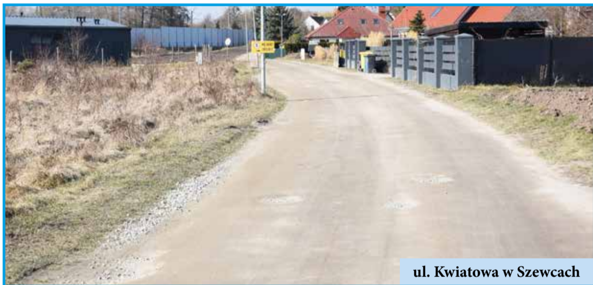
ul. Kwiatowa w Szewcach