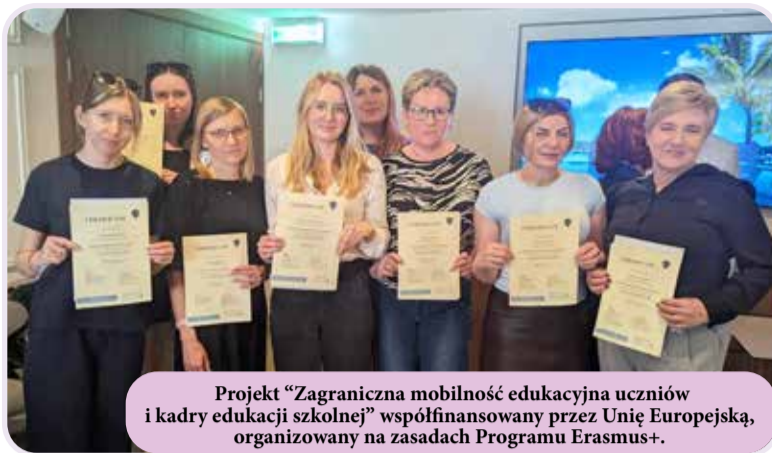
Projekt "Zagraniczna mobilność edukacyjna uczniów i kadry edukacji szkolnej" współfinansowany przez Unię Europejską, organizowany na zasadach Programu Erasmus+.

Podczas ferii zimowych ośmioosobowa grupa nauczycieli z Zespołu Szkolno - Przedszkolnego w Szewcach udała się na szkolenie, które odbyło się na Malcie. Uczestniczki przeszły cykl zajęć specjalistycznych dotyczących kreatywnego nauczania z wykorzystaniem nowoczesnych technologii oraz radzenia sobie z emocjami w klasie. Kadra poznała nowe metody, które będzie mogła wdrożyć w codziennej pracy. Oprócz zajęć specjalistycznych odbywały się również lekcje języka angielskiego. Zajęcia prowadzone były w języku angielskim przez nauczycieli akademickich, na co dzień pracujący na europejskich uczelniach