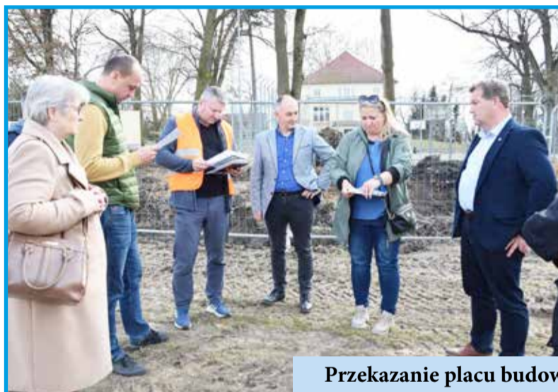
Przekazanie placu budowy pod budowę nowej szkoły