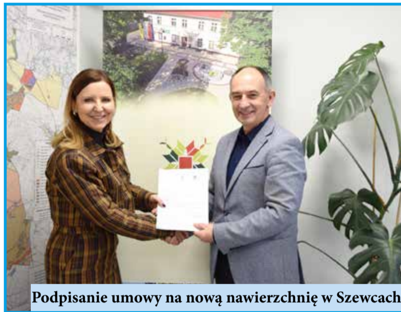
Podpisanie umowy na nową nawierzchnię w Szewcach

będą mogli uprawiać piłkę nożną, koszykówkę, siatkówkę, lekkoatletykę oraz tenis, co przyczyni się do ich rozwoju fizycznego. Zadanie jest dofinansowane z budżetu państwa w ramach programu "Olimpia - Program budowy przyszkolnych hal sportowych na 100-lecie pierwszych występów reprezentacji Polski na Igrzyskach Olimpijskich" oraz z budżetu Województwa Dolnośląskiego w ramach programu "Dolnośląski Fundusz Rozwoju Bazy Sportowej".