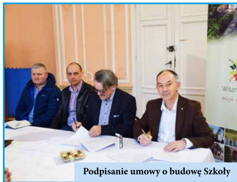
Podpisanie umowy o budowę Szkoły