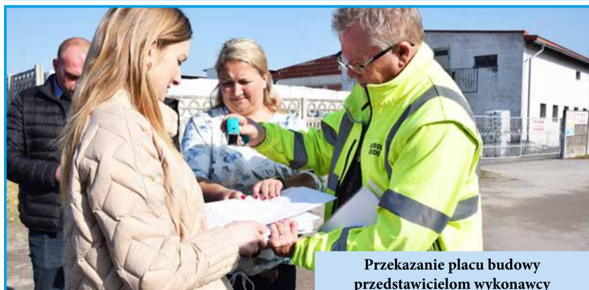
Przekazanie placu budowy przedstawicielom wykonawcy