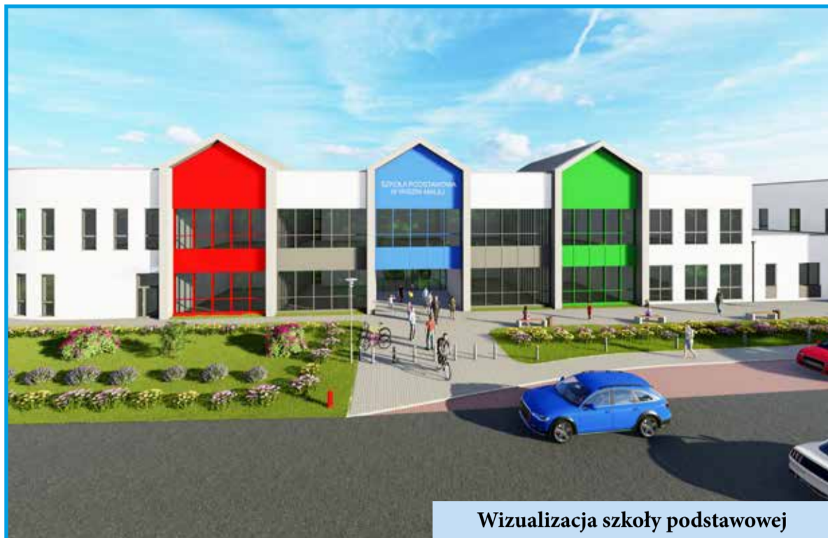
Wizualizacja szkoły podstawowej

Wszystkie te inwestycje to kolejny krok w stronę rozwoju Gminy Wisznia Mała. Dzięki nim poprawia się jakość życia mieszkańców, rozwija infrastruktura, a także zwiększa się dostęp do nowoczesnych obiektów edukacyjnych i sportowych. Gmina Wisznia Mała konsekwentnie realizuje projekty, które przyczyniają się do lepszej przyszłości całej społeczności.