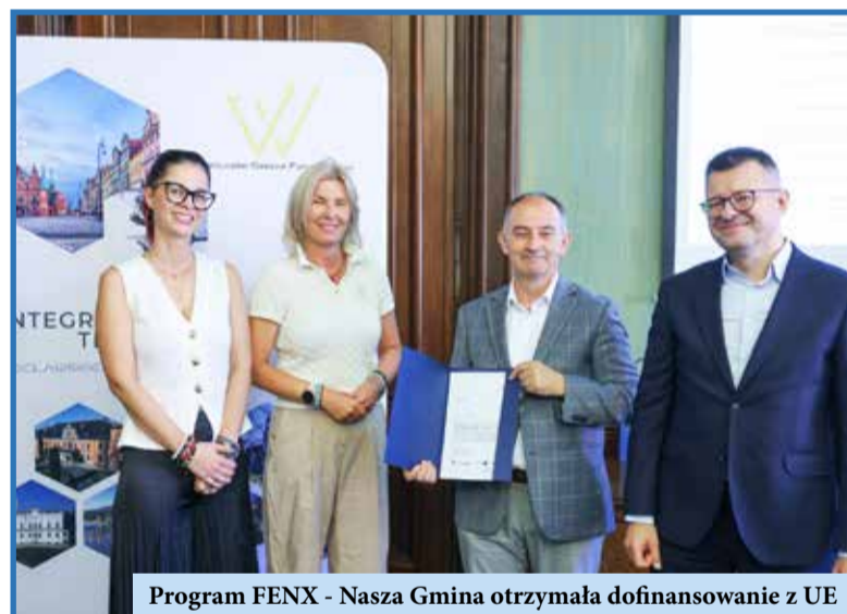
Program FENX - Nasza Gmina otrzymała dofinansowanie z UE