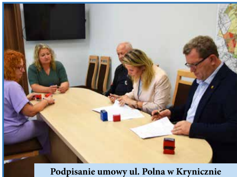
Podpisanie umowy ul. Polna w Krynicznie