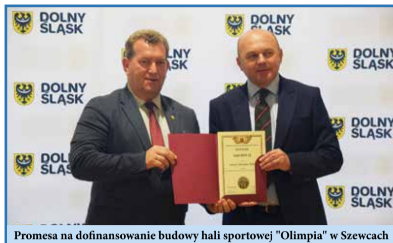
Promesa na dofinansowanie budowy hali sportowej "Olimpia" w Szewcach

Gratulujemy wszystkim zaangażowanym w te projekty – dzięki wspólnym staraniom Wisznia Mała konsekwentnie rozwija swoją infrastrukturę, stając się jeszcze bardziej przyjaznym miejscem do życia. Dzięki realizowanym inwestycjom gmina Wisznia Mała rozwija nowoczesną i przyjazną przestrzeń dla mieszkańców, sprzyjając edukacji, aktywności fizycznej oraz lepszej mobilności w codziennym życiu.