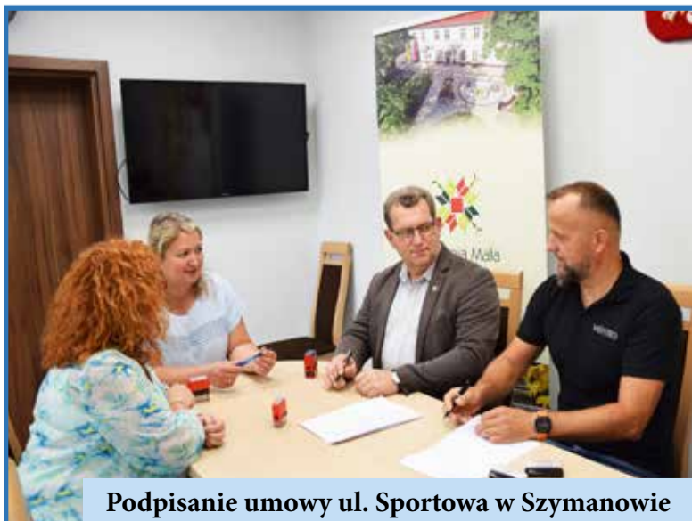
Podpisanie umowy ul. Sportowa w Szymanowie