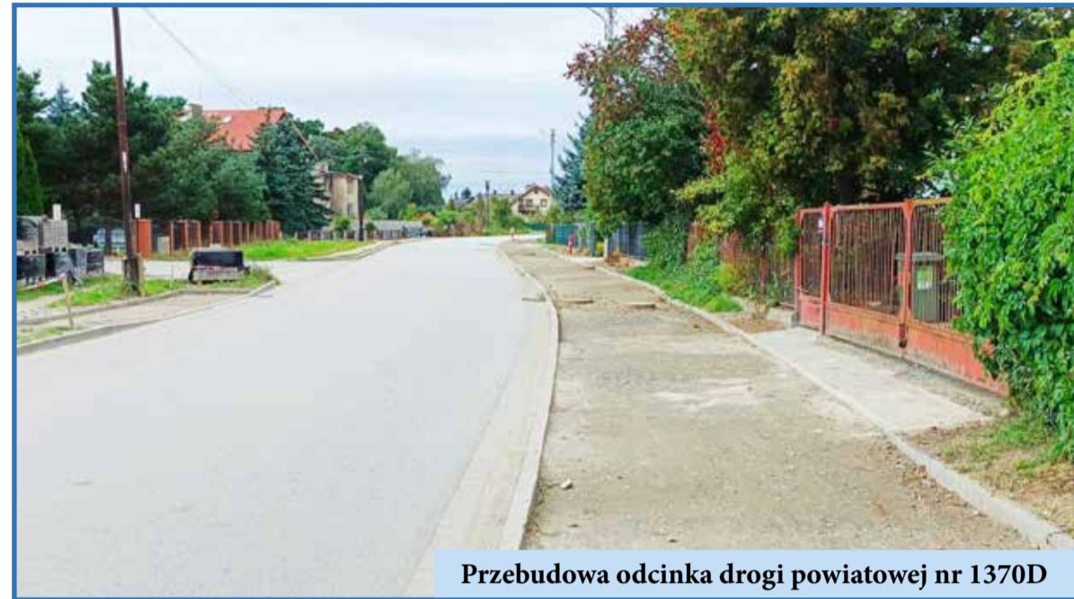
Przebudowa odcinka drogi powiatowej nr 1370D

że gmina nie zwalnia tempa i konsekwentnie stawia na rozwój infrastruktury drogowej oraz sportowo-rekreacyjnej. Dzięki pozyskanym środkom i dobrze zaplanowanym działaniom, Wisznia Mała staje się miejscem, które sprzyja zarówno codziennemu życiu mieszkańców, jak i aktywnemu spędzaniu wolnego czasu.