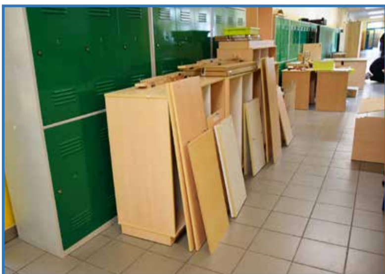
Nowe pomoce terapeutyczne, meble oraz sprzęt multimedialny