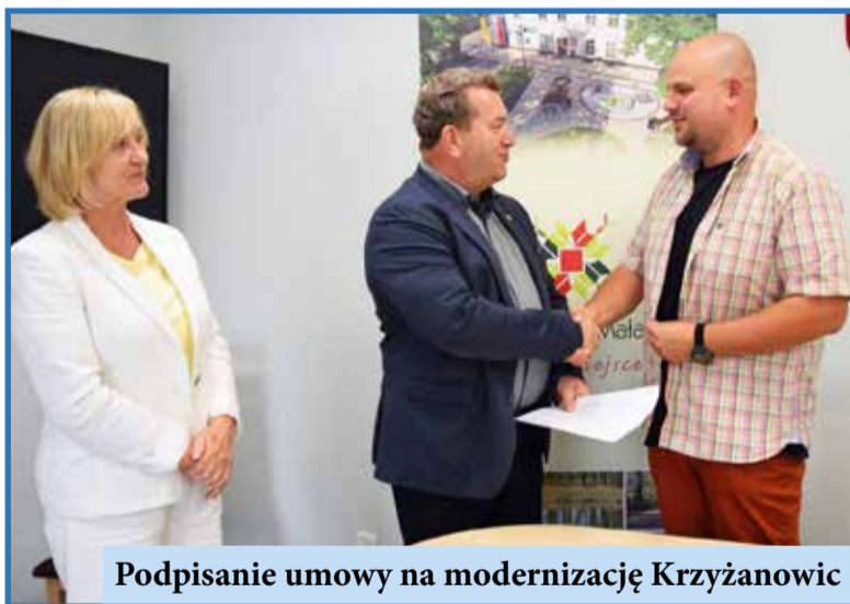
Podpisanie umowy na modernizację Krzyżanowic

że gmina nie zwalnia tempa i konsekwentnie stawia na rozwój infrastruktury drogowej oraz sportowo-rekreacyjnej. Dzięki pozyskanym środkom i dobrze zaplanowanym działaniom, Wisznia Mała staje się miejscem, które sprzyja zarówno codziennemu życiu mieszkańców, jak i aktywnemu spędzaniu wolnego czasu.