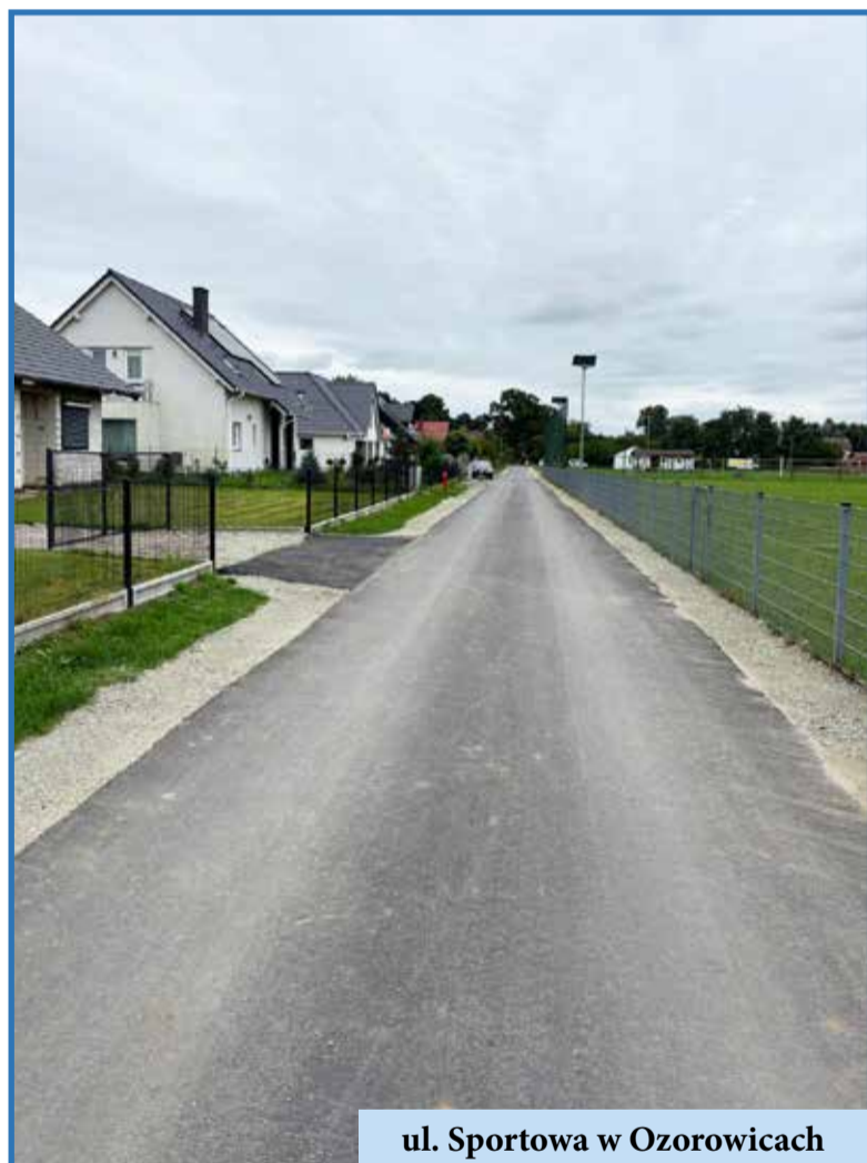
ul. Sportowa w Ozorowicach