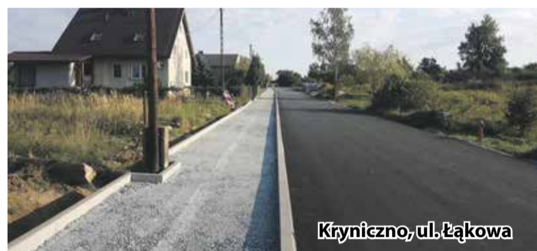
Krynicyzno, ul. Łąkowa