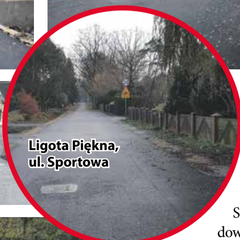
Ligota Piękna, ul. Sportowa