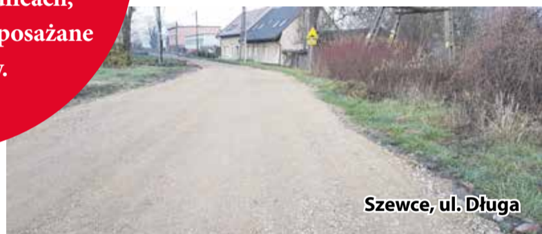
Szewce, ul. Długa

budowa pierwszego etapu przebudowy ulicy Łąkowej. Na odcinku 355 mb wykonano nawierzchnię asfaltową oraz zamontowano progi zwalniające. Zostały również wzmocnione pobocza gruntowe okalające drogę. Wartość zadania to ponad 195 tys. zł, na które gmina otrzymała dofinansowanie w wysokości 97785,00 zł z Funduszu Dróg