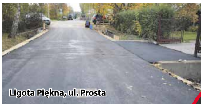
Ligota Piękna, ul. Prosta