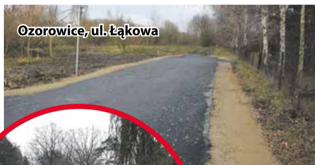
Ozorowice, ul. Łąkowa