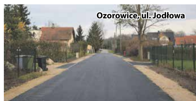
Ozorowice, ul. Jodłowa