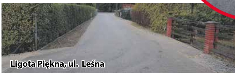
Ligota Piękna, ul. Leśna

zł, na które gmina otrzymała dofinansowanie z Funduszu Ochrony Gruntów Rolnych w wysokości 52,5 tys. zł.