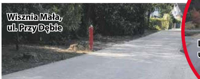
Wisznia Mała, ul. Przy Dębnie