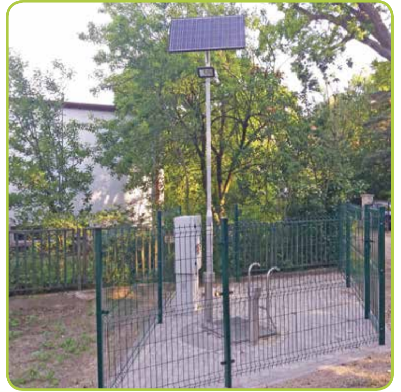
Fot. Pompownia na ul. Przy Dębnie w Wiszni Małej

rządkowaniem gospodarki wodno-ściekowej w gminie Wisznia Mała” współfinansowanego ze środków Europejskiego Funduszu Rozwoju Regionalnego w ramach Regionalnego Programu Operacyjnego Województwa Dolnośląskiego na lata 2014-2020.