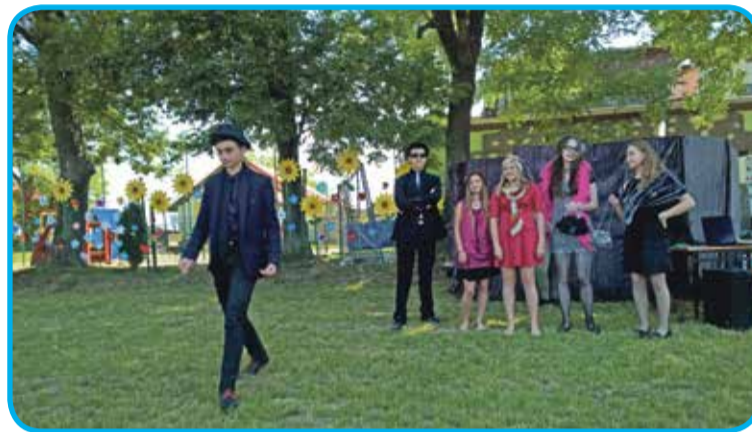
Fot. W czasie pikniku w ZSP w Szewcach odbyła się Wielka Gala Mody