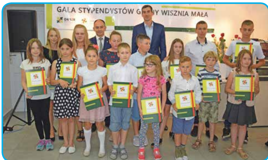
Fot. Stypendyści ze Szkoły Podstawowej w Krynicznie