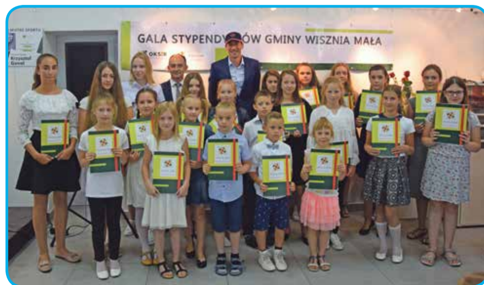
Fot. Stypendyści ze Szkoły Podstawowej w Wiszni Małej