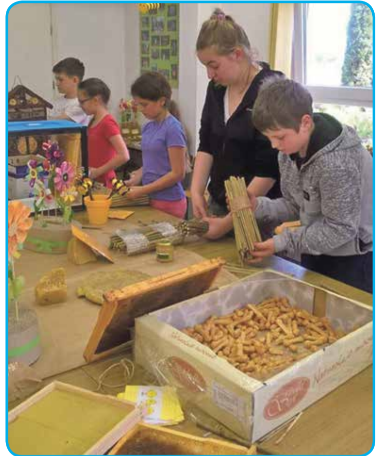
Fot. Uczniowie uczyli się samodzielnie wykonywać domki dla owadów