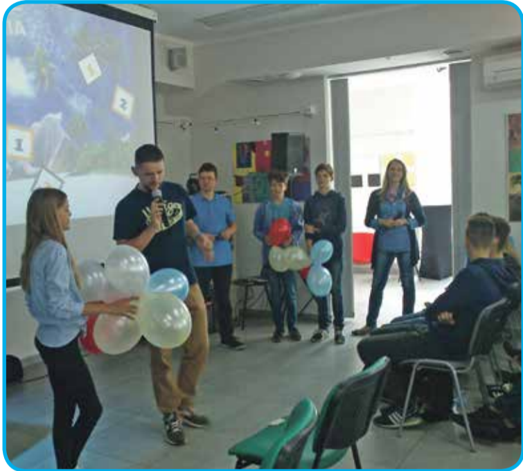
Fot. Uczniowie Szkoły Podstawowej w Krynicznie uczestniczyli w warsztatach profilaktycznych „Archipelag Skarbów”