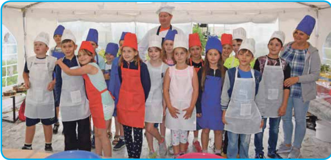
Fot. Młodzi kucharze w Stacji Badawczo-Dydaktycznej Roślin Warzywnych i Ozdobnych Katedry Ogrodnictwa w Psarach

kowo znacznie poszerzyły wiedzę młodzieży o otaczającym nas ekosystemie. Następny cykl warsztatów już we wrześniu.