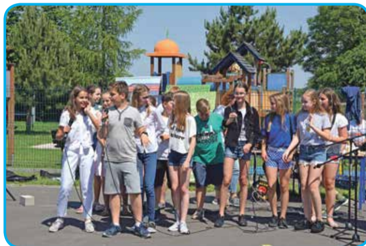
Fot. Występ artystyczny uczniów ze szkoły w Krynicznie