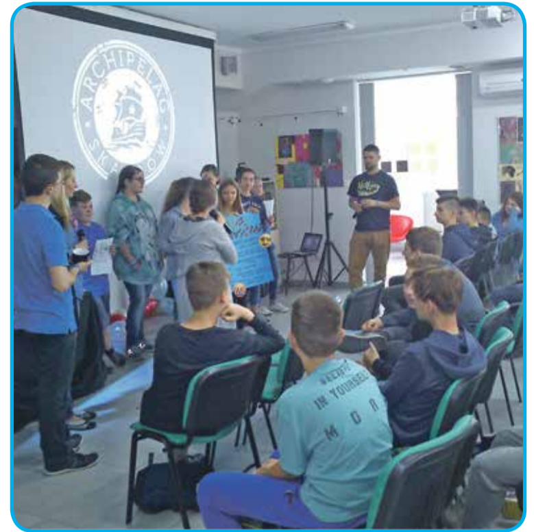
Fot. Uczniowie aktywnie brali udział w warsztatach

Uwieńczeniem dwudniowych warsztatów był „festiwal twórczości”, podczas którego młodzi ludzie mogli zaprezentować zdobytą