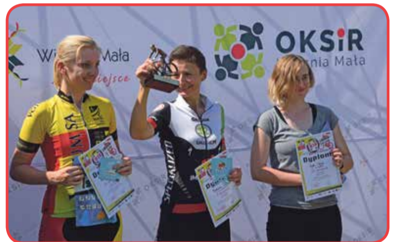
Fot. Dekoracja w kategorii open kobiet

A już dzisiaj zapraszamy na kolejne zawody MTB Cross Country, które odbędą się 6 października 2018 r. w Wysockim Kościele.