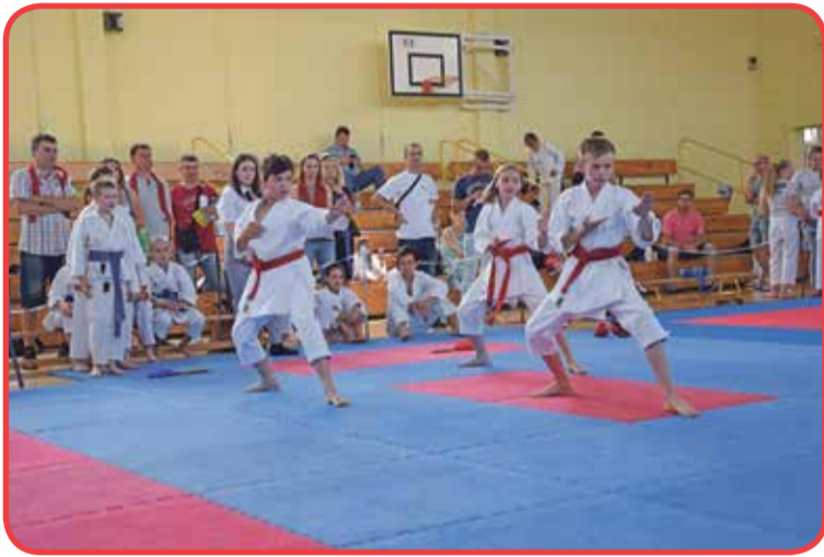
Fot. Start zawodników Dolnośląskiego Klubu Karate JINKAKU KANSEI