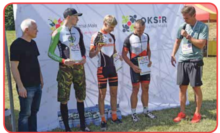
Fot. Dekoracja w kategorii open mężczyzn