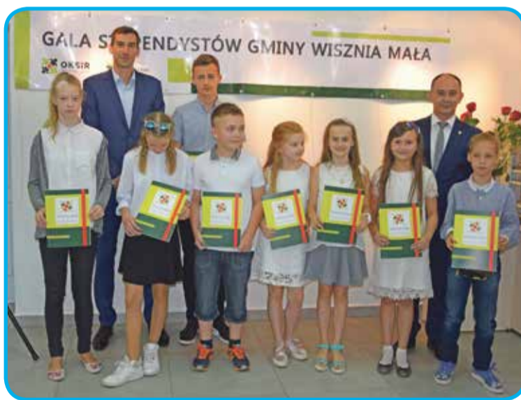
Fot. Stypendyści ze Szkoły Podstawowej w Psarach