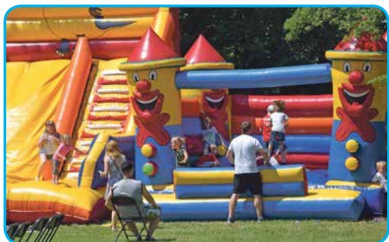
Fot. Dmuchańce cieszyły się dużym powodzeniem wśród młodszych dzieci