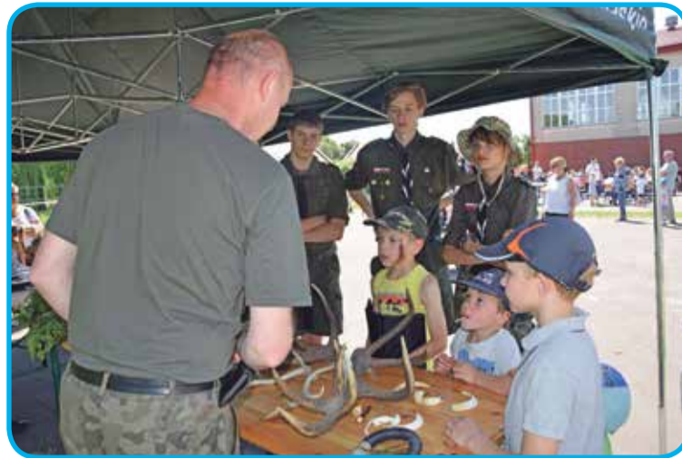
Fot. Powodzeniem cieszyło się stoisko Lasów Państwowych

Pikniki Rodzinne upłynęły w radosnej, rodzinnej atmosferze, wszystkim dopisywały humory.