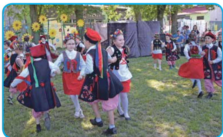
Fot. Pokaz tańca krakowiak w wykonaniu uczniów Zespołu Szkolno-Przedszkolnego w Szewcach