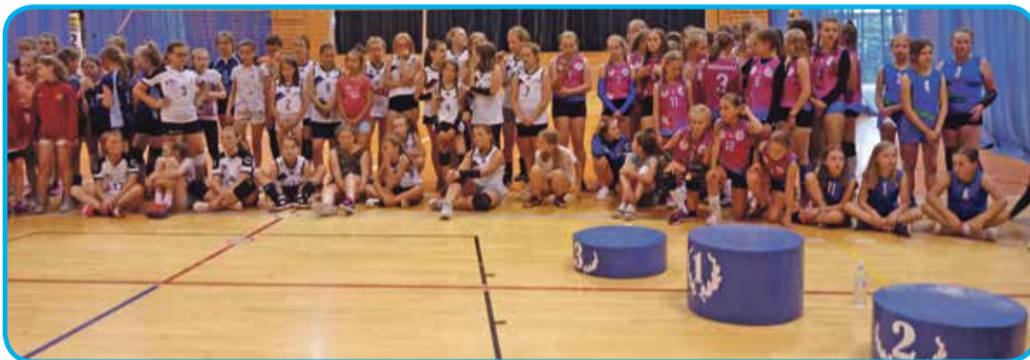
Fot. Uczestniczki turnieju organizowanego w ramach programu „Upowszechnianie Piłki Siatkowej”