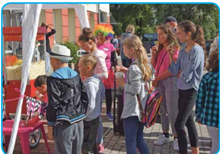
Fot. Dużym powodzeniem cieszyło się stoisko z watą cukrową i popcornem

Po części oficjalnej przyszedł czas na wspólną zabawę. Dzieci miło spędziły czas w radosnej atmosferze i dobrych humorach. Teraz czas na długie, bo trwające 73 dni, wakacje.