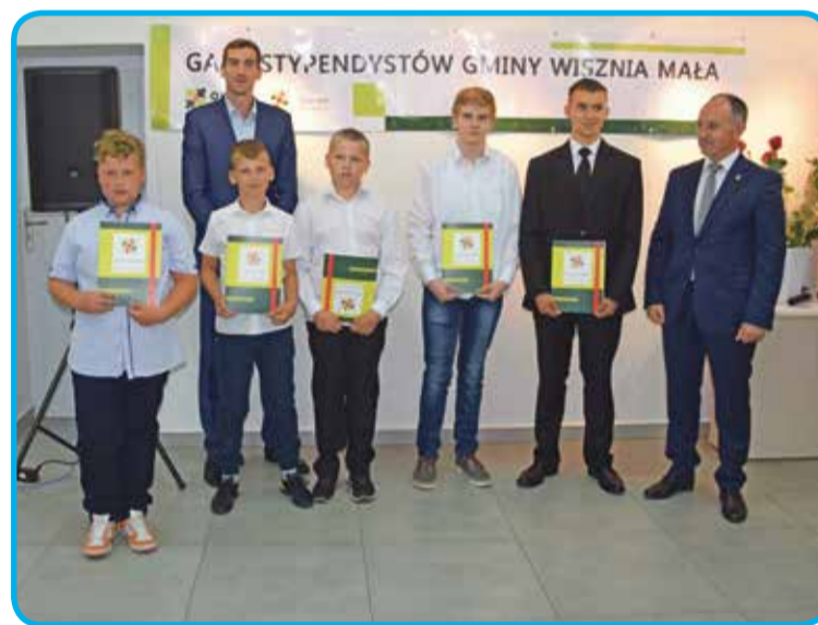
Fot. Stypendyści z Zespołu Szkolno-Przedszkolnego w Szewcach