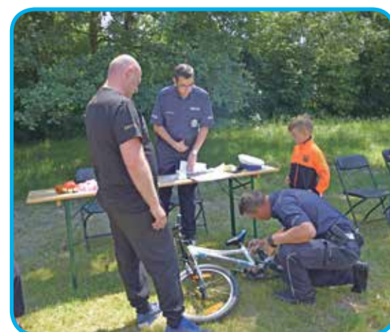
Fot. W czasie festynu w Psarach była możliwość oznakowania swoich rowerów