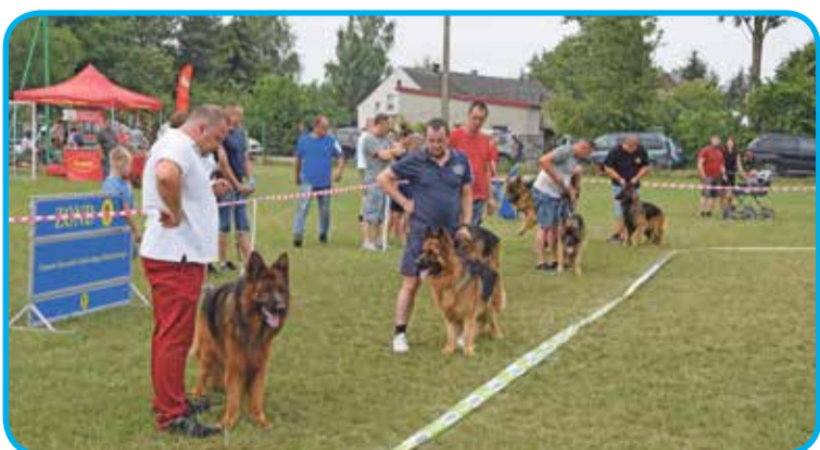
Fot. Prezentacja owczarków długowłosych

czał wójt Jakub Bronowicki. Po zawodach był czas na zabawę, dla najmłodszych zostały przygotowane gry i zabawy animacyjne. Przez kilka godzin spędzonych nad wodą panowała radosna i rodzinna atmosfera.