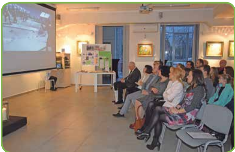
Fot. Podczas spotkania został wyświetlony film dokumentalny Instytutu Pamięci Narodowej pt. „Zapora”