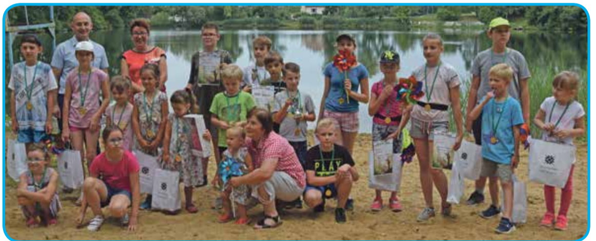
Fot. Uczestnicy pikniku wędkarskiego

W niedzielę 10 czerwca młodzi wędkarze próbowali swoich sił na Pikniku Rodzinnym w Wiszni Małej organizowanym przez Stowarzyszenie „Pod Dębami”. W zawodach wędkarskich wzięło udział 27 uczestni-