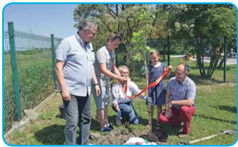
Fot. Na pamiątkę zostało zasadzone drzewo - platan klonolistny