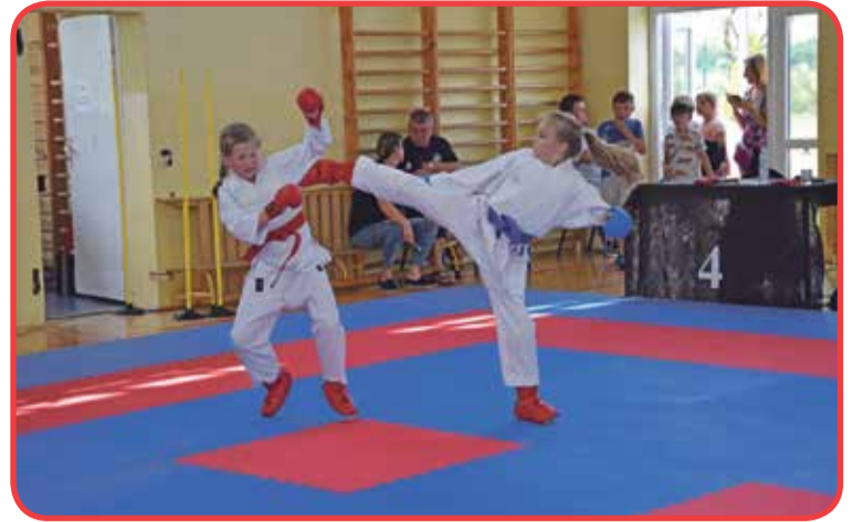
Fot. Start Klaudii Łobaczewskiej

Konkurencja chłopców 2009-2010 i młodszych zakończyła się zwycię-