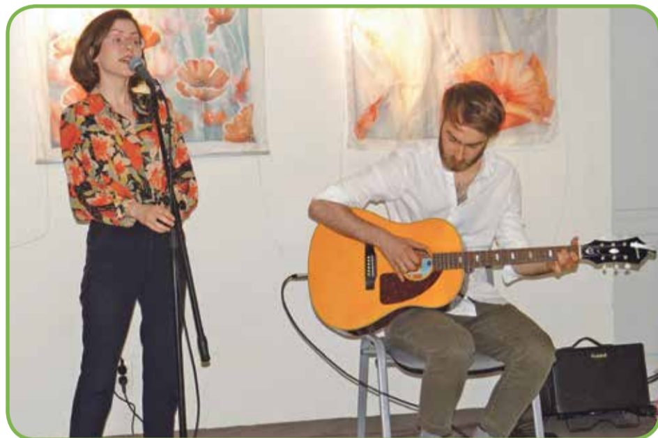
Fot. Goście wysłuchali koncertu Edyty Góreckiej