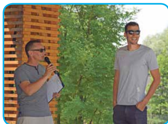
Fot. W trakcie festynu można było także zamienić kilka słów z mistrzem świata w sztafecie 4 x 400 metrów - Rafałem Omelko