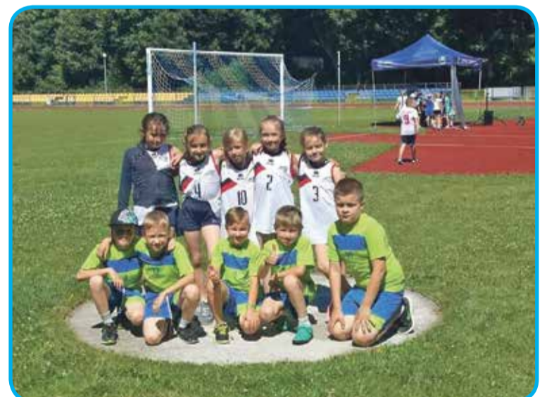
Fot. Reprezentacja ze Szkoły Podstawowej w Krynicznie

Ósmego czerwca uczniowie kl. II ze Szkoły Podstawowej w Krynicznie reprezentowali gminę Wisznia Mała w Zawodach Powiatowych w trójboju lekkoatletycznym w Trzebnicy. W trzech konkurencjach: skok w dal, bieg na 60 m i rzut piłeczką palantową, nasi