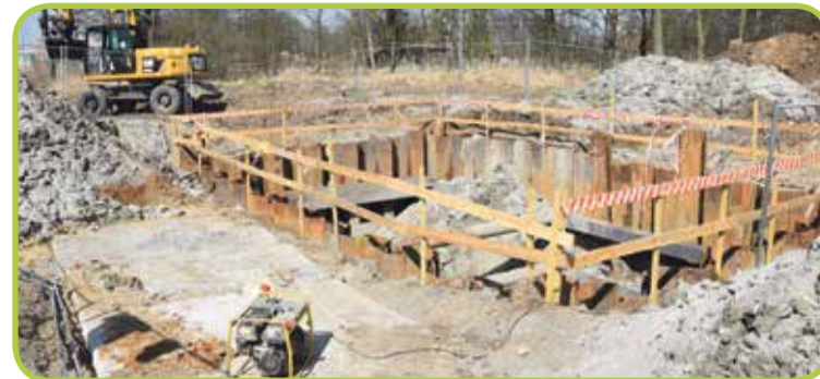
Fot. Rozpoczęła się budowa przepompowni ścieków PP 1 w Psarach

Celem projektu jest wyposażenie w zbiorczą sieć kanalizacji sanitarnej miejscowości gminy Wisznia Mała współtworzących aglomerację Wrocław. Inwestycja ta jest kluczowa dla naszej gminy i stanowi początek kanalizowania w przyszłości kolejnych miejscowości