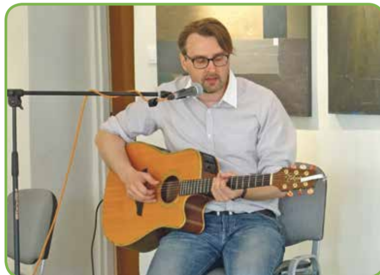
Fot. Koncert Graftmanna w OKSiR w Wisznie Małej