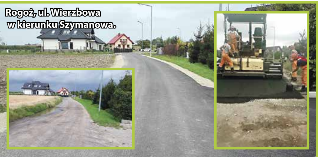
Rogoź, ul. Wierzbowa w kierunku Szymanowa.