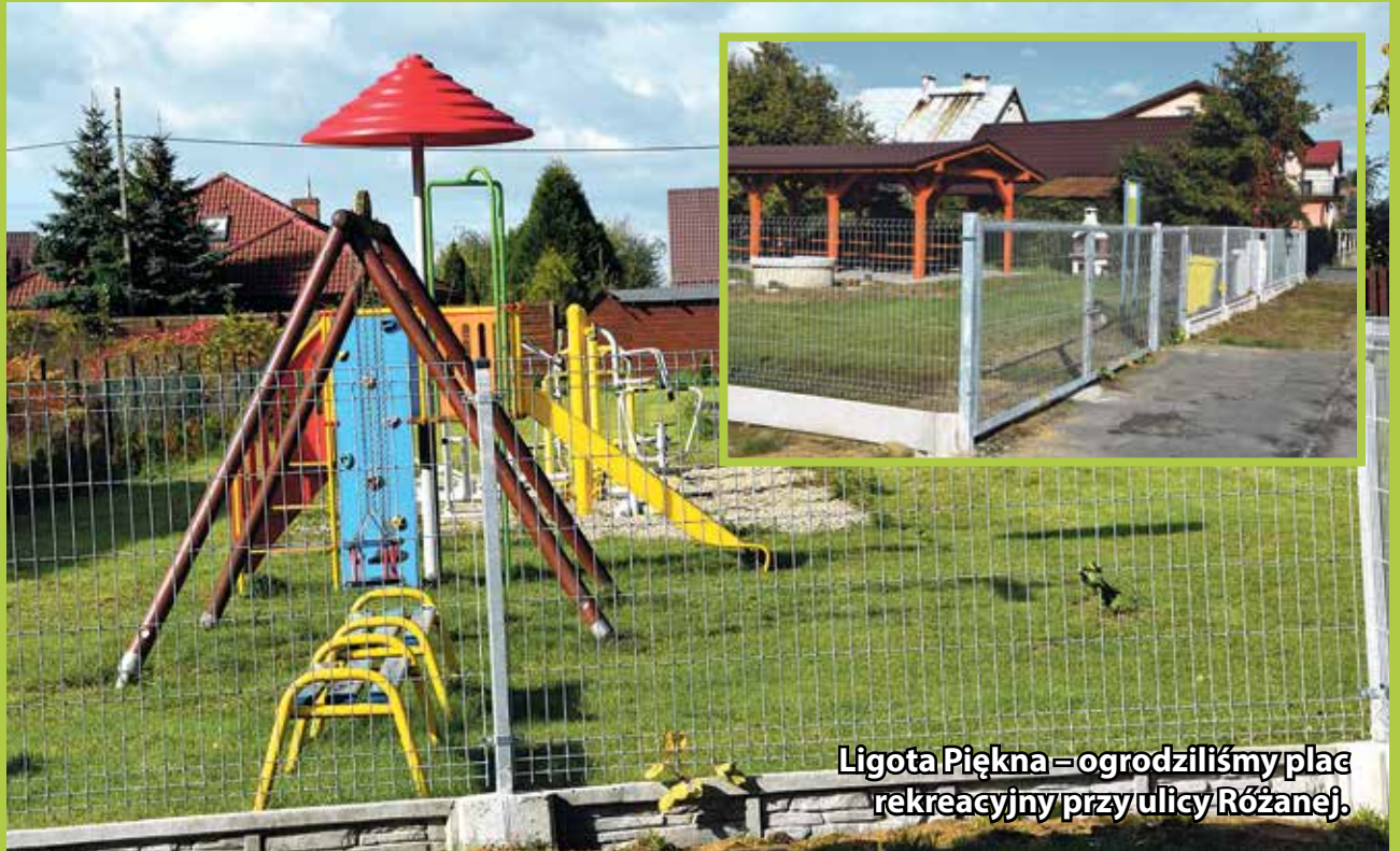
Ligota Piękna – ogrodziliśmy plac rekreacyjny przy ulicy Różanej.

Na terenie całej gminy istnieje szeroka baza rekreacyjna, która służy dzieciom, młodzieży oraz dorosłym mieszkańcom. W każdej miejscowości jest co najmniej jeden plac zabaw oraz w wielu miejscach gminy znajdują się boiska sportowe. Wszystkie place zabaw i siłownie zewnętrzne są na bieżąco remontowane i wyposażane zgodnie z potrzebami zgłaszanymi przez mieszkańców.