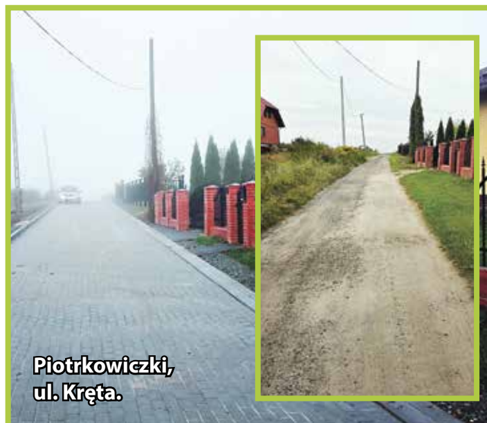
Piotrkowiczki, ul. Kręta.