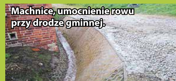
Machnice, umocnienie rowu przy drodze gminnej.