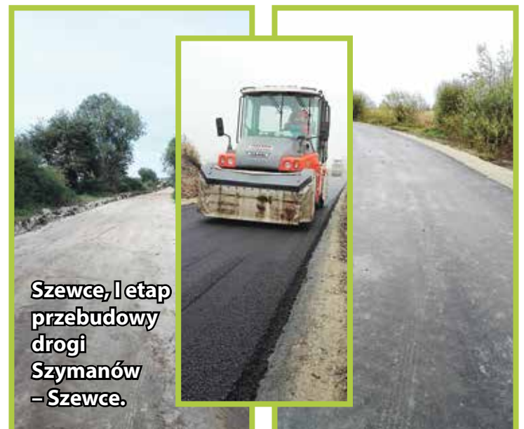
Szewce, I etap przebudowy drogi Szymanów – Szewce.