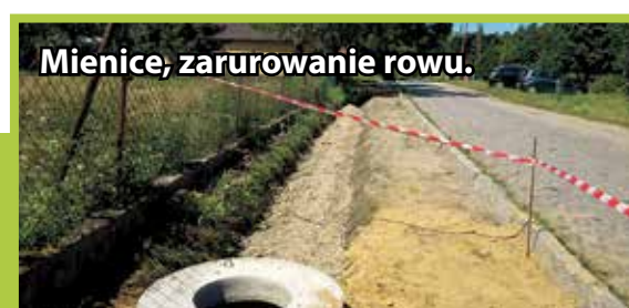
Mienice, zarurowanie rowu.