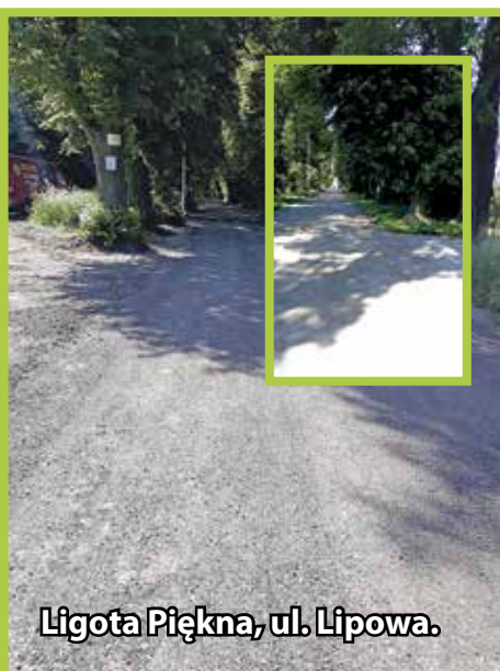
Ligota Piękna, ul. Lipowa.