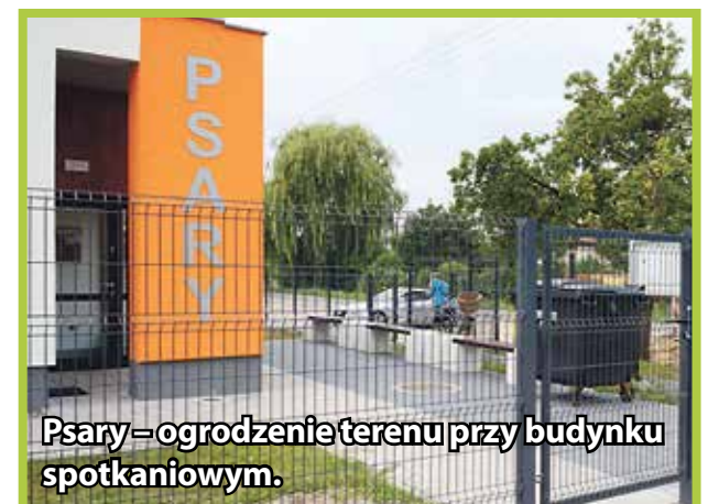
Psary – ogrodzenie terenu przy budynku spotkaniowym.