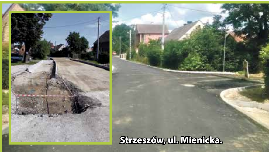
Strzeszów, ul. Mienicka.