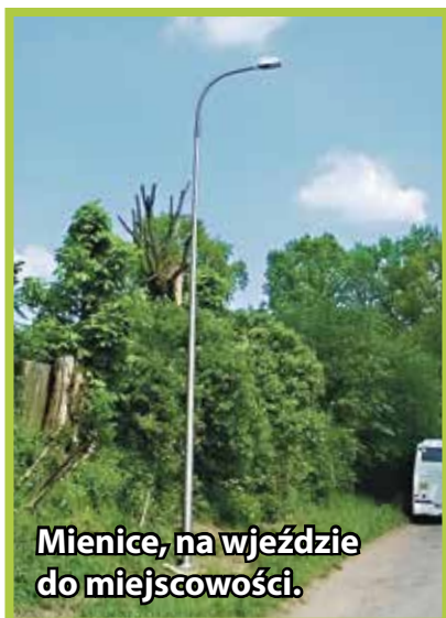
Mienice, na wjeździe do miejscowości.