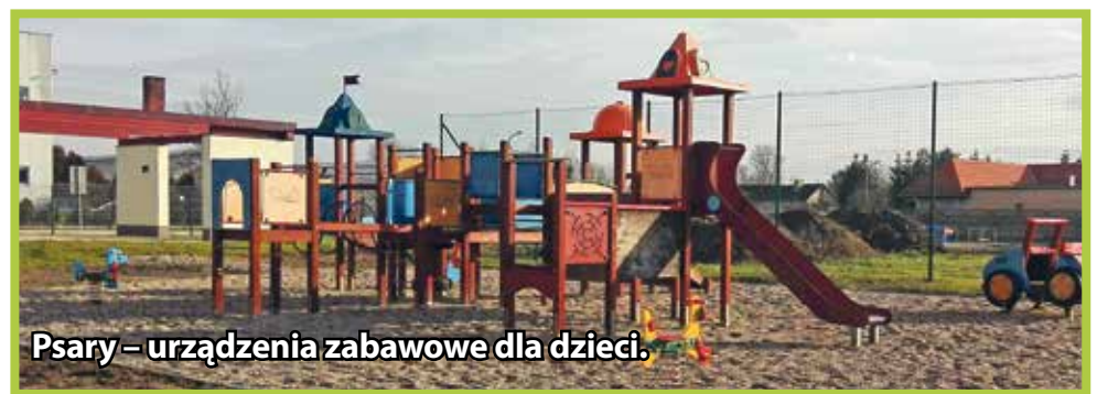
Psary – urządzenia zabawowe dla dzieci.