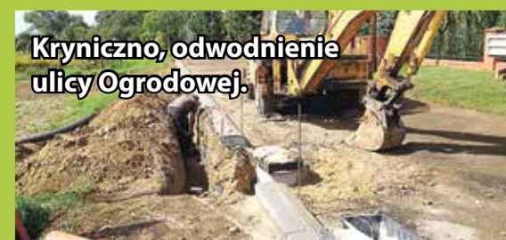
Krynicy, odwodnienie ulicy Ogrodowej.