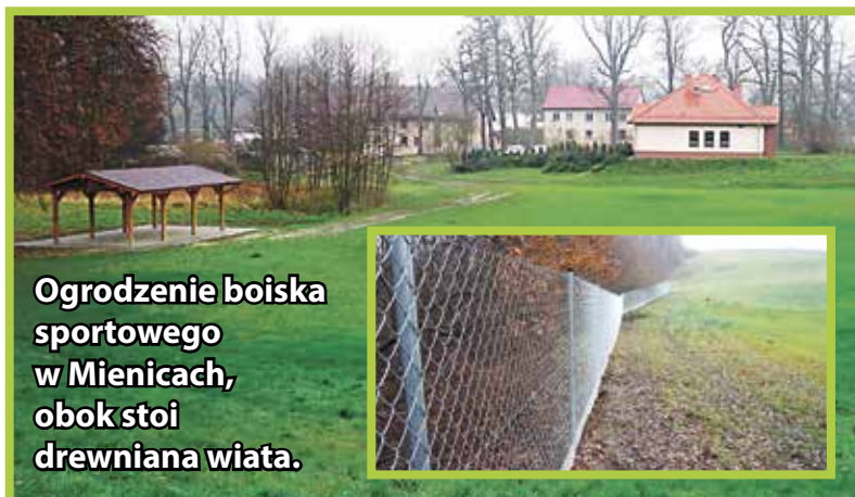
Ogrodzenie boiska sportowego w Mienicach, obok stoi drewniana wiata.