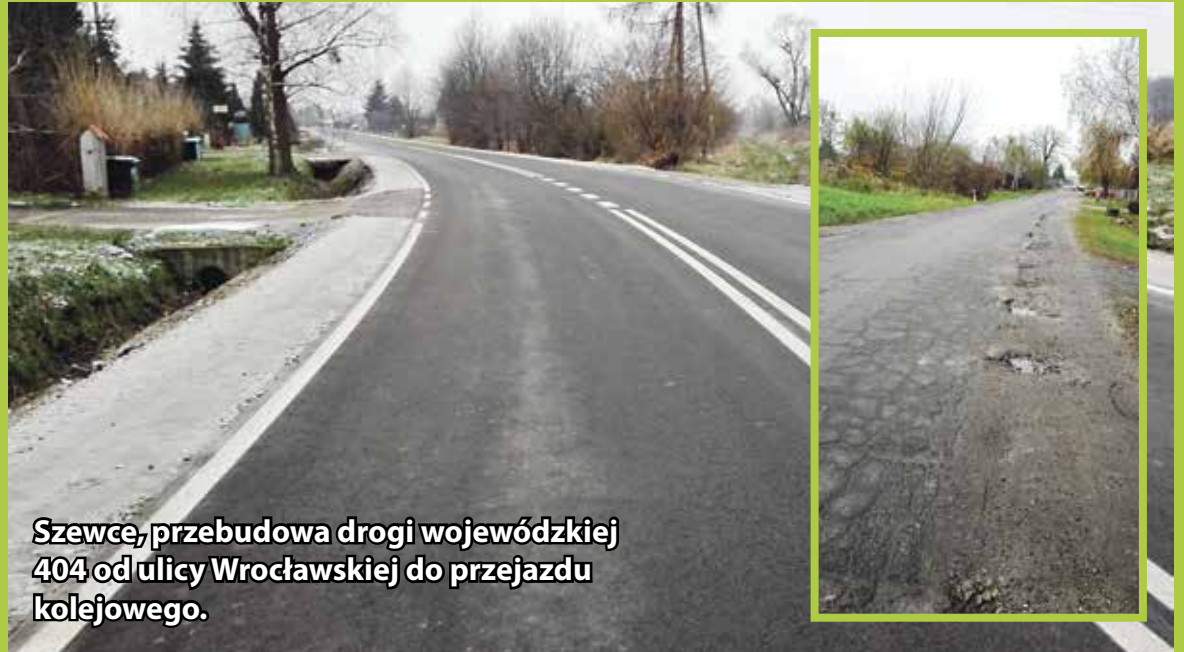
Szewce, przebudowa drogi wojewódzkiej 404 od ulicy Wrocławskiej do przejazdu kolejowego.

Przez cały rok trwają intensywne prace inwestycyjne na terenie całej gminy. Duża ich część dotyczy budowy ulic, które są niezmiernie ważne i konieczne dla użytkowników dróg. Potrzeb jest dużo więcej niż możliwości ich realizacji, ale sukcesywnie, w miarę posiadanych środków staramy się poprawiać warunki i komfort życia mieszkańców.