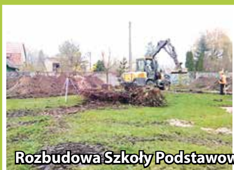
Rozbudowa Szkoły Podstawowej w Psarach.

Rozbudowa szkoły w Psarach o wartości: 7,9 mln zł