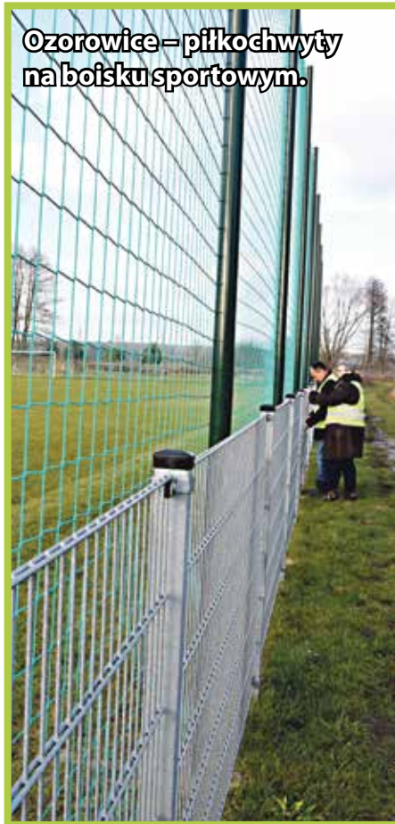
Ozorowice – piłkochwyty na boisku sportowym.

Zadbaliśmy również o poprawę infrastruktury sportowej (przy współudziale funduszy sołeckich):