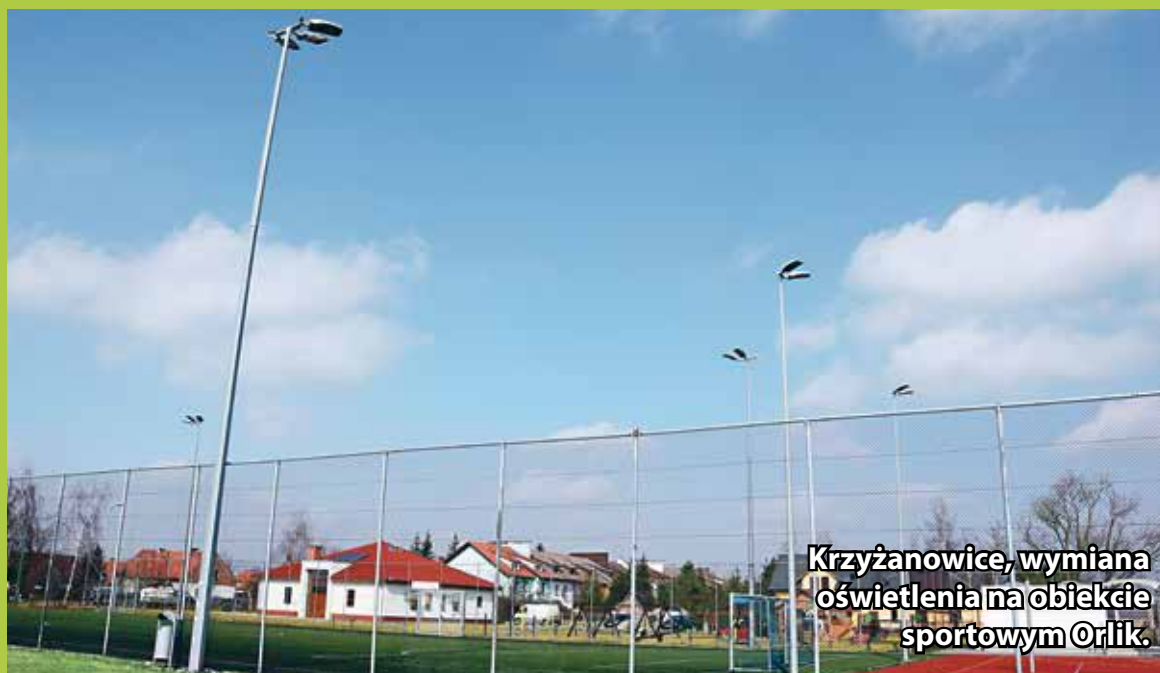
Krzyżanowice, wymiana oświetlenia na obiekcie sportowym Orlik.