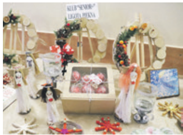
Rękodzieła przygotowane przez członków Klubu „Senior+” w Ligocie Pięknej