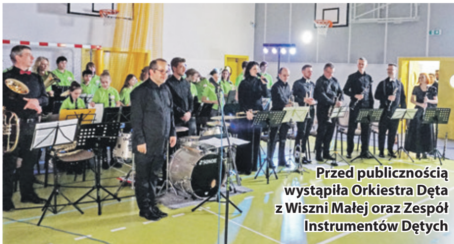
Przed publicznością wystąpiła Orkiestra Dęta z Wiszni Małej oraz Zespół Instrumentów Dętych

Główny punkt programu poprzedził występ zespołów w utworze z repertuaru Czerwonych Gitar pt. „Dzień jeden w roku”, a solistką była