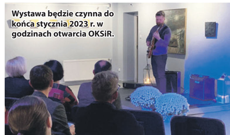
Wystawa będzie czynna do końca stycznia 2023 r. w godzinach otwarcia OKSiR.