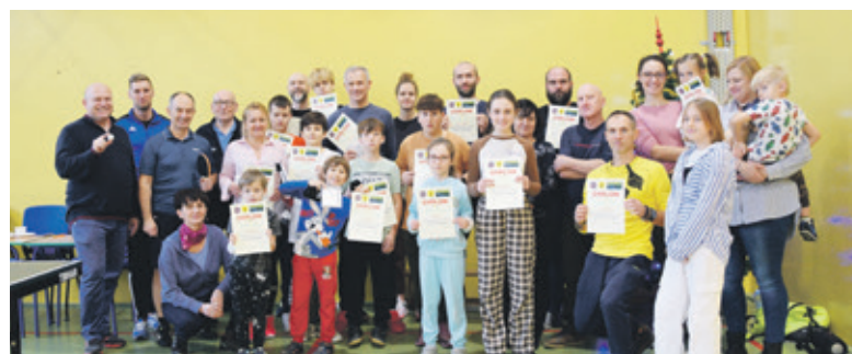
Uczestnicy Rodzinnego Mikołajkowego Turnieju Tenisa Stołowego

W turnieju brali udział uczniowie, jak również ich rodzice i zaproszeni goście. Rozgrywki były prowadzone w czterech kategoriach: dziecko + krewny, turniej indywidualny dzieci do lat 10 i w