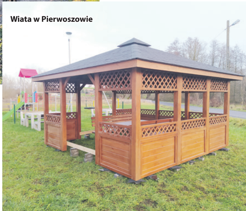
Wiaty w Pierwoszowie

Nowe wiaty znalazły się w: • Rogożu (koszt ponad 46 tys., w tym 20 tys. zł z FS), • Pierwoszowie (koszt 21 tys. zł, w tym 6 tys. z FS), • Szymanowie (koszt 21 tys. zł, w tym 10 tys. z FS), • Szewcach (koszt ok. 39 tys. zł, w tym 35,5 tys. zł z FS).