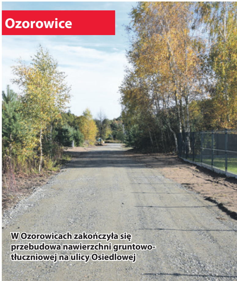
W Ozorowicach zakończyła się przebudowa nawierzchni gruntowo-tłuczniowej na ulicy Osiedlowej

Z kolei w Ozorowicach na ulicach Osiedlowej i Nad Mienia, we współpracy z mieszkańcami (którzy zakupili materiał do utwardzenia drogi) została