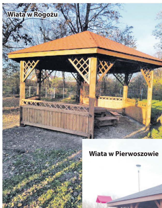
Wiaty w Rogożu

Wsołectwach naszej gminy przybywa miejsc, w których mieszkańcy mogą spędzać czas i wspólnie integrować się. Każdego roku są one wzbogacane o kolejne elementy małej architektury zgodnie z wolą mieszkających tam osób. Część środków finansowych na ten cel pochodzi z funduszy sołeckich. W IV kwartale bieżącego roku zostały zakupione 4 wiaty, które będą służyć lokalnej społeczności. Podbudowa pod nie zostanie wykonana w 2023 r.