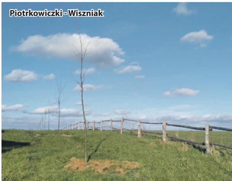
Piotrkowiczki - Wiszniak

Sadzenie roślin miododajnych jest jednym z najważniejszych działań mających na celu zwiększenie liczby pszczół i innych owadów zapylających oraz wzbogacenie różnorodności biologicznej środowiska.