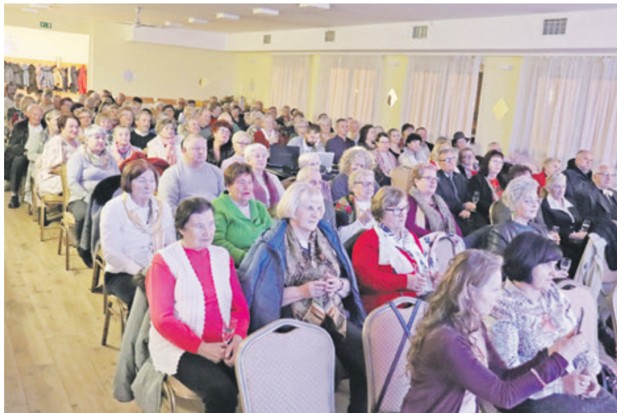
Wiszeński Dzień Seniora w Szymanowie zgromadził liczną publiczność