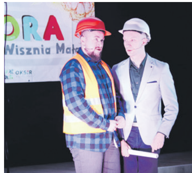
Atrakcją wieczoru był występ Kabaretu z Konopi, który wprowadził widzów w znakomity nastrój