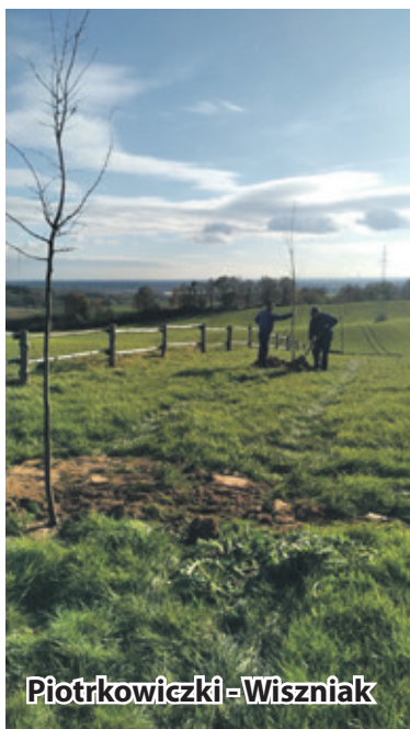
Piotrkowiczki - Wiszniak

Sadzenie roślin miododajnych jest jednym z najważniejszych działań mających na celu zwiększenie liczby pszczół i innych owadów zapylających oraz wzbogacenie różnorodności biologicznej środowiska.