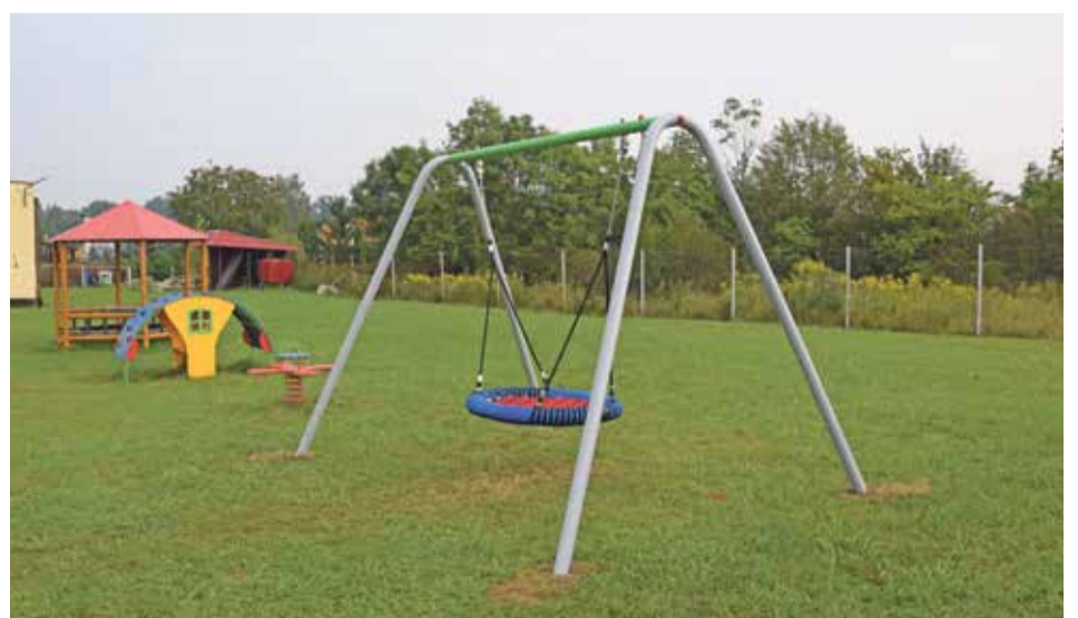
Fot. Bocianie gniazdo - jedna z atrakcji zamontowana na placu zabaw w Wiszni Małej