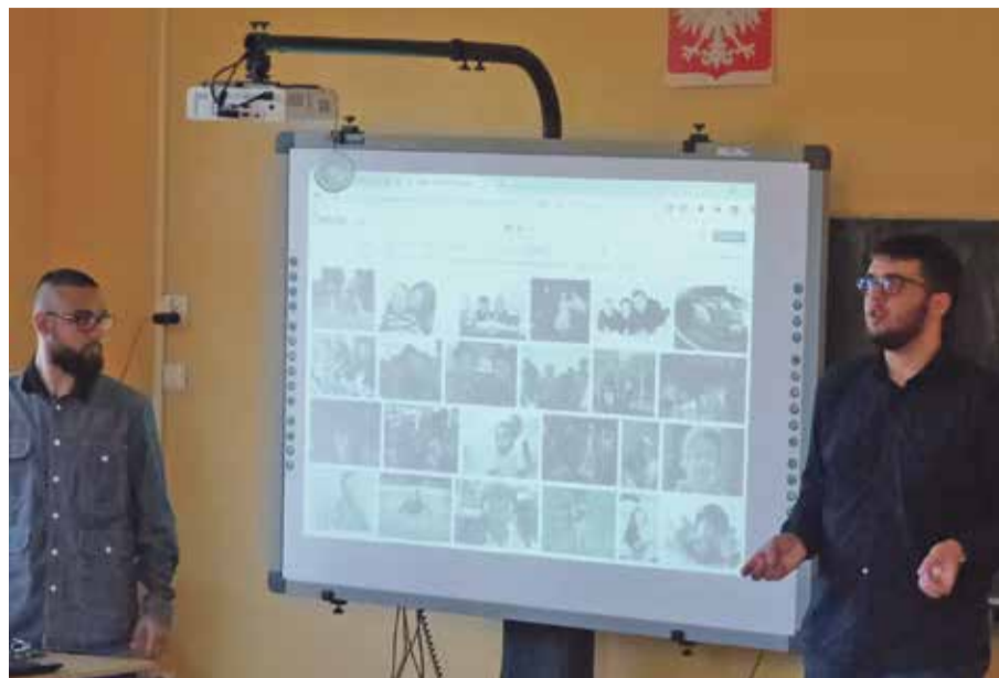
Fot. W ramach projektu „Wzrost jakości edukacji w szkołach gminy Wisznia Mała” odbyły się szkolenia nauczycieli

Uzupełnieniem powyższego przedsięwzięcia będzie projekt złożony 23 sierpnia