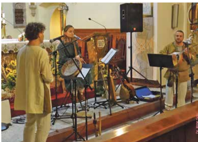
Fot. Koncert pt. „Muzyka z przeszłości, rekonstrukcja, stylizacja” w wykonaniu zespołu Huslar.

Ostatni z koncertów na terenie naszej gminy odbędzie się 1 października o godz. 19.00 w Szewcach, w Kościele pw. Św. Anny. Będzie to występ pt. „Z dźwiękami gitary”, na który serdecznie zapraszamy.