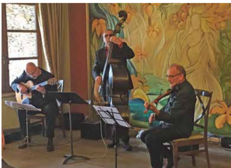
Fot. Koncert pt. „Chopin na strunach” w Miłocinie