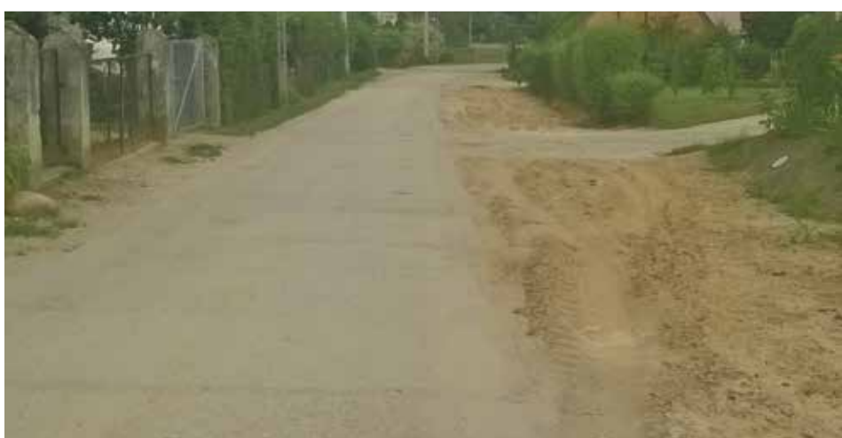
Fot. Ulica Mienicka w Strzeszowie przed przebudową