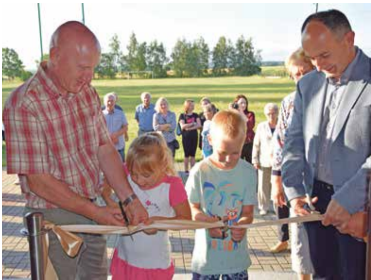
Fot. Otwarcie świetlicy w Szewcach

W okresie wakacyjnym zostały uroczystie otwarte dwie świetlice, które przeszły modernizację. To kolejne świetlice w gminie Wisznia Mała, które w tym roku przeszły gruntowny remont.