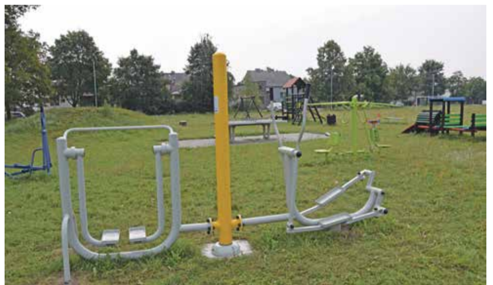
Fot. Psary ul. Kasztanowa