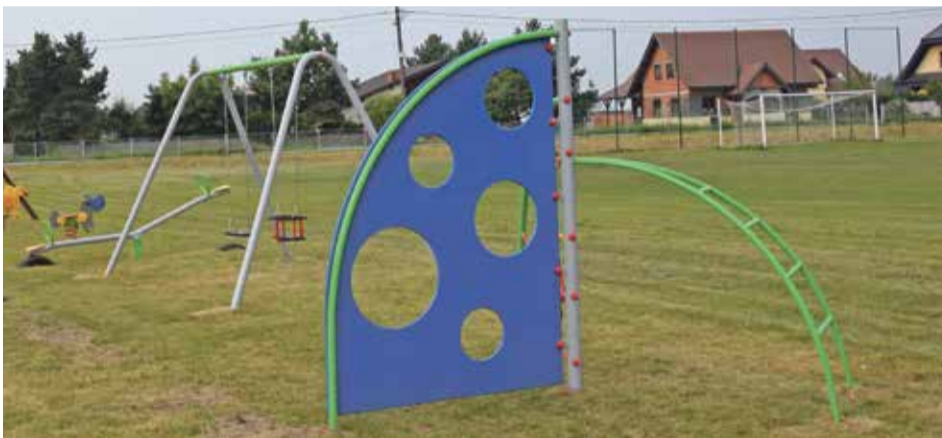
Fot. Szymanów ul. Sportowa