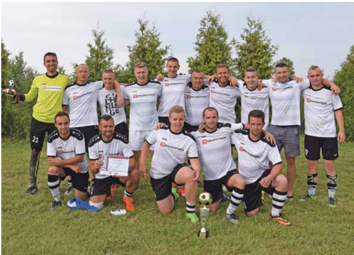
W tegorocznym turnieju tytuł mistrza zdobyła drużyna LKS Krzyżanowice