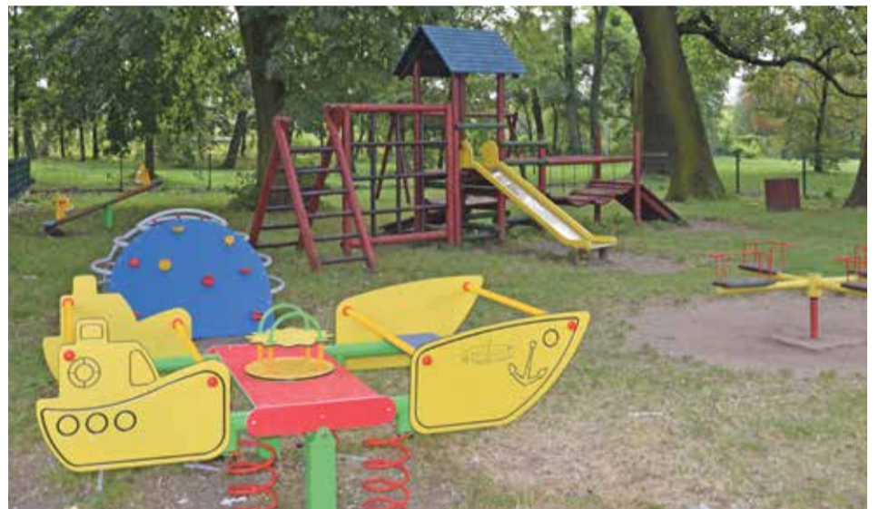
Fot. Szymanów ul. Lipowa