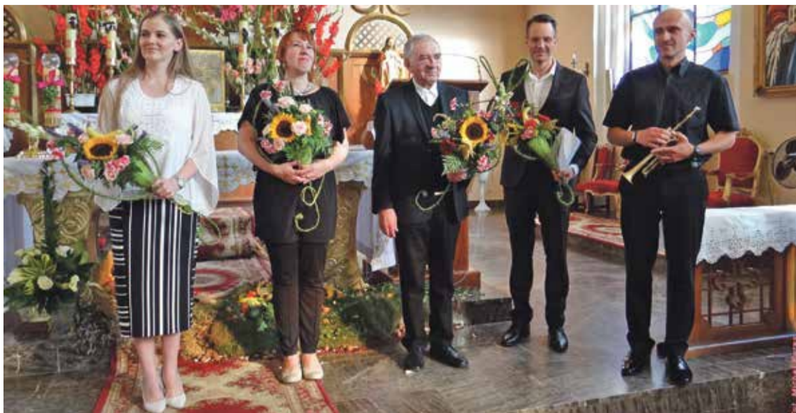
Fot. Inauguracyjny spektakl słowno – muzyczny pt. „Być dobrym jak chleb”

„Być dobrym jak chleb” tym inauguracyjnym występem rozpoczął się XXIV Międzynarodowy Festiwal Muzyki Kameralnej i Organowej Trzebnica 2017. Impreza należy do najważniejszych wydarzeń kulturalnych Dolnego Śląska i co roku gromadzi coraz większą publiczność. Współorganizatorem festiwalu jest gmina Wisznia Mała. Festiwal przypomina o chrześcijańskich korzeniach Polski