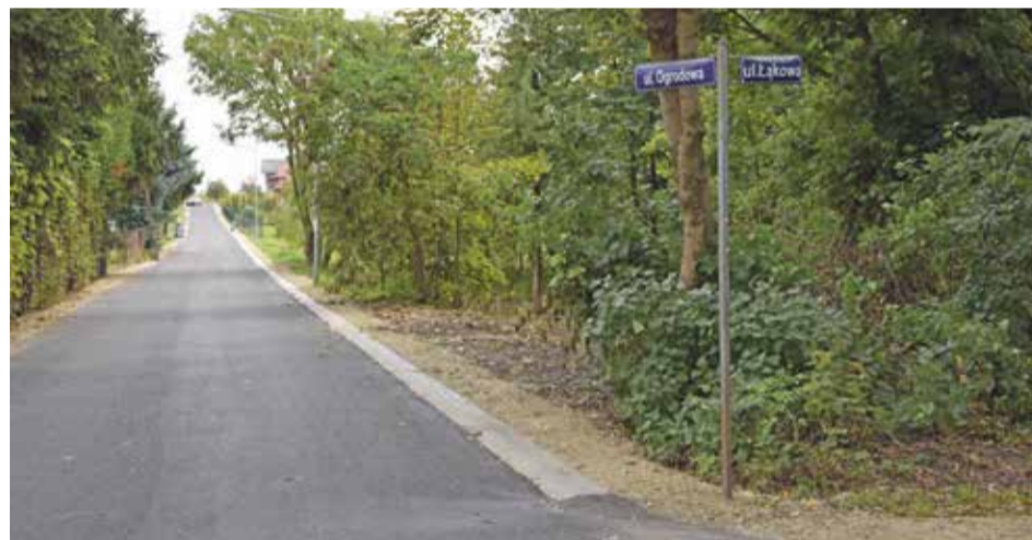
Fot. Ulica Ogrodowa w Krynicznie po przebudowie