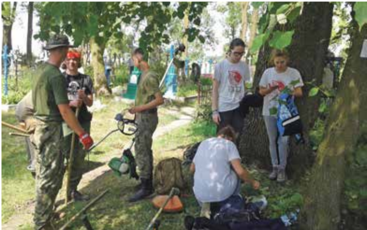
Fot. Uczniowie z Zespołu Szkół w Krynicznie porządkowali groby przodków na Ukrainie.

tej samej miejscowości. Niemal w niezmiennym składzie wróciliśmy do Łopatynia. Jakże wielkie było nasze zdziwienie, gdy w miejscach dziurawych ulic zastaliśmy piękne, wyasfaltowane drogi, ozdobione kwiatami chodniki, na niektórych domach pojawiły się nowe tabliczki z nazwami ulic. Było to dla nas wielkie, pozytywne zaskoczenie. Również w miejscowym kościele postępują prace remontowe, na cmentarzu odnawiany jest pomnik poświęcony poległym żołnierzom polskim w sierpniu