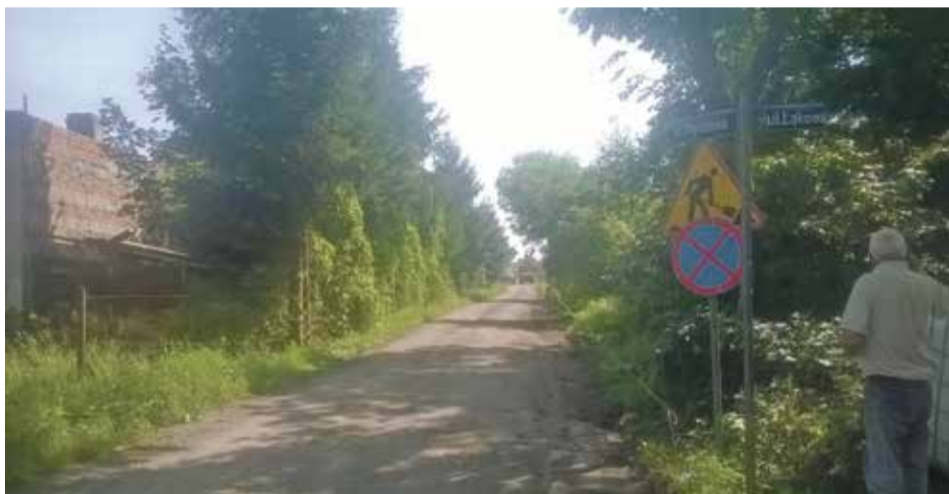
Fot. Ulica Ogrodowa w Krynicznie przed przebudową

Każdego roku sukcesywnie przybywa nowych dróg w gminie Wisznia Mała. Poprawiają one komfort mieszkańców, a co ważniejsze bezpieczeństwo zarówno pieszych, jak i zmotoryzowanych.