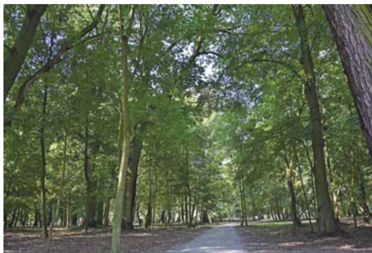
Fot. Gmina Wisznia Mała pozyskała dotację na zagospodarowanie terenu parku przypałacowego w Wiszni Małej

Całkowity koszt realizacji projektu (część gminy Wisznia Mała): 1.926.722,46 zł Dofinansowanie ze środków unijnych (dla Gminy Wisznia Mała): 1.637.714,09 zł Wkład własny gminy Wisznia Mała: 289.008,37 zł.