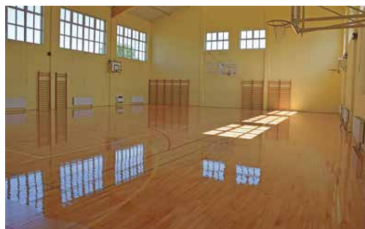
Fot. W Zespole Szkół w Krynicznie sala gimn. przeszła metamorfozę

montowanej części szkoły zostało przystosowane również pomieszczenie dla pielęgniarki szkolnej.