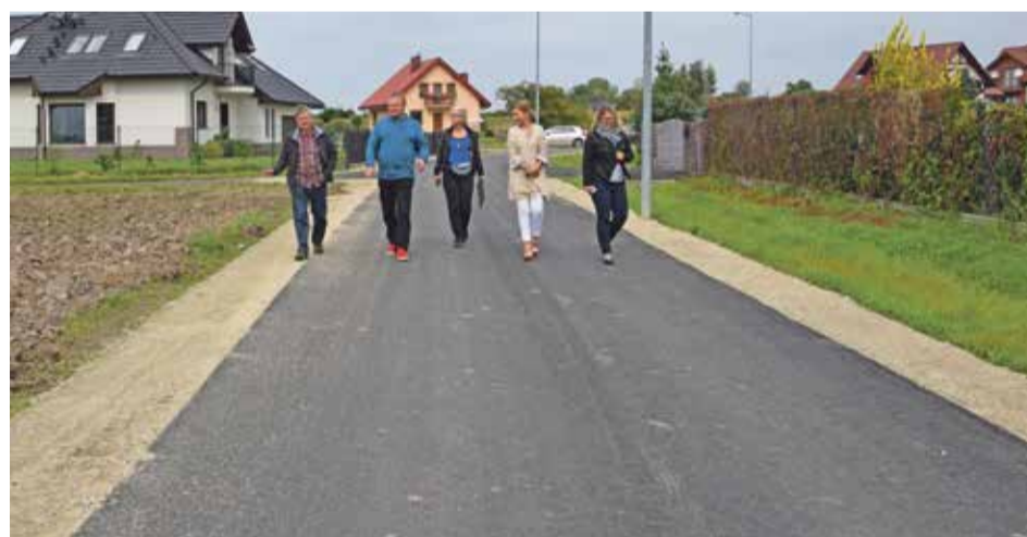
Fot. Ulica Wierzbowa w Rogożu po przebudowie