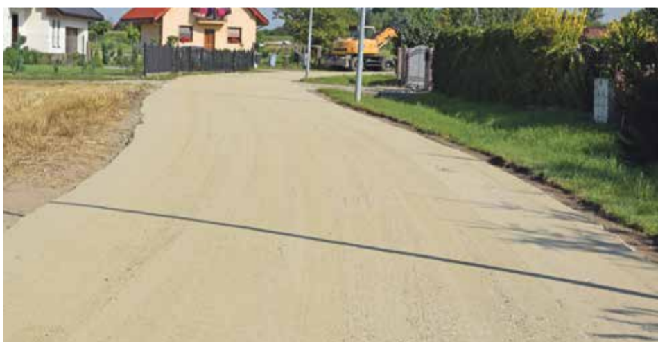
Fot. Ulica Wierzbowa w Rogożu w trakcie przebudowy