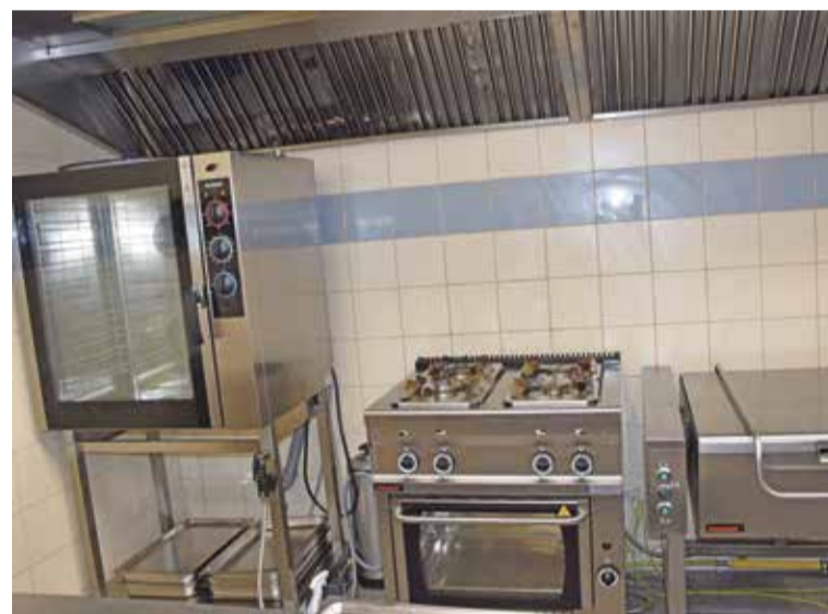
Fot. Zaplecze kuchenne w Szymanowie zostało wyposażone w nowoczesne urządzenia