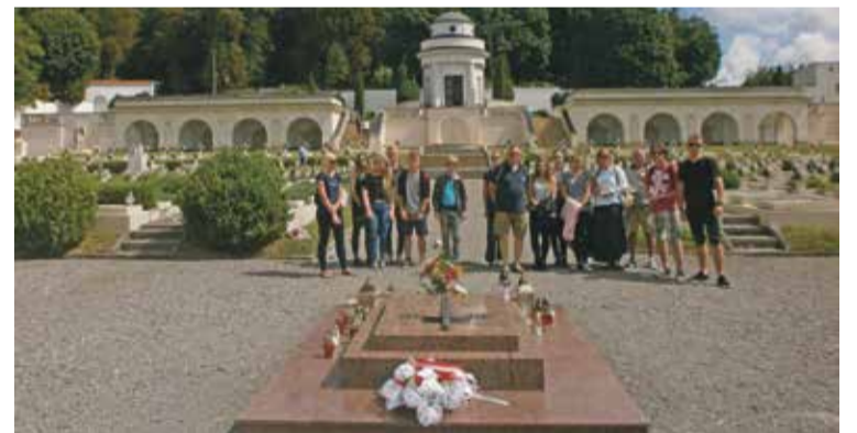
Fot. Podczas pobytu grupa z Kryniczna zorganizowała wycieczkę śladami przodków m.in. do Lwowa.

Przez pierwsze dni zajęliśmy się grobami, które porządkowaliśmy w roku ubiegłym – pomimo że w ubiegłym roku zostawiliśmy je wyczyszczone, na mogiłach znowu wyrosły krzewy i chwasty; praca była jednak już o wiele łatwiejsza. Kolejne dni poświęciliśmy na przywracanie pamięci nowym grobom, które odnaleźliśmy wśród zarośli.