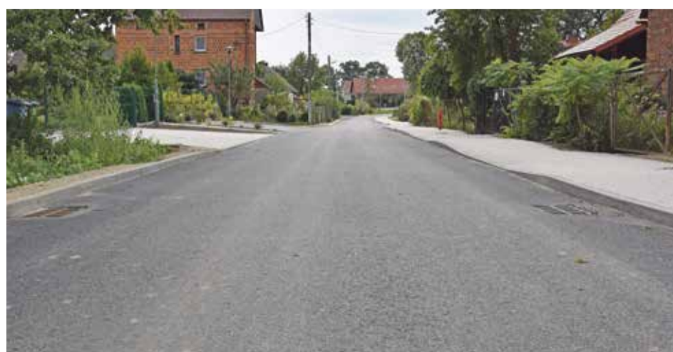
Fot. Ulica Mienicka w Strzeszowie po przebudowie