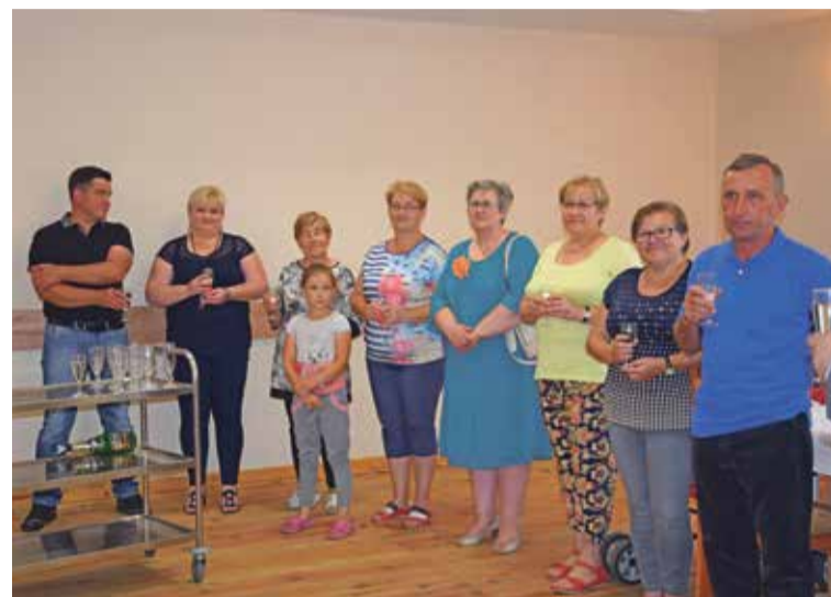
Fot. Otwarcie świetlicy w Szymanowie

Zachęcamy mieszkańców obu miejscowości do korzystania na co dzień z odnowionych i przystosowanych do ich potrzeb świetlic.