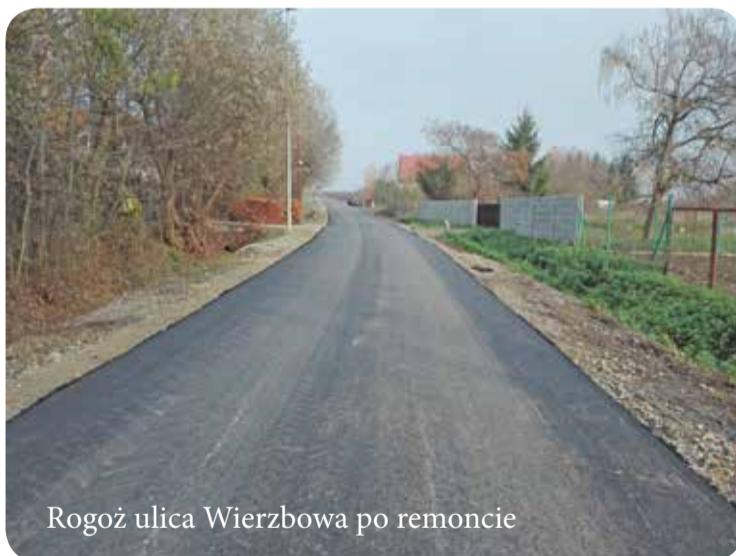
Rogoż ulica Wierzbowa po remoncie