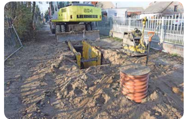
Fot. Psary, ul. Wolności

Wrocław (Widawa) pod wałami oraz budowa sieci kanalizacji w rejonie ulic Psar i Szymanowa.