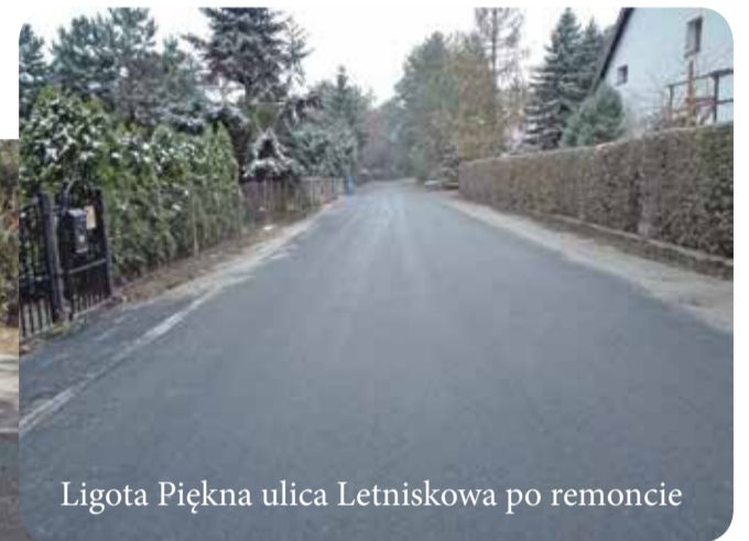
Ligota Piękna ulica Letniskowa po remoncie