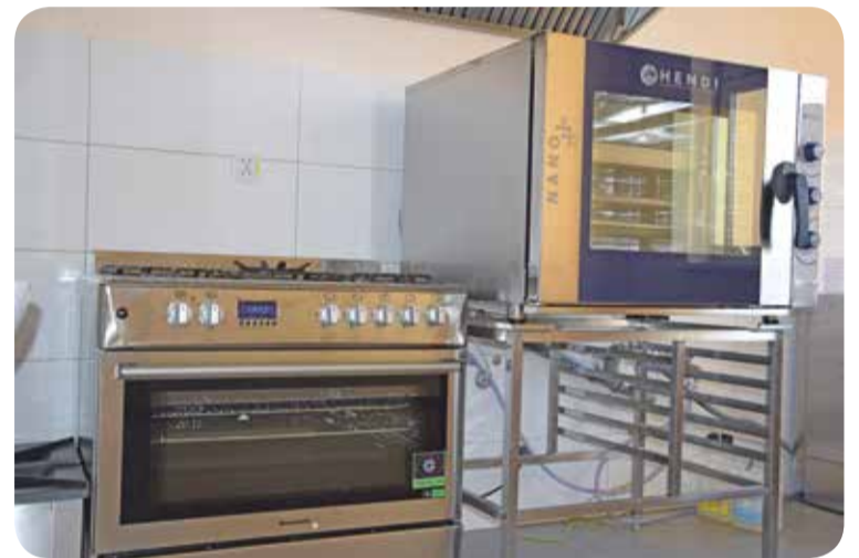
Fot. Sprzęt gastronomiczny w świetlicy w Malinie