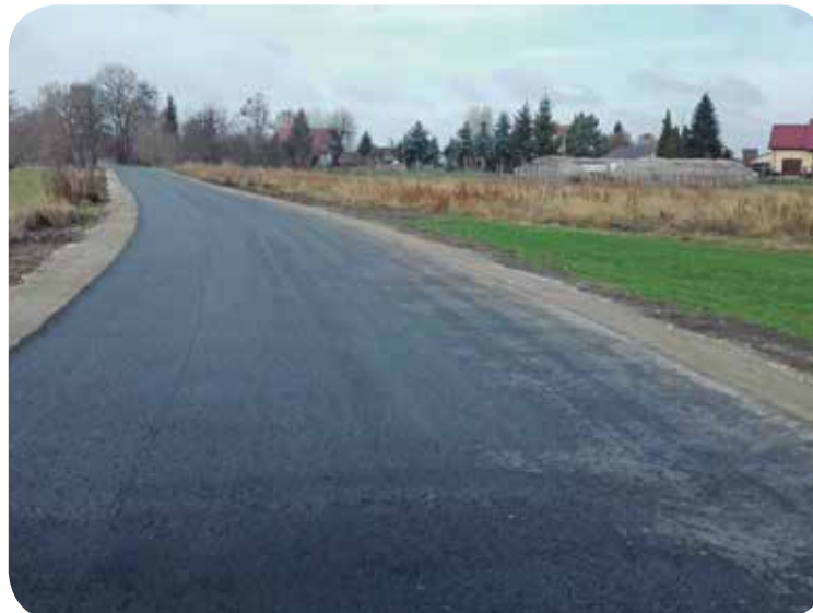
Fot. Droga nr 104933D

obejmującym m.in. skrzyżowanie z drogą gminną nr 104933D, które w połączeniu z bieżącym projektem tworzy spójną sieć komunikacyjną umożliwiającą komunikację przez gminę Wisznia Mała do byłej drogi krajowej nr 5. Ponadto właśnie zakończono przebudowę pierwszego odcinka tej drogi od skrzyżowania z drogą powiatową nr 1368D relacji Kryniczno - Malin - Ligota Piękna (informacja o tym projekcie poniżej).