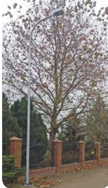
Fot. Krzyżanowice, ulica Jaśminowa

K ażdego roku w gminie przybywa kilkadziesiąt nowych lamp. W 2018 r. podpisano umowy na kwotę przekraczającą 700 tys. zł na wykonanie oświetlenia drogowego na terenie gm. Wisznia Mała.