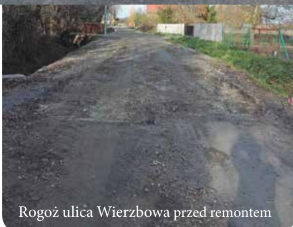
Rogoż ulica Wierzbowa przed remontem