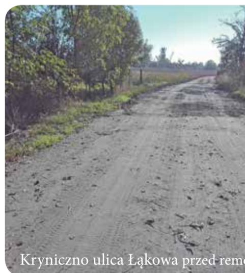
Kryniczno ulica Łąkowa przed remontem