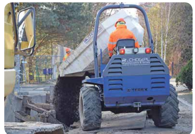
Fot. Psary, ul. Wolności