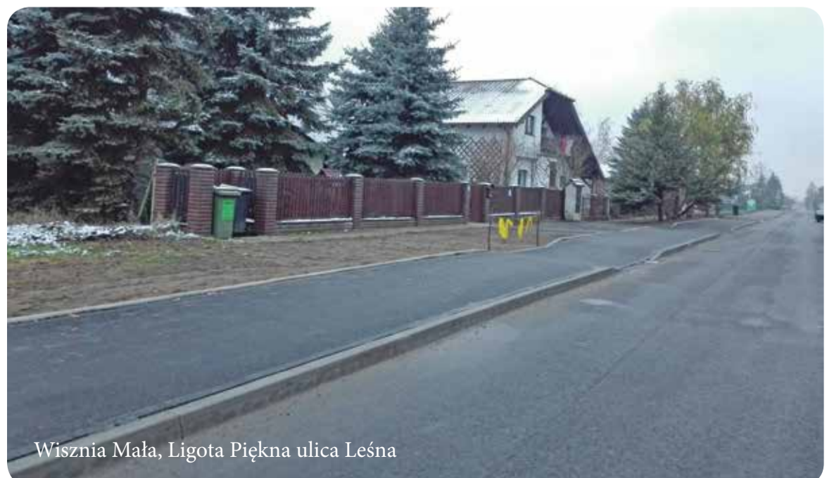
Wisznia Mała, Ligota Piękna ulica Leśna