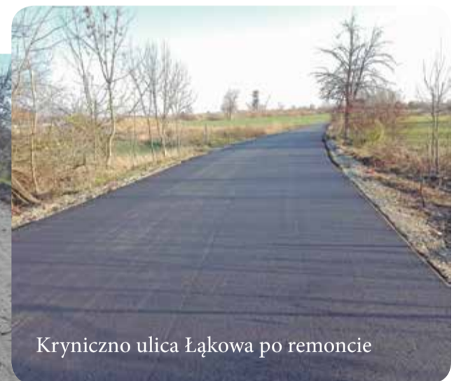
Kryniczno ulica Łąkowa po remoncie