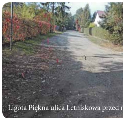
Ligota Piękna ulica Letniskowa przed remontem

Pod koniec listopada została podpisana umowa na wykonanie przebudowy ulicy Brzozowej poprzez wykonanie kanalizacji deszczowej w Ligocie Pięknej na al. Brzozowej oraz w Malinie na ul. Bocianie.