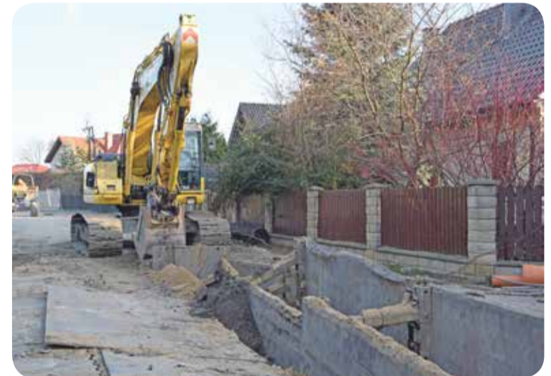
Fot. Szymanów, ul. Widawska