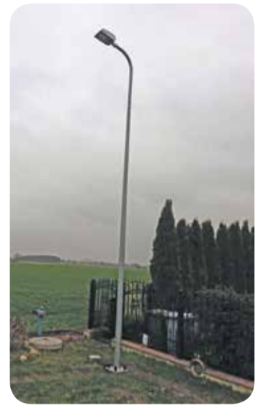
Fot. Szymanów, ul. Sportowa

W styczniu zamontowane zostaną kolejne lampy (13 szt.), pod które przysto-