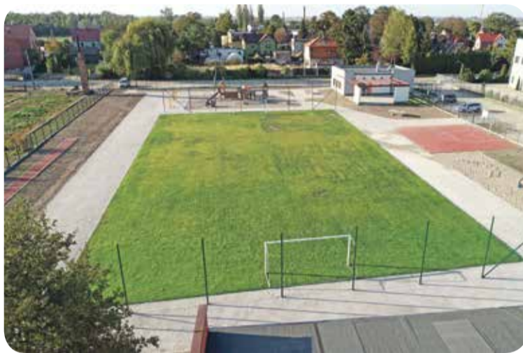
Fot. Teren sportowo - rekreacyjny w Psarach

Wydatki ogółem na zadanie: 260.591,48 zł Dofinansowanie: 110.000,00 zł Źródło finansowania: 110.000,00 zł budżet Województwa Dolnośląskiego + budżet Gminy Wisznia Mała.