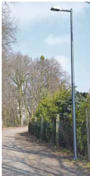
Fot. Oświetlenie na ulicy Głównej w Ligocie Pięknej

Od lat sukcesywnie doświetlamy wszystkie miejscowości. W 2016 r. na terenie gminy Wisznia Mała zamontowaliśmy 89 lamp , ułożyliśmy 4416 mb kabla za kwotę 574 tys. zł .