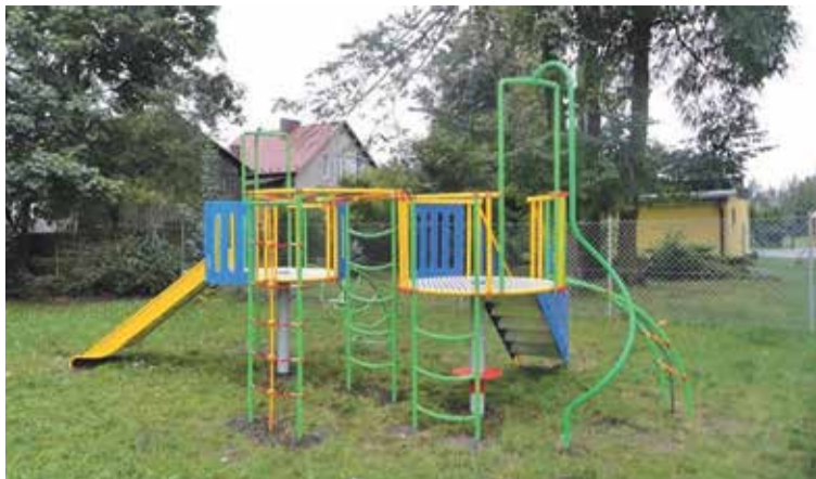
Fot. Zestaw zabawowy w Rogoźu

ul. Wiśniowej i ul. Polnej. Łącznie wybudujemy ok 3,2 km sieci kanalizacji sanitarnej. Projekt został zgłoszony do dofinansowania z Programu Rozwoju Obszarów Wiejskich 2014-2020 w ramach Działania „Podstawowe usługi i odnowa wsi na obszarach wiejskich”. Obecnie wniosek jest w trakcie oceny formalnej.