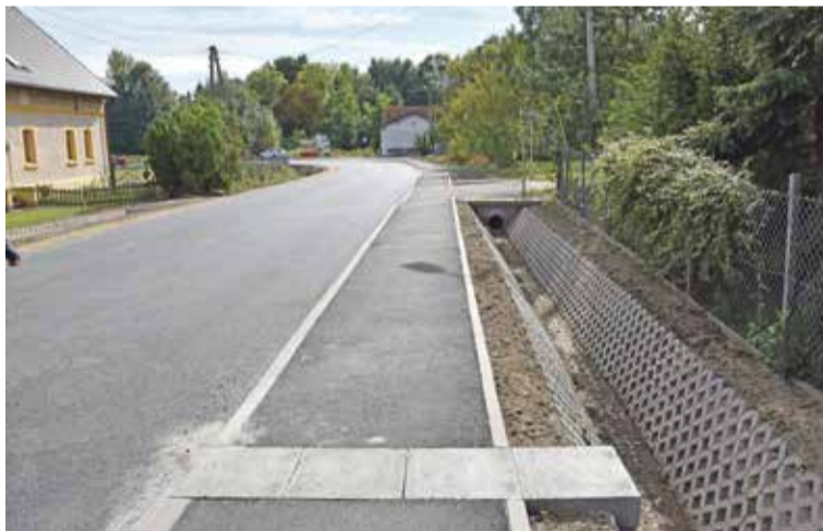
Fot. Gmina Wisznia Mała dofinansowała budowę drogi powiatowej w Pierwoszowie

W 2016 roku wykonaliśmy 4,6 km nowych nawierzchni asfaltowych za kwotę 2,1 mln zł . Liczba ta obejmuje przebudowę dróg, które otrzymały nową nawierzchnię oraz zjazdy do posesji. Nową nawierzchnią asfaltową mogą pochwalić się: ul. Wiosenna w Krynicznie, ul. Fiołkowa w Ligocie Pięknej, ul. Słoneczna w Malinie, część ul. Długiej w Szewcach, ul. Wiśniowa w Piotrkowiczkach i ul. Sportowa w Ozorowicach, część ul. Wolności w Psarach. Nowe oblicze otrzymały także drogi powiatowe przebiegające przez naszą gminę. Gmina włączyła się finansowo w budowę drogi w Pierwoszowie