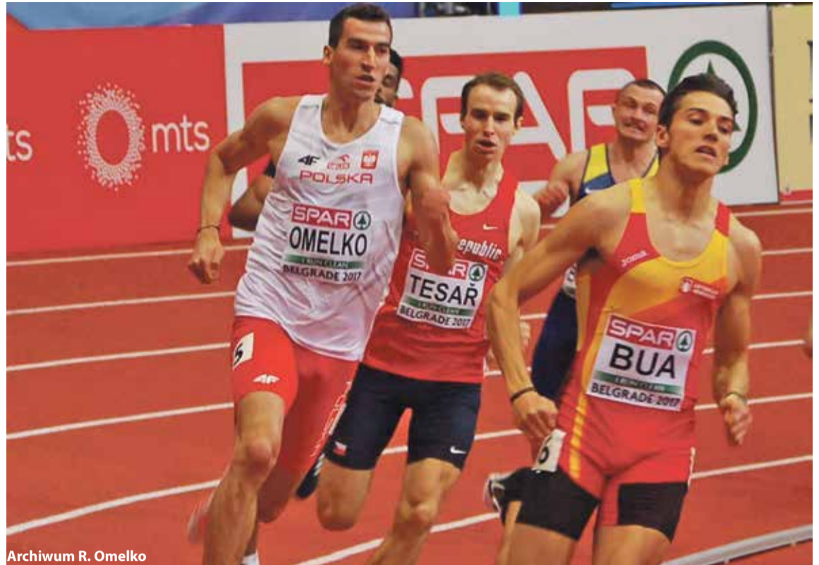
Archiwum R. Omelko

bardziej wynikająca z własnych oczekiwań niż innych. Jest stres, ale działa on mobilizująco. Najgorsze jest oczekiwanie. Zaśnięcie dzień wcześniej, a w dniu startu jedzenie na siłę, mimo że żołądek odmawia posłuszeństwa. Stres ustępuje jednak systematycznie kiedy idę na rozgrzewkę, a kiedy stoję przed blokami ogarnia mnie spokój. Koncentruję się na zadaniu, które mam do wykonania. Podczas samego biegu nie ma już zbyt wielu myśli, daje o sobie znać automatyzm wypracowany na treningach. Ze sztafetą jest trochę inaczej. Na rozgrzewce i przed startem towarzyszą mi koledzy. Z jednej strony dodaje to otuchy, z drugiej jednak pojawia się dodatkowa odpowiedzialność. Wiem, że każdy mój błąd będzie kosztował nas wszystkich. Jesteśmy jednak drużyną więc wspieramy się i