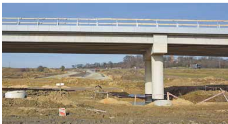
Fot. Budowa drogi ekspresowej S5

Obecnie oczekujemy na rozstrzygnięcie 7 projektów na łączną kwotę wartości zadań ok. 18 mln zł . I na tym nie zamierzamy poprzestać. Mamy mnóstwo pomysłów i potrzeb, które postaramy się zrealizować.