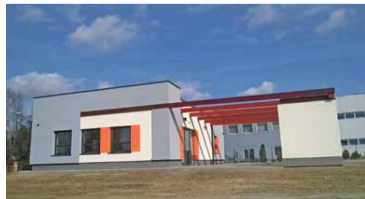
Fot. Budynek spotkaniowy w Psarach