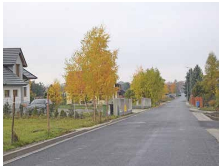
Fot. Ulica Długa w Szewcach

W Strzeszowie przebudowaliśmy sieć wodociągową i wybudowaliśmy kanalizację deszczową wzdłuż ulicy Młynarskiej i Mienickiej. Rozbudowana również została sieć wzdłuż ul. Topolowej w Szewcach i ul. Jodłowej oraz ul. Łąkowej w Ozorowicach.