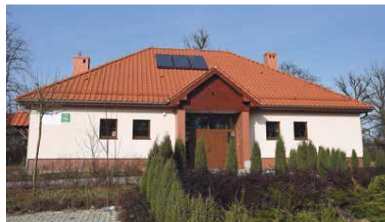
Fot. Świetlica w Mienicach

obejmujący szkoły podstawowe w Krynicznie, Psarach i Szewcach oraz gimnazjum w Szewcach pn. „Edukacja XXI wieku w gminie Wisznia Mała”. Niestety ze względu na osiągnięcie przez szkołę podstawową w Wiszni Małej wyższego poziomu nauczania od średniej województwa, nie mogła ona zostać objęta tym projektem. Realizujemy także projekt Akcja Integracja! To kolejny program współfinansowany przez UE. Jest to projekt partnerski realizowany w latach 2017-2018 wspólnie