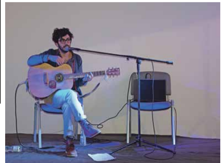
Fot. Występ portugalskiego wokalisty Joao De Sousa uświetnił wystawę.