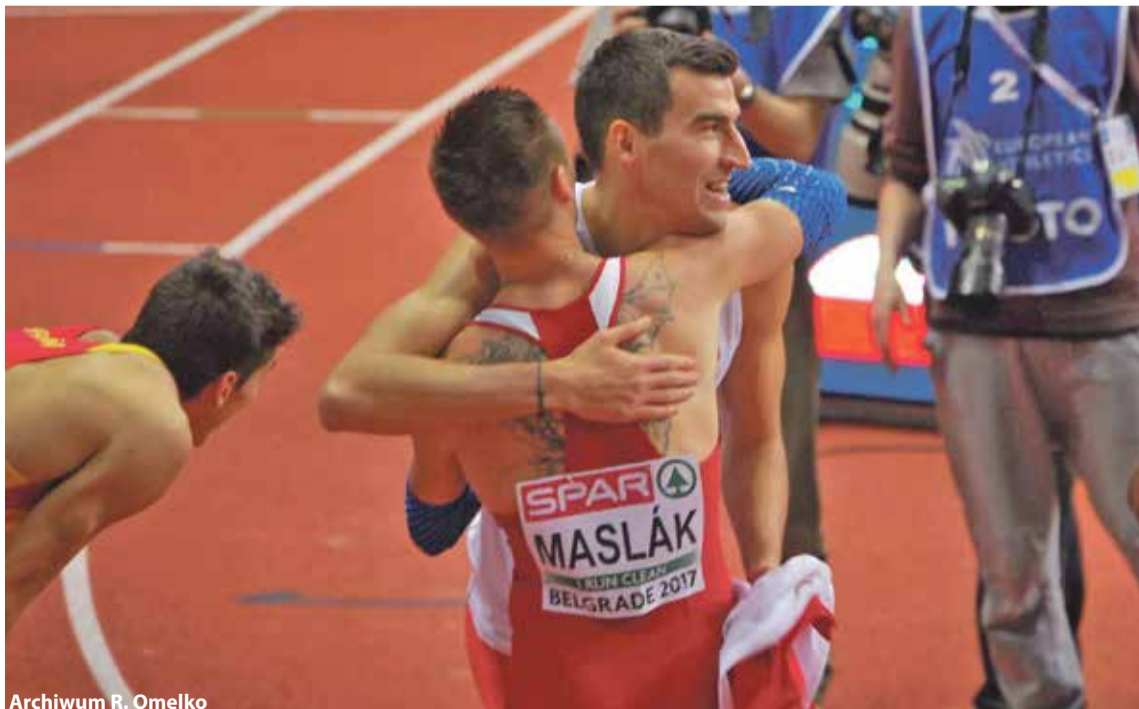
Archiwum R. Omelko