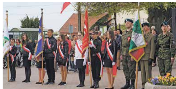
Fot. Pocztę sztandarową