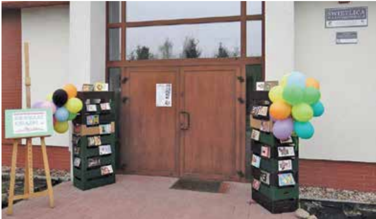
Fot. Kolejną inicjatywą, po wprowadzeniu czytników elektronicznych było uruchomienie od kwietnia Punktu Bibliotecznego w Krzyżanowicach.

Wiszeńska biblioteka to prężnie działająca jednostka, stale wdrażająca nowe udogodnienia dla swoich odbiorców. Kolejną inicjatywą, po wprowadzeniu czytników elektronicznych było uruchomienie od kwietnia Punktu Bibliotecznego w Krzyżanowicach. Jest to drugi taki