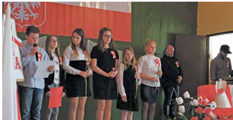
Fot. Przedstawienie pt. „Bóg, Honor, Ojczyzna” w wykonaniu uczniów z Zespołu Szkolno-Przedszkolnego w Szewcach