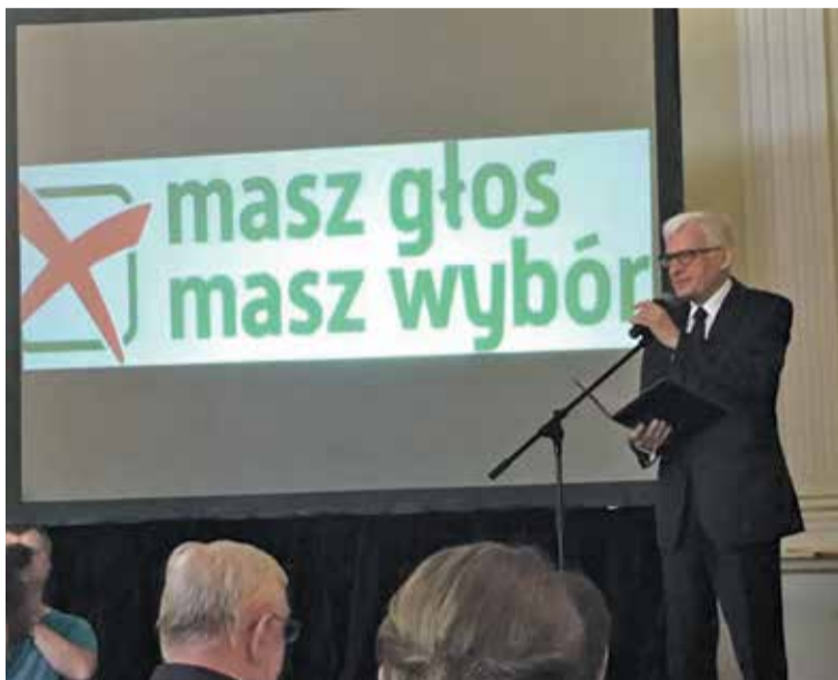
Fot. 30 maja na Zamku Królewskim w Warszawie odbyła się uroczysta gala akcji „Masz Głos, Masz Wybór”.