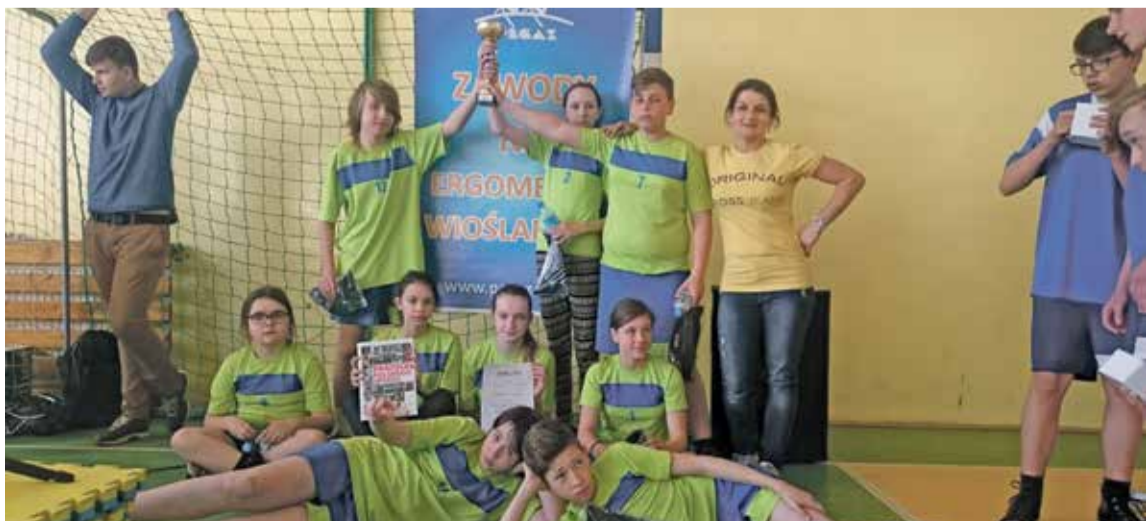
Fot. Zwycięska drużyna ze Szkoły Podstawowej w Krynicznie