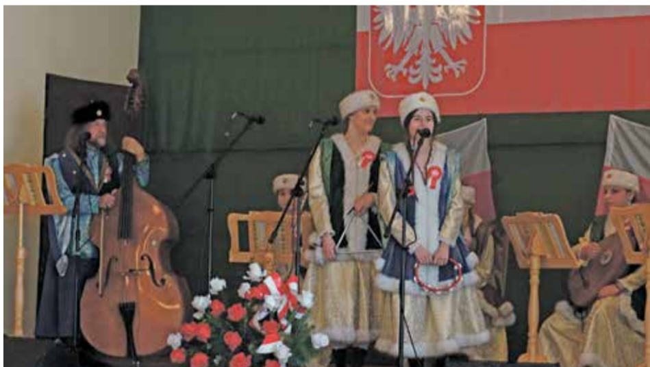
Fot. Jako ostatni wystąpił Zespół Muzyki Polskiej MOKOSZA z Kątów Wrocławskich