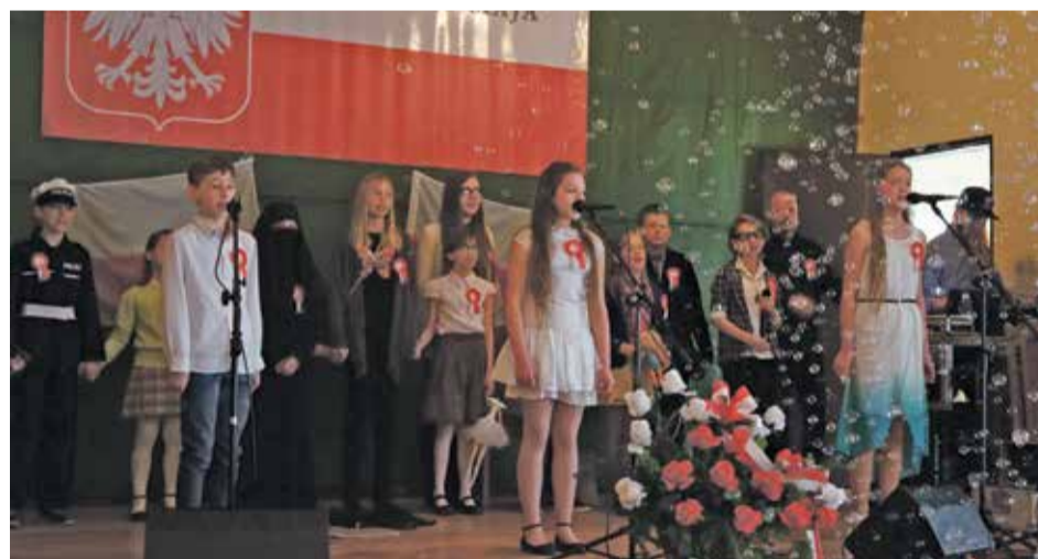
Fot. Występ uczniów ze Szkoły Podstawowej w Wiszni Małej z współczesnym i bardzo aktualnym przedstawieniem na temat Konstytucji