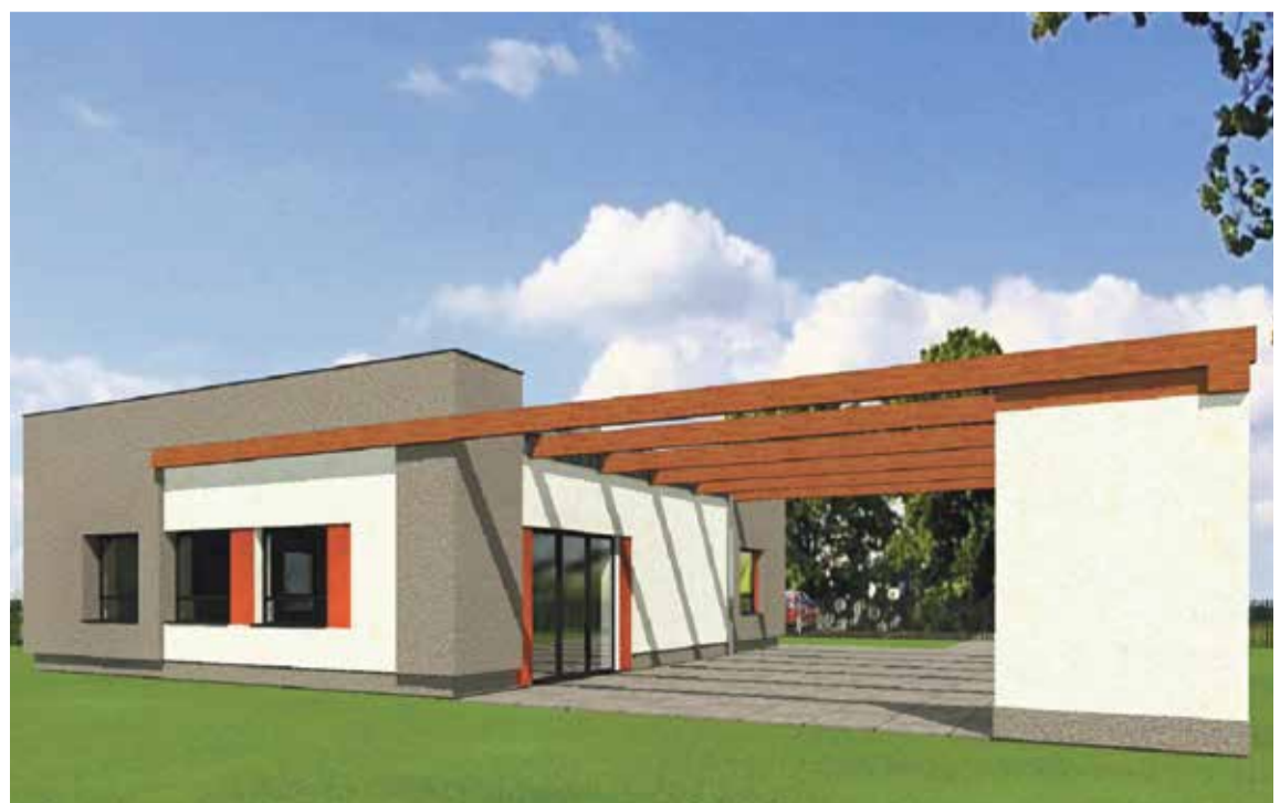
Fot. Wizualizacja budynku gospodarczo – spotkaniowego w Psarach

Obecnie gmina przystąpiła do opracowania dokumentacji projektowej na budowę boiska wielofunkcyjnego w miejscowości Piotrkowiczki oraz infrastruktury technicznej do boiska sportowego w miejscowości Malin. W ramach budowy boiska w Piotrkowiczkach planuje m.in. wykonanie: boiska trawiastego do gry w piłkę nożną, boiska z nawierzchni sztucznej do gry w koszykówkę i siatkówkę wraz z zapleczem socjalnym, miejsca do spotkań przy ognisku.