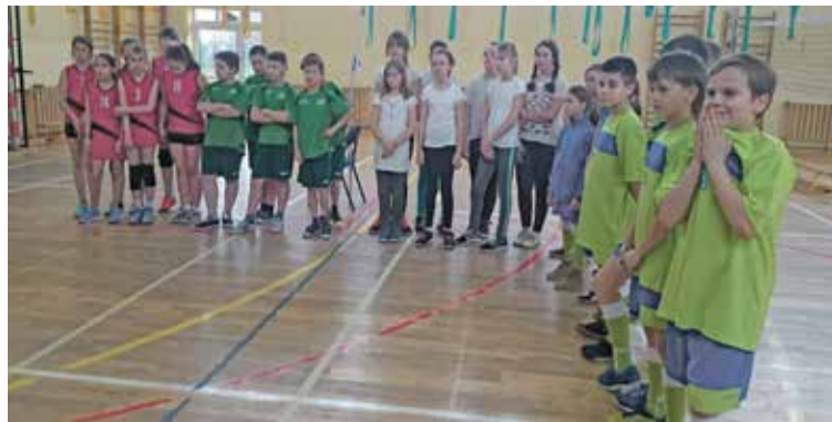
Fot. Uczestnicy Zawodów Gminnych w Mini Piłce Siatkowej kl. IV

Kategoria dziewcząt: I miejsce - SP 3 Oborniki Śl. II miejsce – SP2 Oborniki Śl. III miejsce – SP Żmigród IV miejsce - SP 3 Trzebnica V miejsce - SP Kryniczno VI miejsce - SP Zawonia MK, AG-S