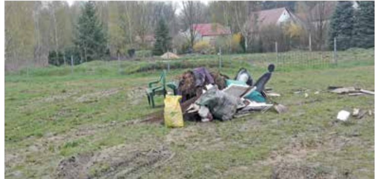
Fot. W Ligocie Pięknej, na skrzyżowaniu ulic Na Kolonii i Leśnej zostały wyrzucone odpady zielone, które powinny trafić do PSZOK-u w Miennicach

Do kontenera na odpady wielkogabarytowe: