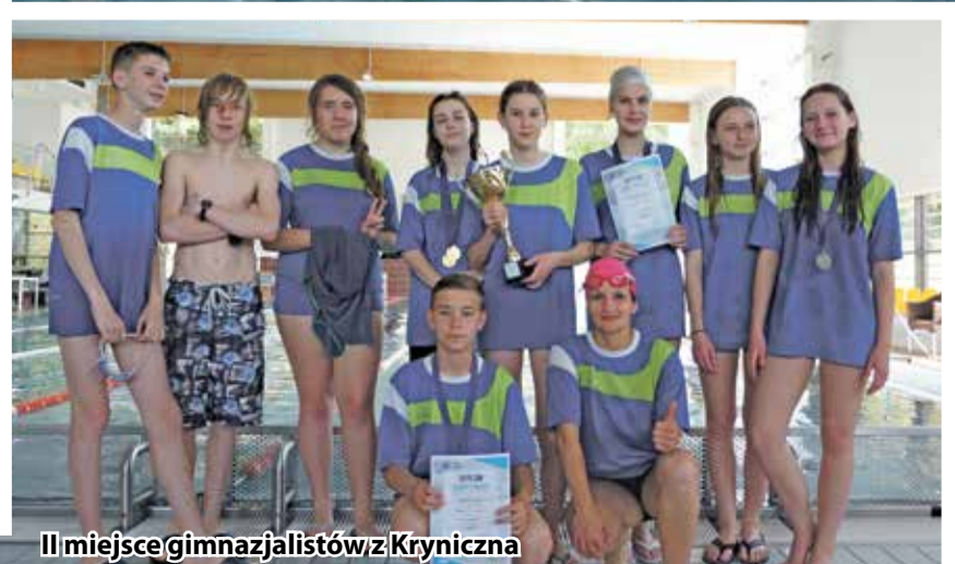
II miejsce gimnazjalistów z Kryniczna