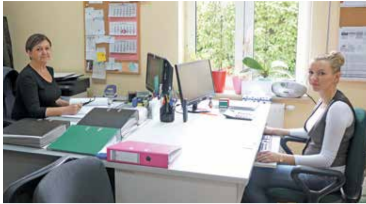
Fot. Wszystkie osoby składające wnioski były przyjmowane systematycznie, płynnie, bez jakichkolwiek zakłóceń.

Już od 1 kwietnia jest realizowany Program Rodzina 500+. Gmina Wisznia Mała od samego początku była dobrze przygotowana do tego wyzwania, odpowiednio wcześniej zostały podjęte kroki by wszystko przebiegało szybko i sprawnie. Personel został właściwie przeszkolony, a pomieszczenia i sprzęt komputerowy przygotowany. Ponadto była prowadzona szeroka akcja informacyjna wśród mieszkańców. Dodatkowo wydłużono czas pracy pracowników, a gmina Wisznia Mała jako jedyna gmina w całym powiecie trzebnickim umożliwiła mieszkańcom składanie wniosków codziennie do 18.00 oraz we wszystkie soboty w kwietniu. Było to znacznym udogodnieniem dla osób pracujących, które miały możliwość złożenia wniosków.