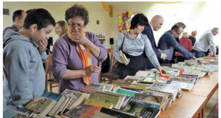
Fot. Uroczyste otwarcie Punktu Bibliotecznego