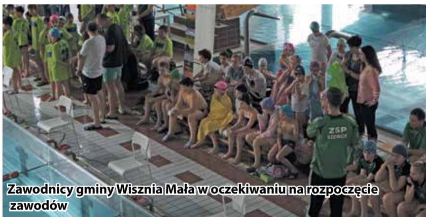
Zawodnicy gminy Wisznia Mała w oczekiwaniu na rozpoczęcie zawodów