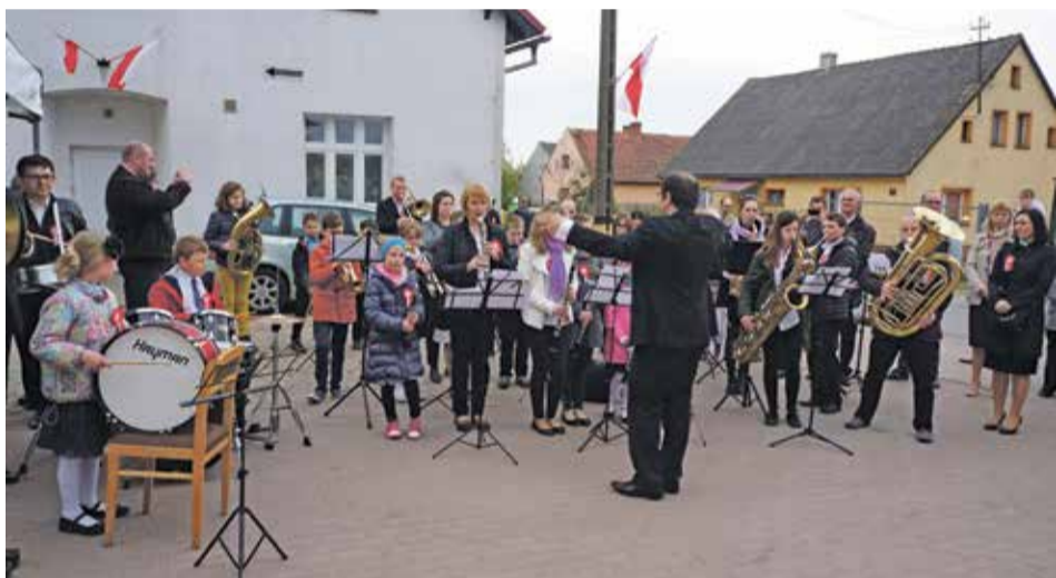
Fot. Imponujący występ Gminnej Orkiestry Dętej