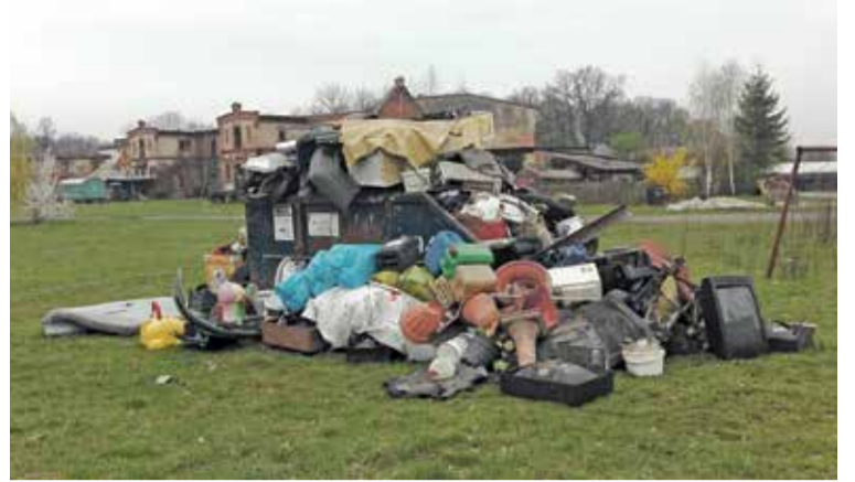
Fot. Do kontenera na ulicy Wspólnej w Malinie zostały wyrzucone odpady plastikowe, które powinny trafić do żółtego worka na plastik/metal, a sprzęt elektro do specjalnego punktu