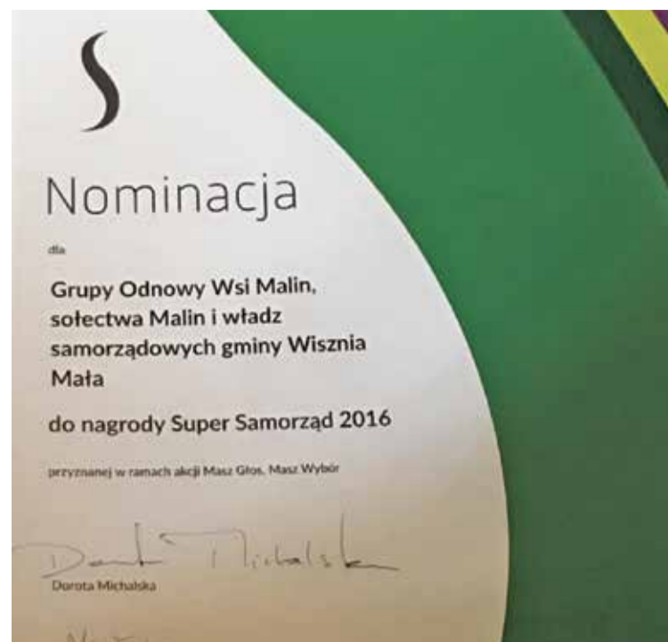
Fot. Z naszej gminy została nominowana grupa Odnowy Wsi Malin, sołectwo Malin oraz władze samorządowe z projektem realizacji rewitalizacji parku.

W 2015 r. szesnaście sołectw gminy Wisznia Mała w ramach środków funduszu sołectkiego zrealizowało zadania na łączną kwotę w wysokości ok. 890 tys. zł. Z tej sumy 296 tys. zł pochodziło z funduszu sołectkiego, natomiast reszta, czyli 594 tys. zł to dodatkowe nakłady gminy. Z tych środków, oprócz wydatków na poprawę jakości życia mieszkańców tj. oświetlenie drogowe, odwodnienie dróg, poprawa ich nawierzchni itp., realizowane są także szczególnie interesujące pomysły mieszkańców, które dodatkowo służą integracji społeczeństwa lokalnego. Z środków przeznaczonych na fundusz sołectki wyposaża się