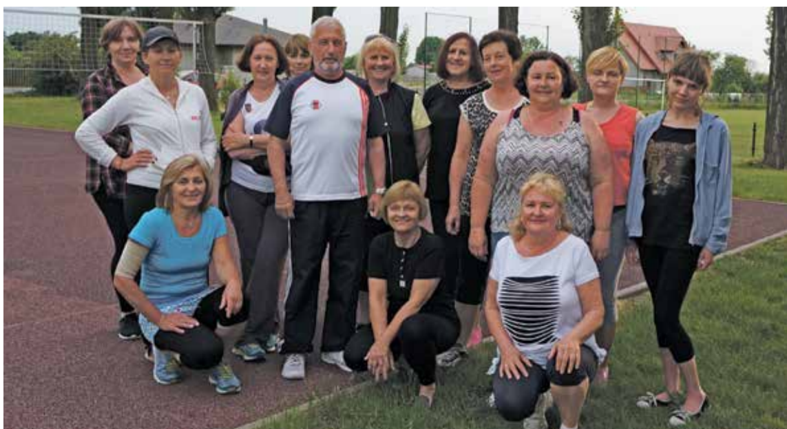
Fot. Uczestniczki zajęć ruchowo – sportowych.

Pasje: zamiłowanie do sportu, szczególnie pływania i ratownictwa wodnego; muzyka.