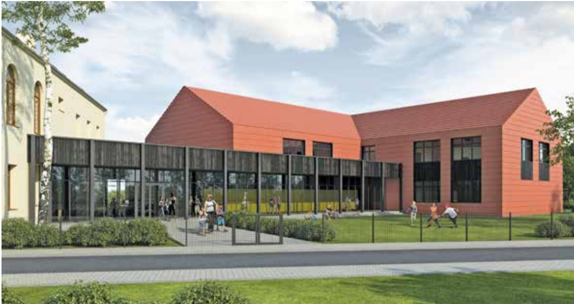
Fot. Wizualizacja rozbudowy szkoły w Psarach

Gmina Wisznia Mała od wielu lat realizując swoje inwestycje i działania korzysta z zewnętrznych środków finansowych. Na tym polu dysponuje sporym doświadczeniem. W tym roku na bieżąco składaliśmy wnioski na różne zadania. W ostatnim czasie aplikowaliśmy o wsparcie działań związanych z szeroko rozumianą edukacją, rozwojem dzieci i młodzieży, rozbudową Szkoły Podstawowej w Psarach, termomodernizacją obiektów użyteczności publicznej oraz budową obiektu sportowo-rekreacyjnego w Wiszni Małej. Ponadto w najbliższym czasie będziemy aplikować o środki na budowę kanalizacji w gminie. W okresie marzec – maj 2016 roku złożono aż 11 projektów!