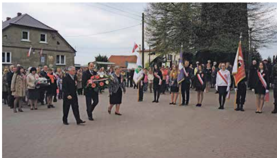
Fot. Składanie wieńców i kwiatów pod Pomnikiem Pamięci Narodowej