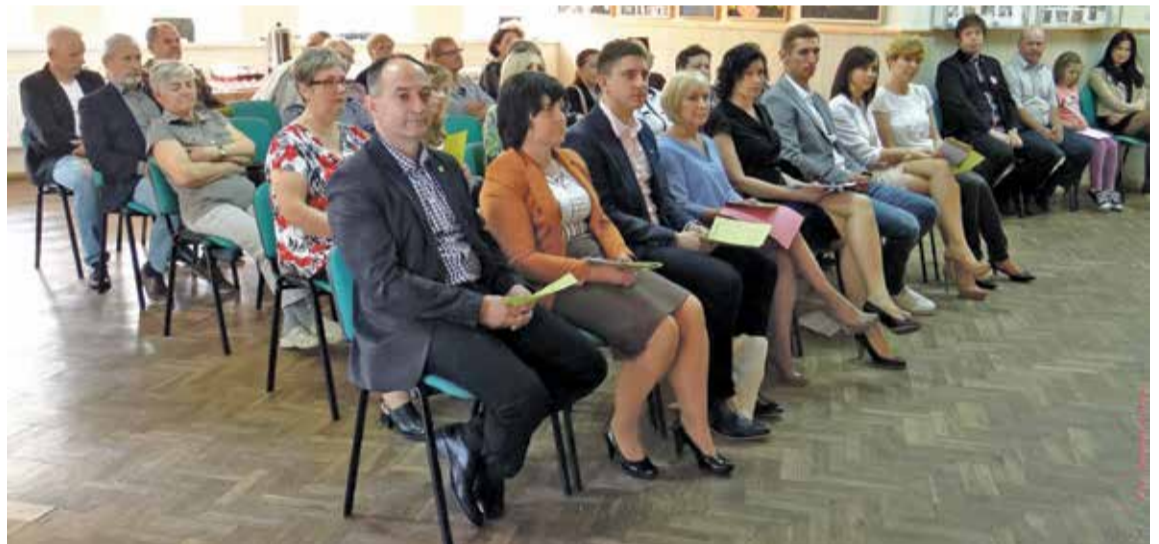
Fot. Z okazji Dnia Działacza Kultury i Bibliotekarza w budynku OKSiRu w Wiszni Małej spotkali się jego pracownicy i współpracownicy, bibliotekarki, lokalni liderzy zaangażowani w kulturę oraz artyści.