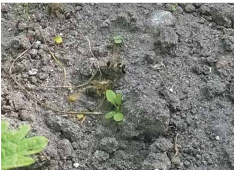
Fot. Po zatruciu pszczoły giną poza ulem lub w drodze do niego

Zapraszamy na stronę internetową www.piorin.gov.pl .