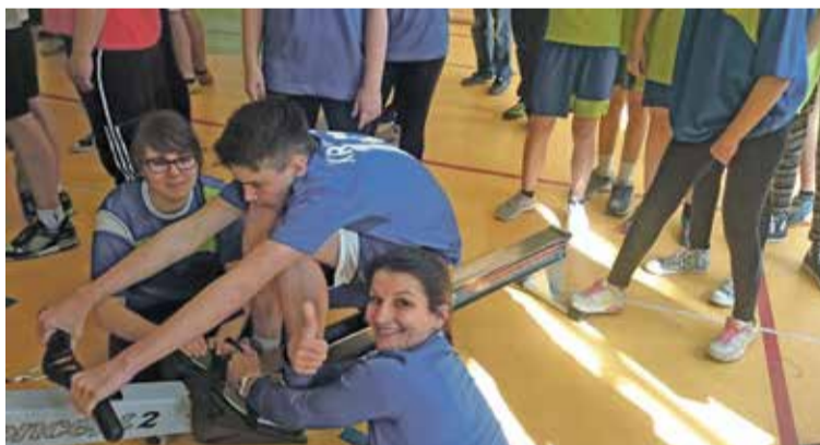
Fot. Zacięta rywalizacja na dystansie 15 km