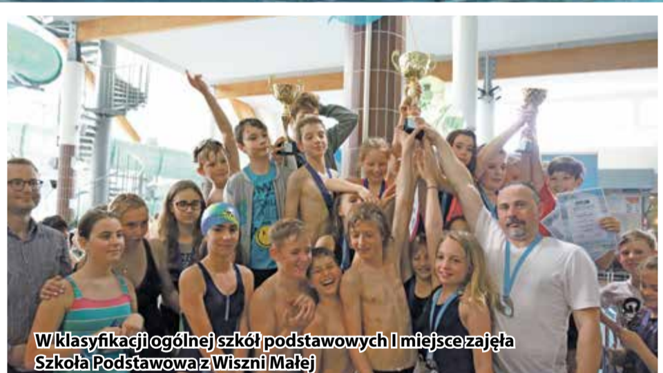
W klasyfikacji ogólnej szkół podstawowych I miejsce zajęła Szkoła Podstawowa z Wiszni Małej