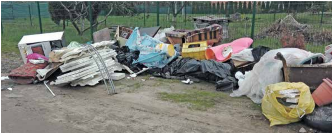
Fot. W Ligocie Pięknej na ulicy Prostej wyrzucone zostały odpady pobudowlane, które można oddać do naszego Punktu Selektywnej Zbiórki Odpadów w Miennicach

do PSZOK-u w Miennicach lub przy zakupie nowego sprzętu sklep powinien od nas przyjąć ten zużyty. Dlaczego to takie ważne żeby oddawać odpady tego typu tylko w miejscach do tego przeznaczonych? Ponieważ wyrzucając elektrośmieci do nieodpowiedniego pojemnika stwarzamy zagrożenie dla środowiska oraz łamiemy prawo. Segregacja elektrośmieci, odpowiednie przetworzenie i unieszkodliwienie substancji niebezpiecznych w nich zawartych chroni środowisko przed zanieczyszczeniem i skażeniem, a ponowne wykorzystanie odzyskanych surowców zmniejsza zużycie naszych zasobów naturalnych i obniża koszty produkcji.