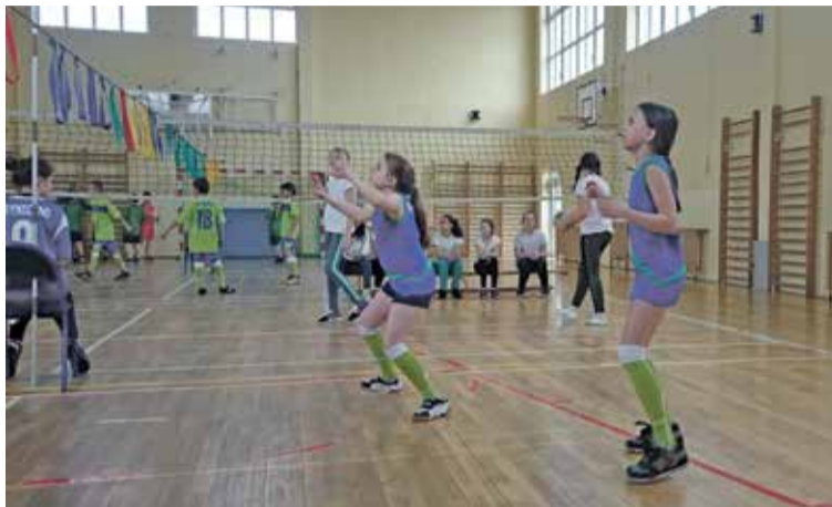
Fot. Walka o kolejne punkty