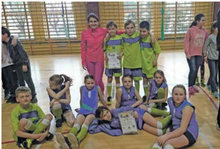
Fot. Obie drużyny ze Szkoły Podstawowej z Kryniczna na Zawodach Powiatowych