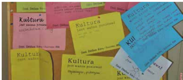
Fot. Każdy mógł zapisać na karcie dlaczego kultura jest ważna i sprawdzić jak postrzegają to inni.