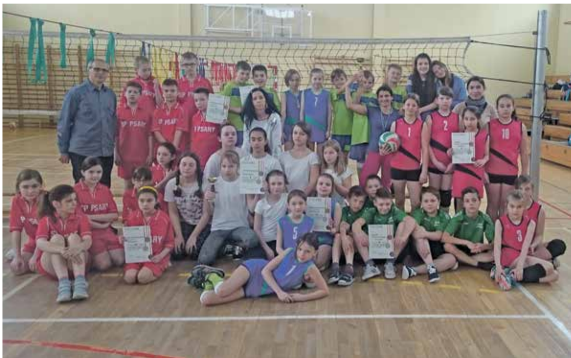
Fot. Po zakończonej rywalizacji