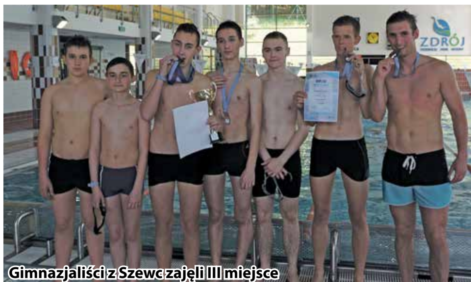
Gimnazjaliści z Szewc zajęli III miejsce