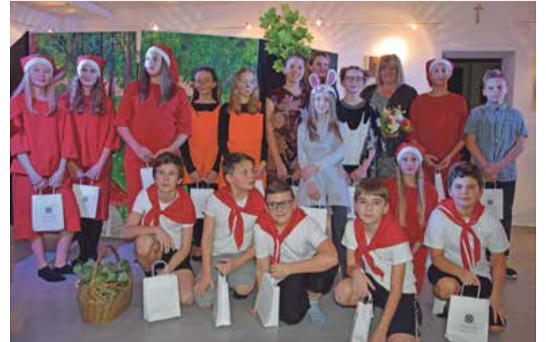
Fot. Grupa teatralna ze Szkoły Podstawowej w Krynicznie