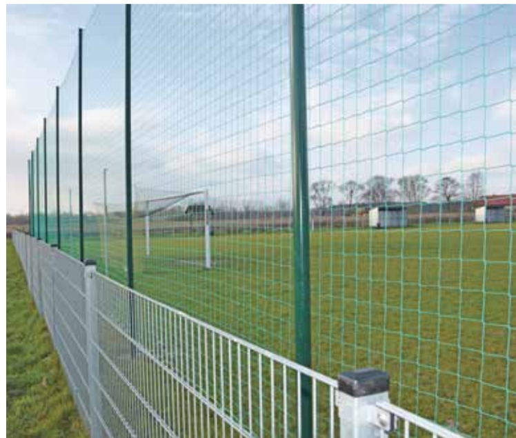
Fot. Piłkochwyty na boisku w Ozorowicach

Z kolei na sąsiadującym z terenem budynku spotkaniowego boisku zostały zamontowane piłkochwyty. Podobne piłkochwyty zostały także zamontowane na boisku sportowym w Ozorowicach.