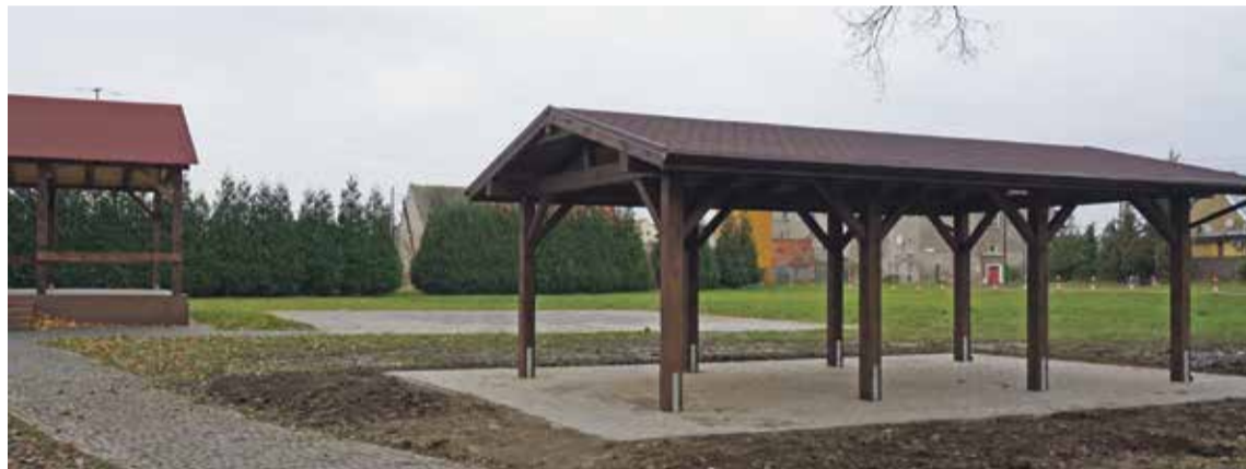
Fot. Wiata w Szymanowie

W Szymanowie obok świetlicy mieszkańcy już niedługo będą mogli korzystać z wiaty.