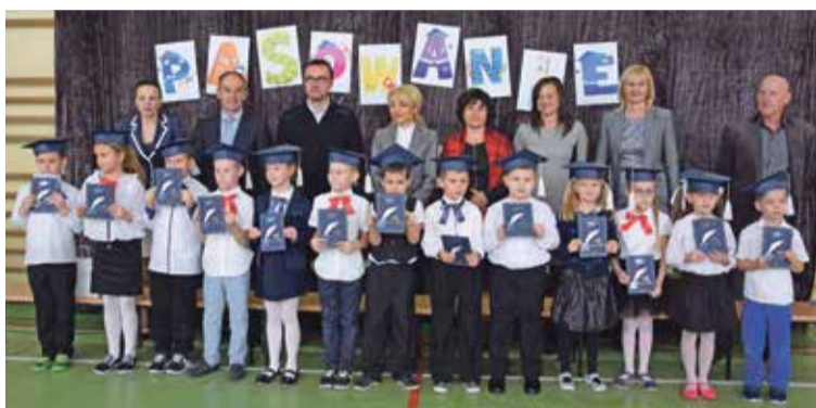
Fot. Pierwszoklasiści ze Szkoły Podstawowej w Szewcach