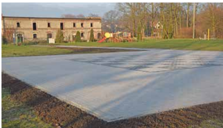
Fot. Szachownica plenerowa w Strzeszowie

Jednym z takich przedsięwzięć jest wybudowana w Strzeszowie szachownica plenerowa przy placu zabaw, która już niebawem będzie użytkowana przez mieszkańców.