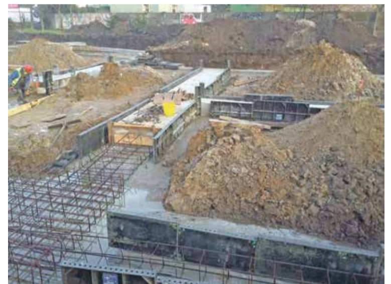
Fot. Wylano ławy pod nowy budynek szkoły.