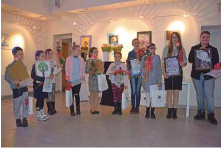
Fot. Laureaci projektu pn. „Zaprojektuj okładkę na nowo”

17:00 Galeria na Zakręcie wypełniła się dziećmi oraz dorosłymi. W tym dniu odbył się finał projektu realizowanego przez Gminną Bibliotekę Publiczną pn. „Zaprojektuj okładkę na nowo” oraz wernisaż