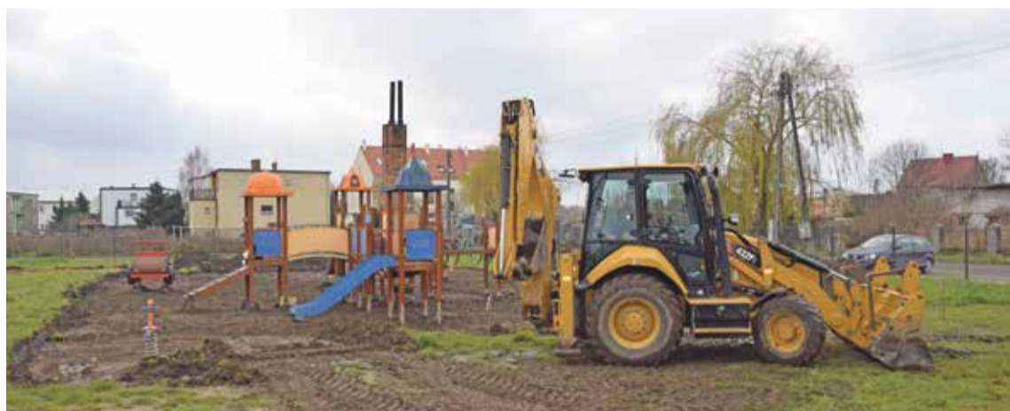
Fot. Trwa budowa nawierzchni na placu zabaw w Psarach

Natomiast w Psarach na terenie przy budynku spotkaniowo-gospodarczym, który niedawno został ogrodzony, wykonywana jest obecnie nowa nawierzchnia na placu zabaw. A już niedługo zostanie zamontowana ścieżka zdrowia, z której ucieszą się i dorośli, jak i młodszy użytkownicy.