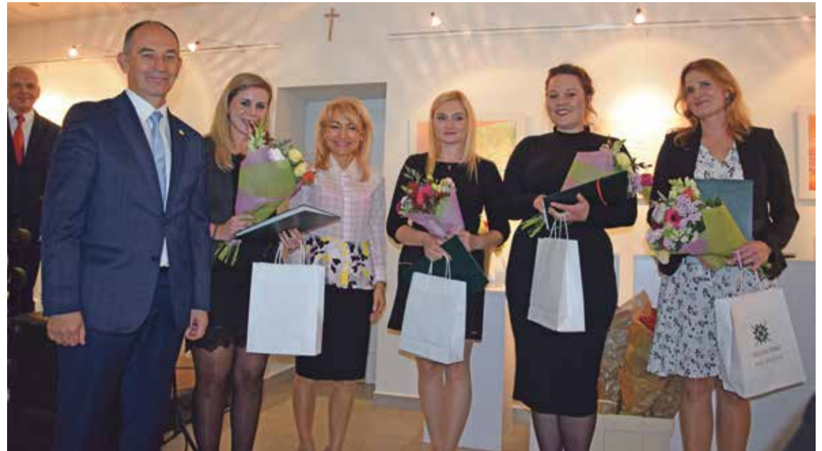
Fot. W trakcie uroczystości cztery nauczycielki odebrały nominacje na stopień nauczyciela mianowanego oraz złożyły ślubowanie.