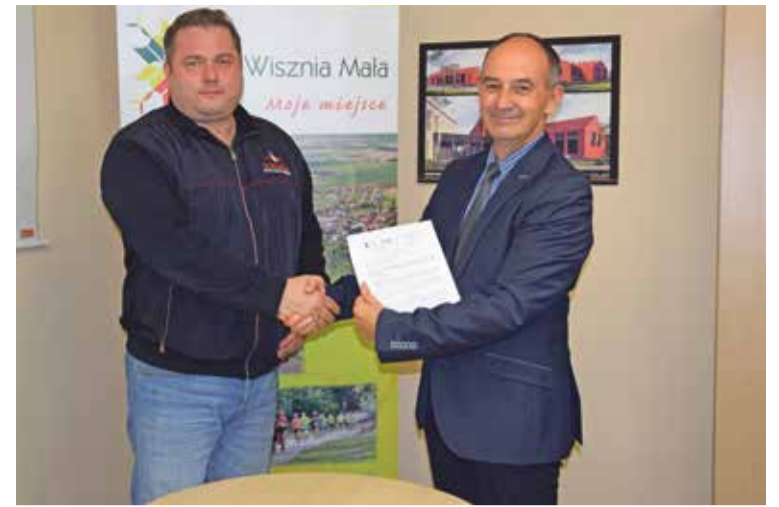
Fot. Podpisanie umowy na rozbudowę Szkoły Podstawowej w Psarach.

Projekt zwiększy dostępność do edukacji na poziomie podstawowym na terenie gminy Wisznia Mała i pozwoli na wyrównanie szans edukacyjnych dzieci z