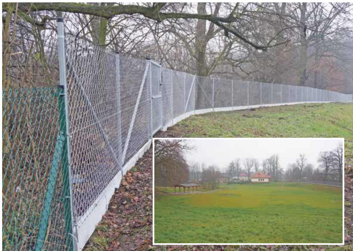
Fot. Ogrodzone boisko w Mienicach

Boisko w Mienicach, obok którego w ostatnich miesiącach została wybudowana wiata, zostało ogrodzone.