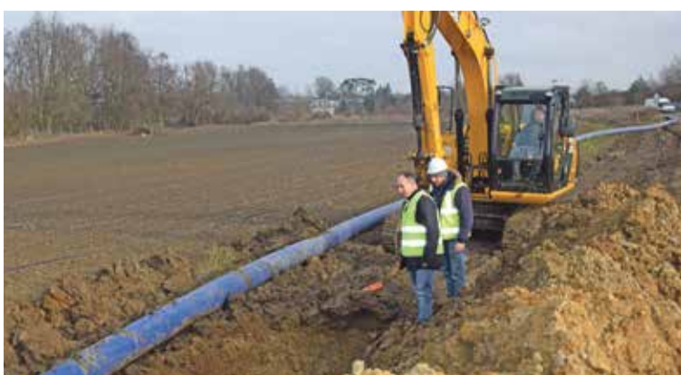
Fot. Trwa budowa magistrali wodociągowej