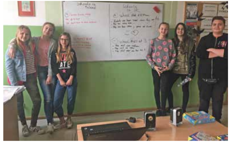
Fot. Zajęcia prowadzone w ramach projektu pt. „Wzrost jakości edukacji szkolnej w gminie Wisznia Mała”

Projekt obejmuje dodatkowe zajęcia szkolne oraz pozaszkolne dla uczniów i uczennic od pierwszej klasy szkoły podstawowej do ostatniej gimnazjum. W ramach zajęć szkolnych będą to dodatkowe godziny z przedmiotów przyrodniczych, zarówno dla dzieci zdolnych w celu poszerzenia ich umiejętności, jak również zajęcia wyrównawcze dla uczniów potrzebujących wsparcia. Zajęcia przyrodnicze będą organizowane w trybie doświadczalnym, gdź w ramach obecnie realizowanych projektów szkoły wyposażane są w pracownie przedmiotowe: matematyczne, przyrodnicze i cyfrowe. Nowy projekt pozwoli także uzyskać dodatkowe elementy wyposażenia jak np. mikroskopy, tablety, zestawy odczynników chemicznych, zestawy do ćwiczeń biologicznych, fizycznych i geograficznych, tablice multimedialne