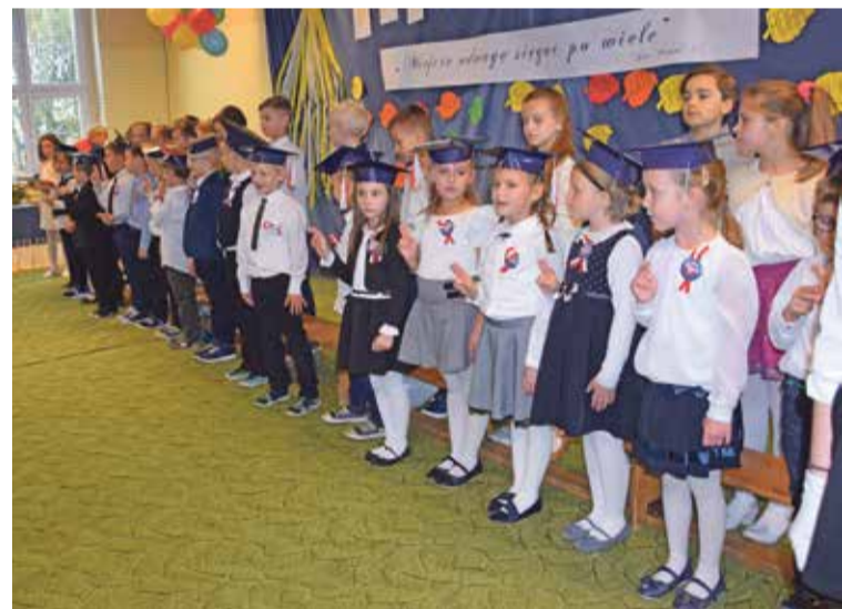
Fot. Pierwszoklasiści ze Szkoły Podstawowej w Psarach