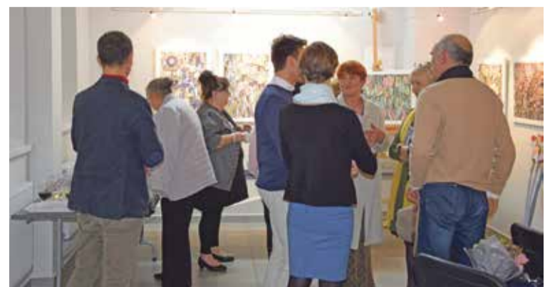
Fot. Po wysłuchaniu mini recitalu uczestnicy finisażu mogli zgłębiać tajniki pracy twórczej i dowiedzieć się wiele rzeczy o malarstwie.