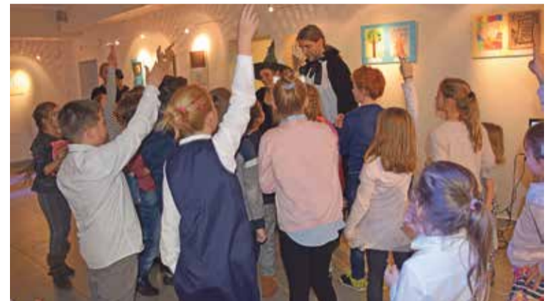
Fot. Zabawa Andrzejkowa z Czarodziejami