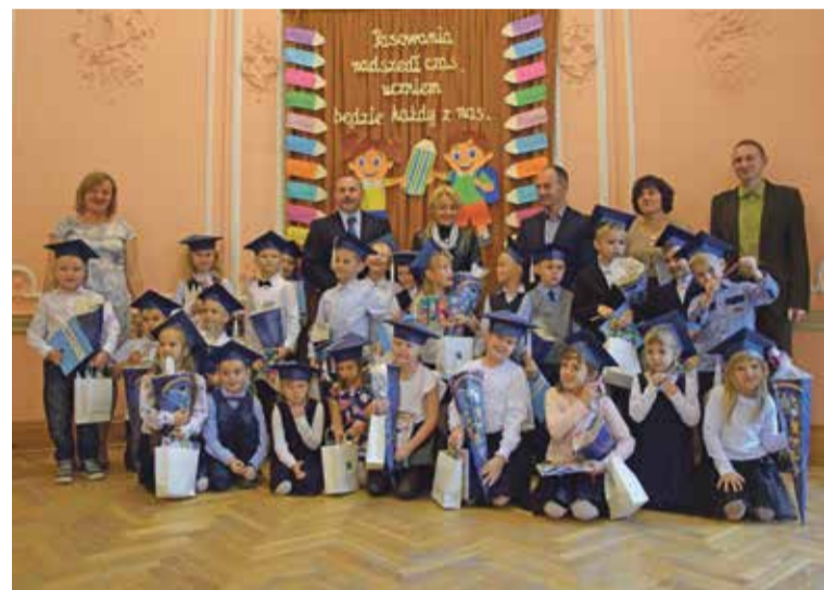
Fot. Pierwszoklasiści ze Szkoły Podstawowej w Wiszni Małej