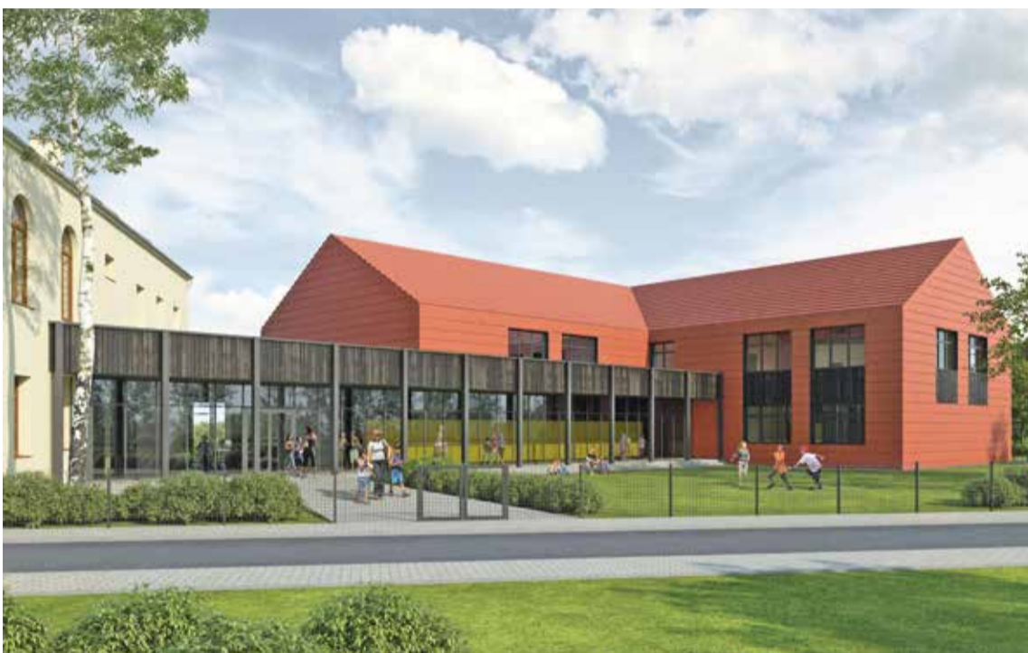
Fot. Wizualizacja Szkoły Podstawowej im. Jana Pawła II w Psarach.

Budowa szkoły to kolejny ważny etap rozwoju gminy, który poprawi jakość edukacji najmłodszych mieszkańców. Zakończenie prac planowane jest w listopadzie 2018 r.