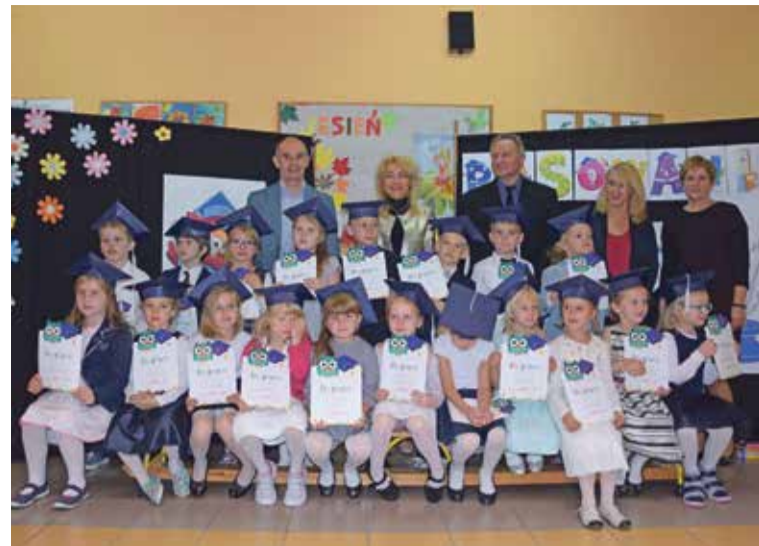
Fot. Pierwszoklasiści ze Szkoły Podstawowej w Krynicznie

Wszystkim pierwszoklasiście życzymy sukcesów w nauce i samych radosnych chwil w towarzystwie przyjaciół.