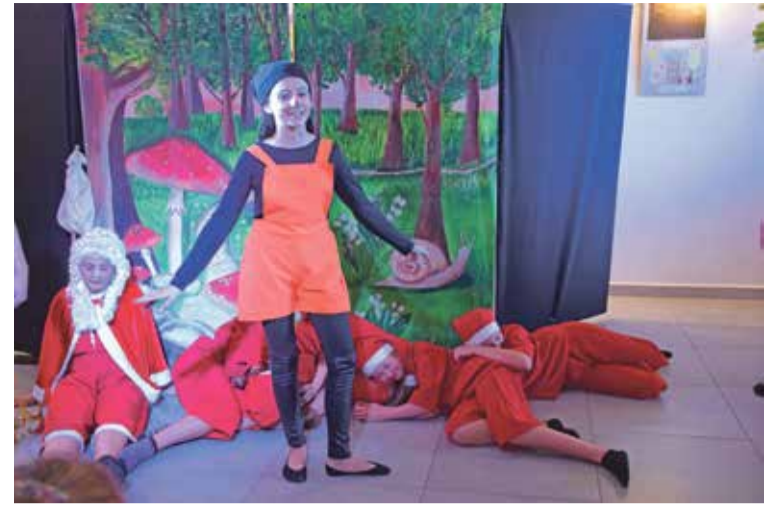
Fot. Występ teatralny pt. „W Karzełkowie ... zabawa za kurtyną”