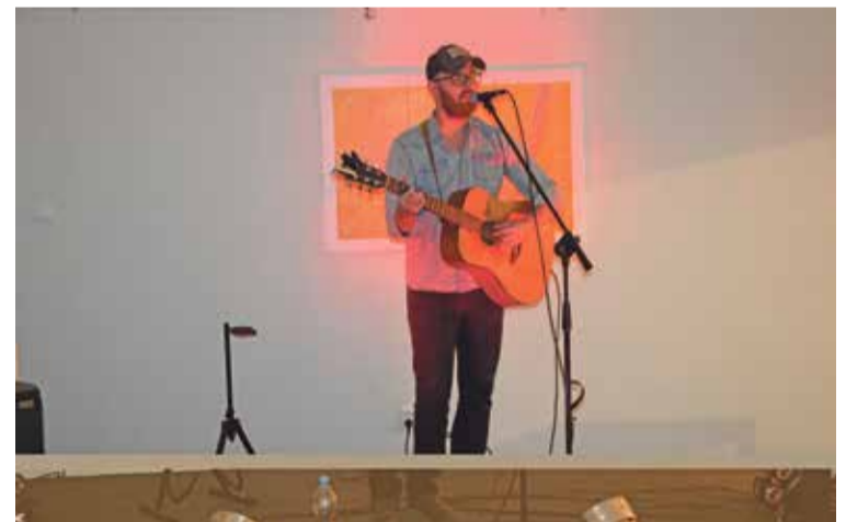
Fot. Wydarzenie uświetnił występ wołowskiego artysty Petera J. Bircha.