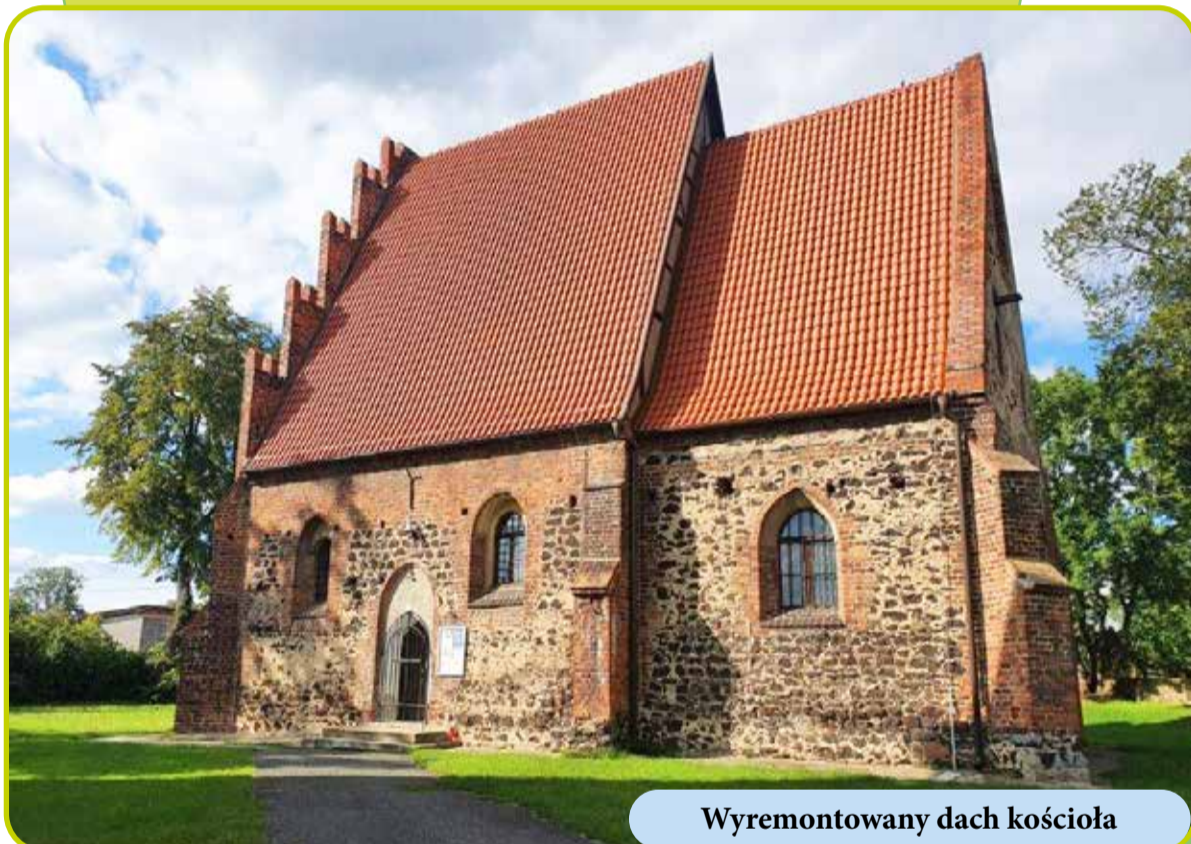
Wyremontowany dach kościoła