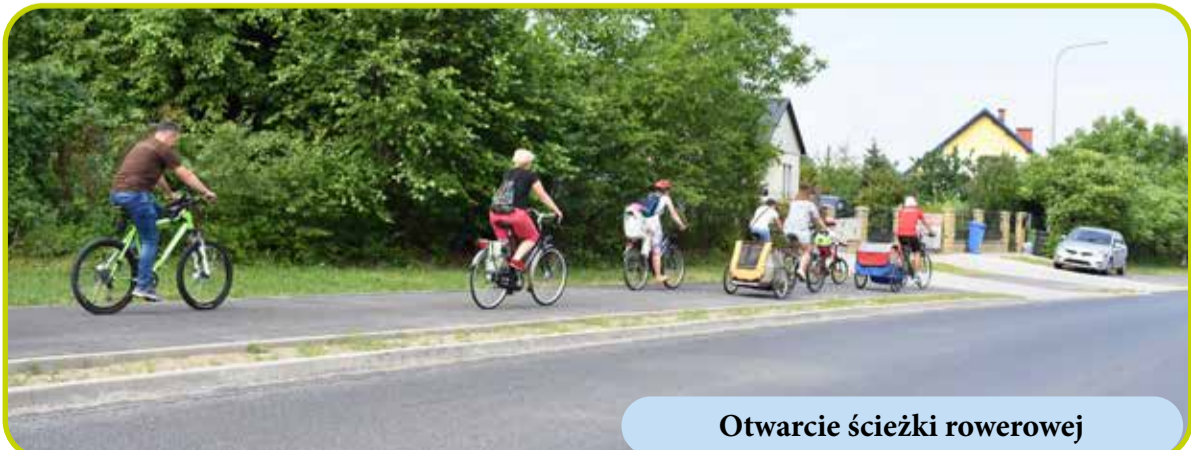
Otwarcie ścieżki rowerowej

Budowa świetlicy wiejskiej na łączną kwotę ok. 1,6 mln zł