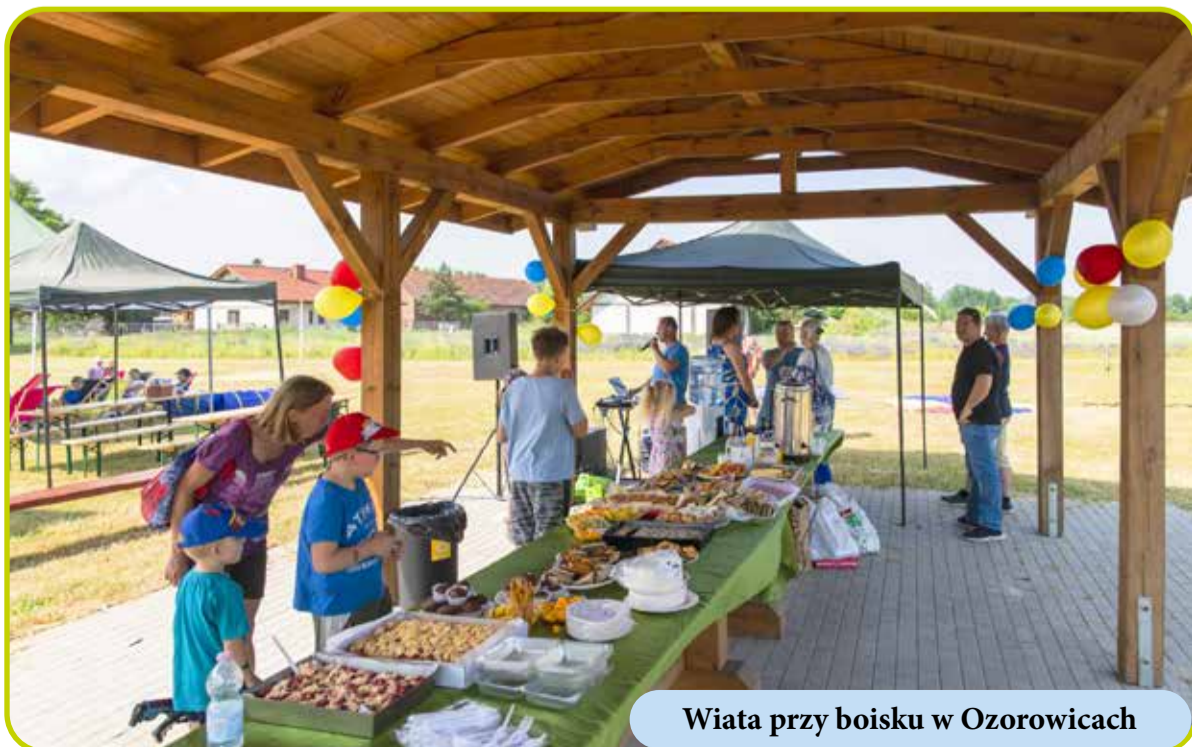
Wiata przy boisku w Ozorowicach