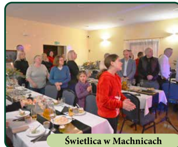
Świetlica w Machnicach