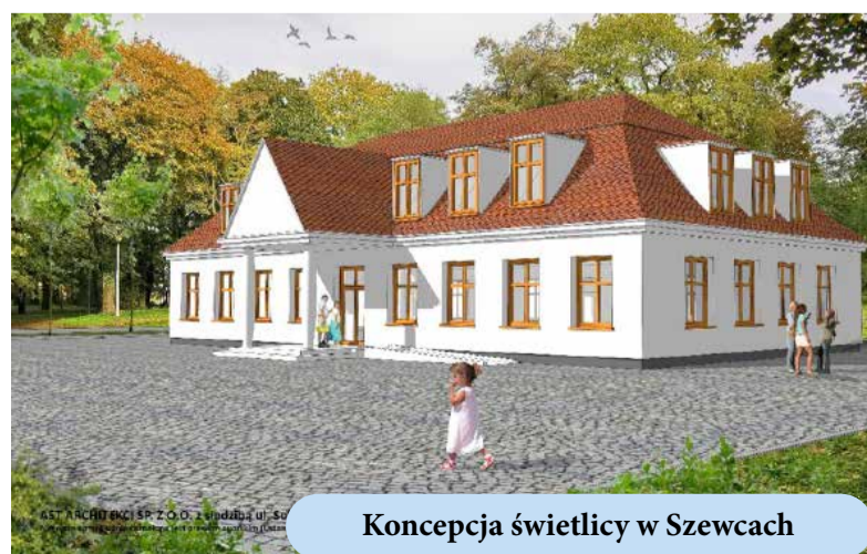
Koncepcja świetlicy w Szewcach