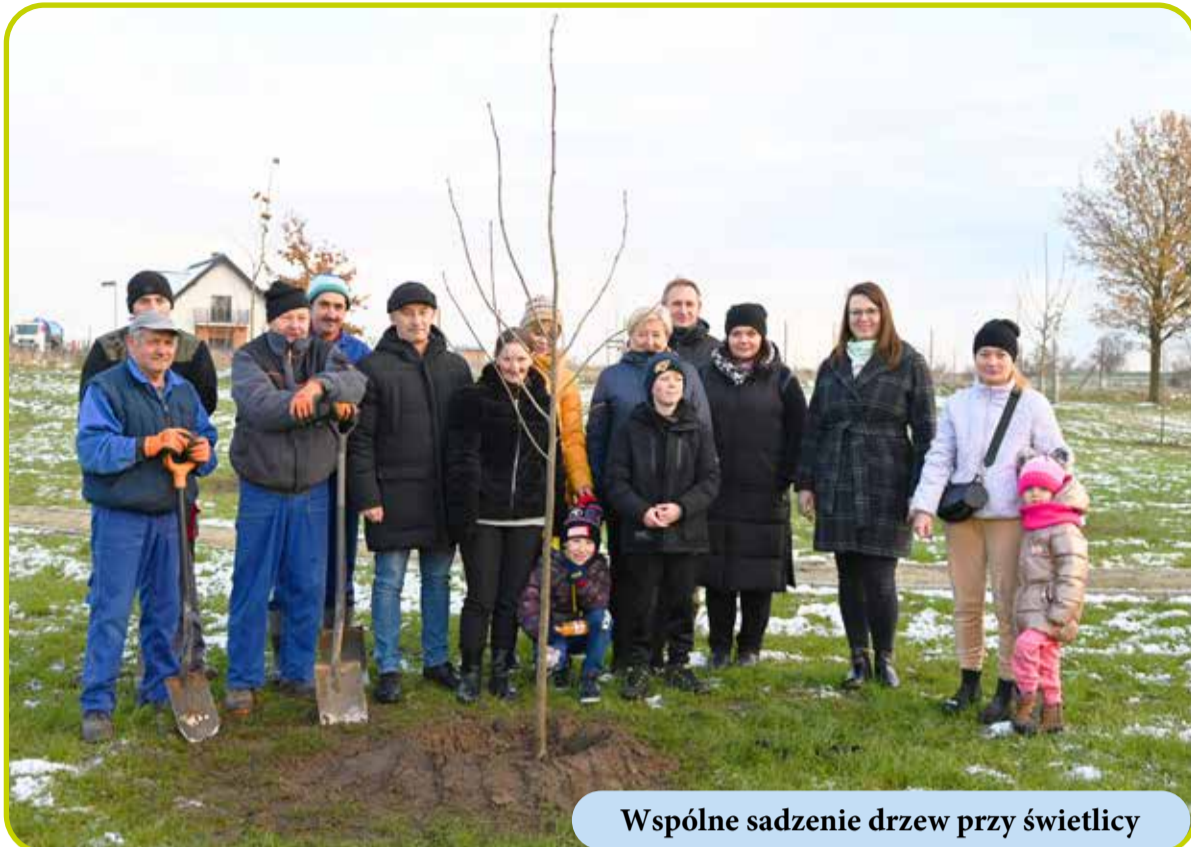
Wspólne sadzenie drzew przy świetlicy