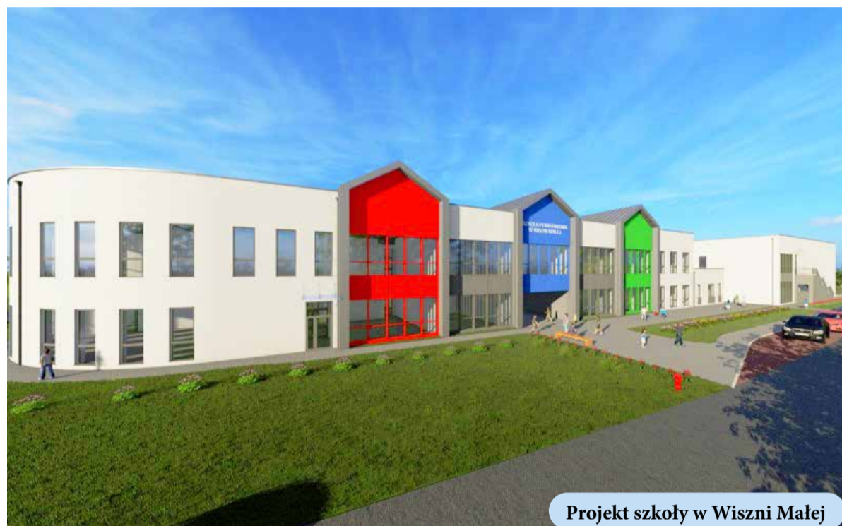
Projekt szkoły w Wiszni Małej

W ramach tego samego dofinansowania (program OLIMPIA) gmina pozyskała dofinansowanie na budowę boiska wielofunkcyjnego do gier zespołowych i ćwiczeń