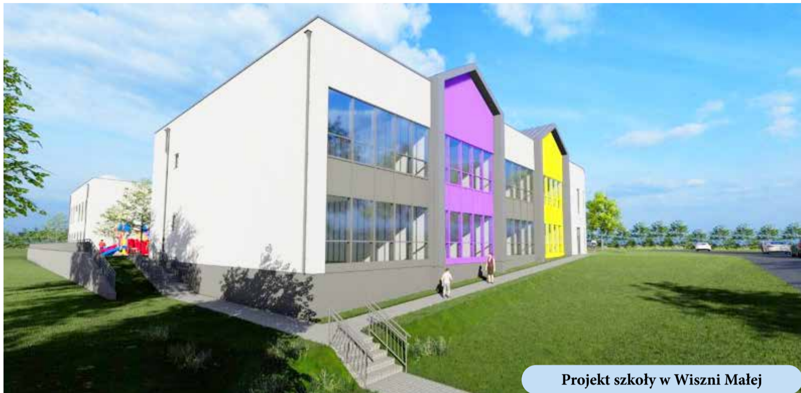
Projekt szkoły w Wiszni Małej

W parku w Wiszni Małej prowadziliśmy prace związane z zagospodarowaniem terenu; została tam zamontowana altana ogrodowa. Z kolei na ulicy Sportowej (tzw. „górcę”) wybudowaliśmy nowy plac zabaw. Zamontowaliśmy nowe urządzenia zabawowe, wykonaliśmy miejsca parkingowe. Dla bezpieczeństwa i wygody dzieci ułożyliśmy nawierzchnię poliuretanową oraz zamontowaliśmy ogrodzenie. Koszt