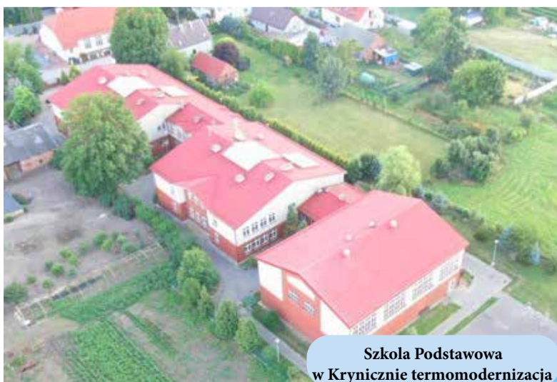
Szkoła Podstawowa w Krynicznie termomodernizacja

Ze środków pozyskanych z Rządowego Programu Odnowienia Zabytków wykonane zostaną prace renowacyjne następujących budynków: aula Szkoły Podstawowej w Wiszni Małej, budynek ZSP