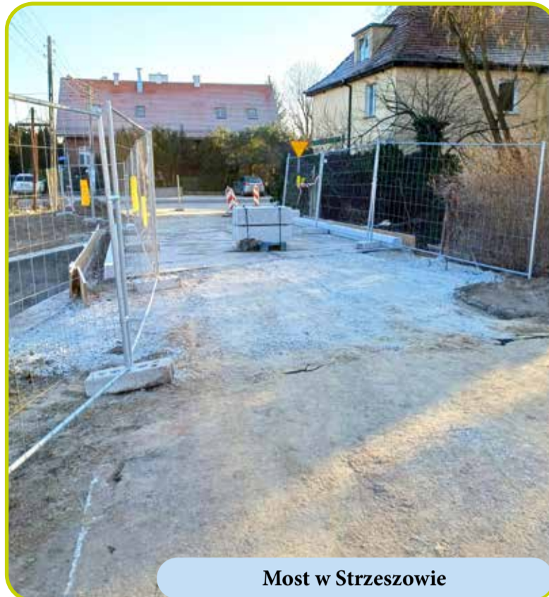
Most w Strzeszowie