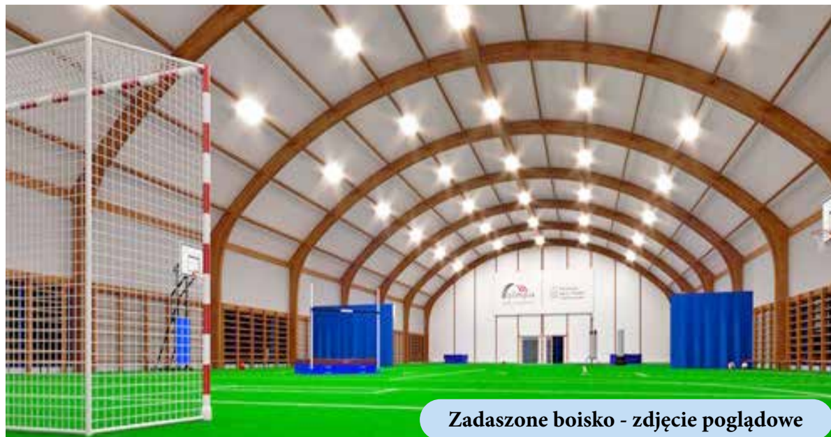
Zadaszone boisko - zdjęcie poglądowe

W 2024 r. planowana jest, po otrzymaniu premii frekwencyjnej, przebudowa remizy strażackiej.