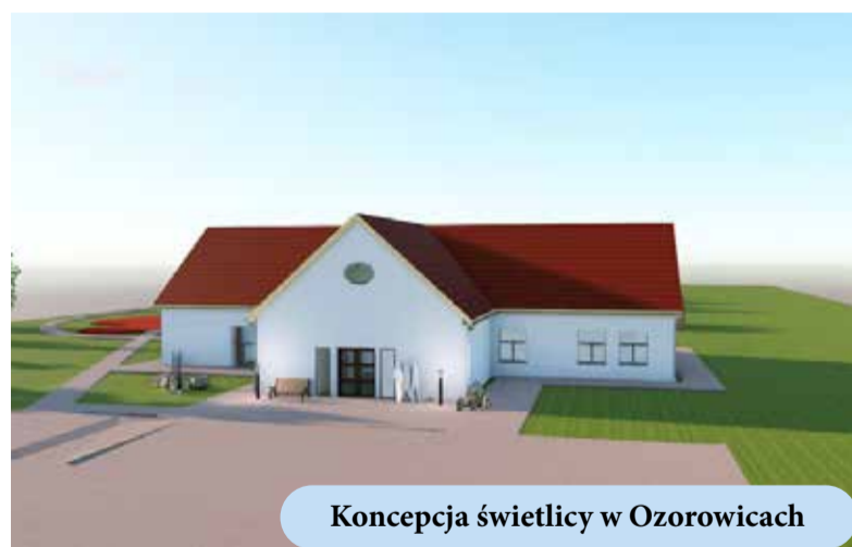
Koncepcja świetlicy w Ozorowicach