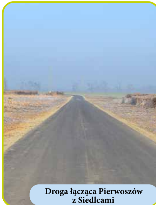
Droga łącząca Pierwoszów z Siedlcami