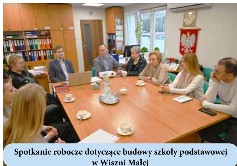
Spotkanie robocze dotyczące budowy szkoły podstawowej w Wiszni Małej