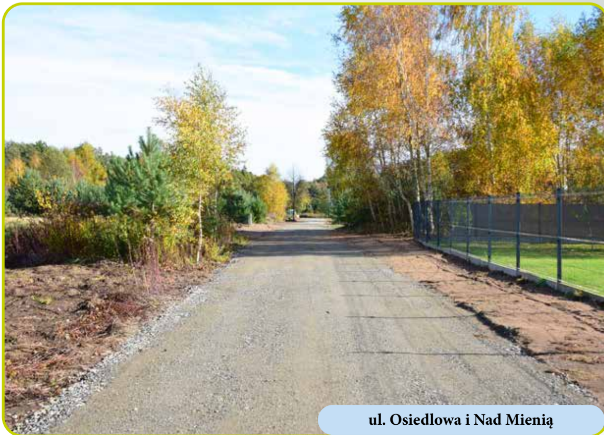
ul. Osiedlowa i Nad Mienią