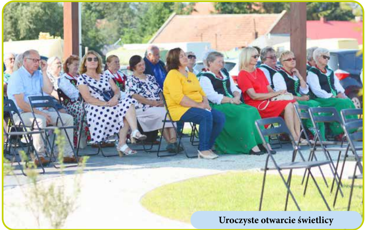
Uroczyste otwarcie świetlicy

W ramach poprawy bezpieczeństwa oraz dzięki dobrej współpracy z powiatem trzebnickim przebudowana została droga powiatowa o długości 1240 m od Strzeszowa do skrzyżowania ze zjazdem do Ozorowic. Wartość przebudowanej drogi to ponad 2,5 mln zł , w tym ok. 1 mln zł kwoty stanowiło dofinansowanie z Rządowego Funduszu Rozwoju Dróg.