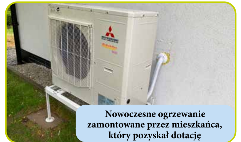
Nowoczesne ogrzewanie zamontowane przez mieszkańca, który pozyskał dotację

Budowa świetlicy wiejskiej na łączną kwotę ponad 800 tys. zł