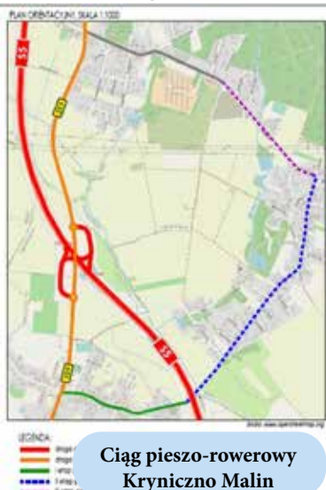
Ciąg pieszo-rowerowy Kryniczno Malin