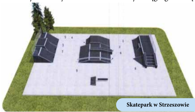
Skatepark w Strzeszowie

Łącznie w ramach inwestycji powstanie ok. 1,7 km nowej sieci kanalizacyjnej, w tym dwie sieciowe przepompownie ścieków. Koszt prac to ponad 2,5 mln zł.