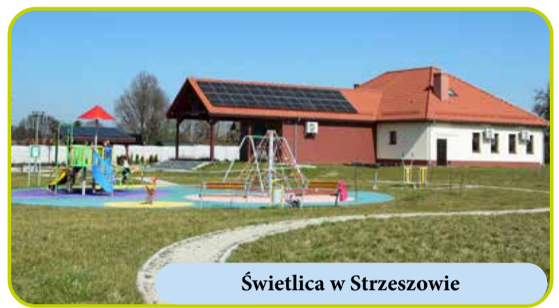
Świetlica w Strzeszowie

Ponadto dzięki pozyskanym kolejnym środkom z Rządowego Funduszu Polski Ład (edycja III PGR) w 2024 r. w Strzeszowie zostanie przebudowana ul. Młynarskiej , wyremontowany zostanie most drogowy na rzece Ława oraz powstaną obok przedszkola: skate park, plac zabaw i siłownia plenerowa . Koszt powyższych inwestycji to ok. 2,5 mln zł .