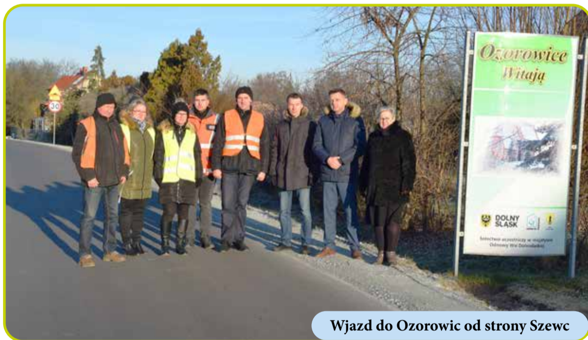
Wjazd do Ozorowic od strony Szewc

Wymiana starych pieców tzw. „kopciuchów” na nowe, ekologiczne kotły w ilości 11 sztuk na łączną kwotę ponad 105 tys. zł.