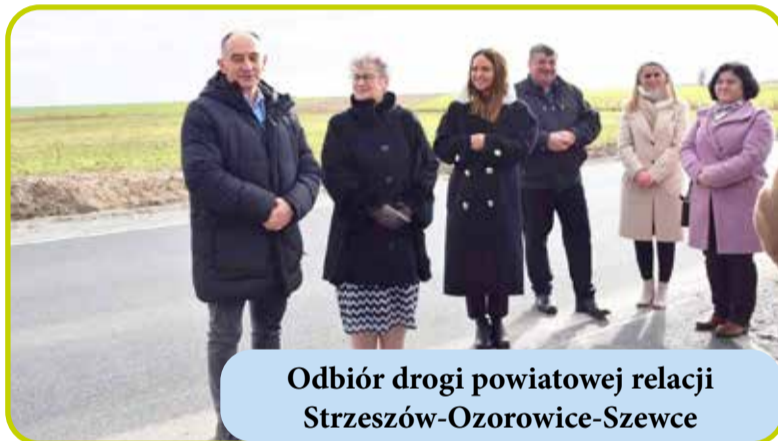
Odbiór drogi powiatowej relacji Strzeszów-Ozorowice-Szewce