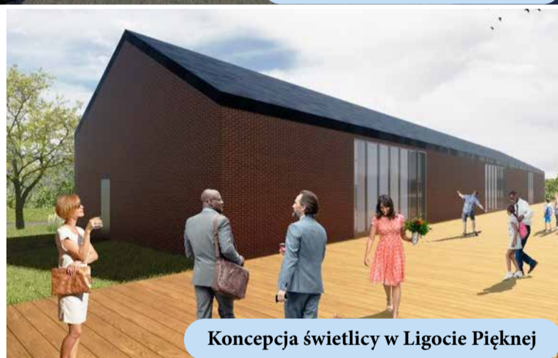
Koncepcja świetlicy w Ligocie Pięknej

W związku z rozpoczęciem się nowej perspektywy dofinansowania zadań ze środków zewnętrznych 2021 - 2027, w odpowiedzi na postulaty mieszkańców, gmina przystąpi do opracowania dokumentacji projektowych nowych świetlic w Ligocie Pięknej, Ozorowicach i Szewcach.