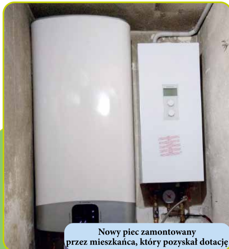
Nowy piec zamontowany przez mieszkańca, który pozyskał dotację