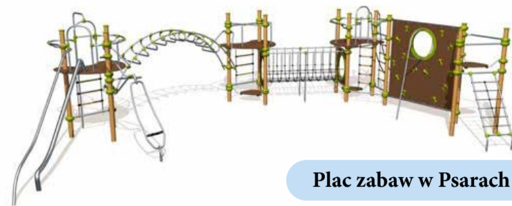
Plac zabaw w Psarach

w Piotrkowiczkach, XIX-wieczna kapliczka domkowa w Krynicznie. Ponadto przekazana zostanie dotacja na remont XV-wiecznego kościoła w Ozorowicach, XVI-wiecznego kościoła w Wysokim Kościele, renowację XV-wiecznego kościoła w Krynicznie oraz renowację XVI-wiecznego Pałacu w Strzeszowie. Wyremontowana zostanie także XIX-wieczna dzwonnica przy kościele w Strzeszowie.