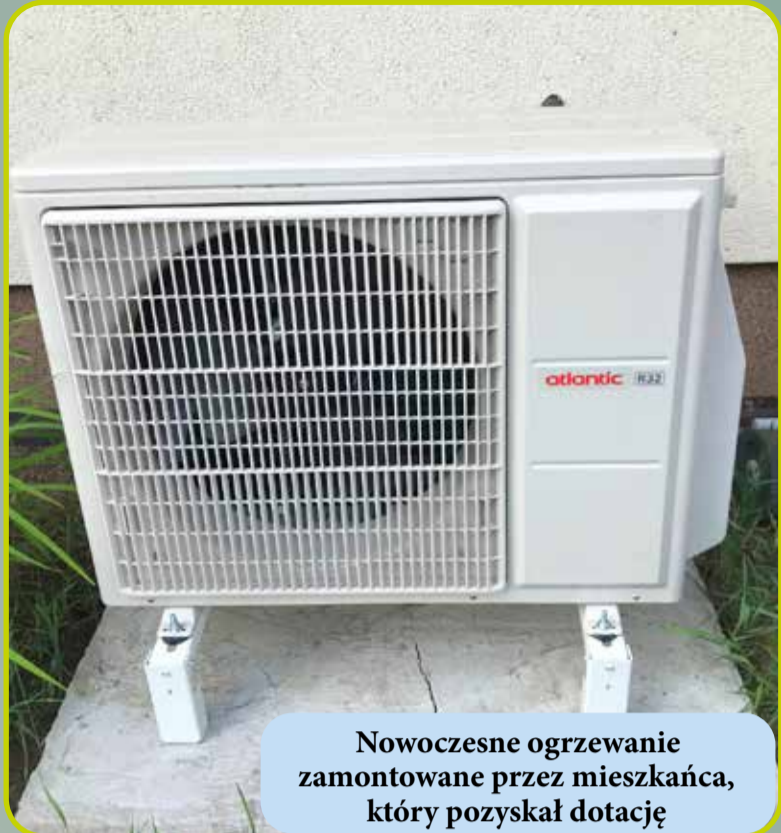
Nowoczesne ogrzewanie zamontowane przez mieszkańca, który pozyskał dotację