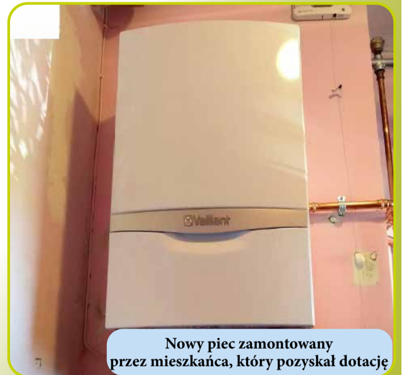
Nowy piec zamontowany przez mieszkańca, który pozyskał dotację