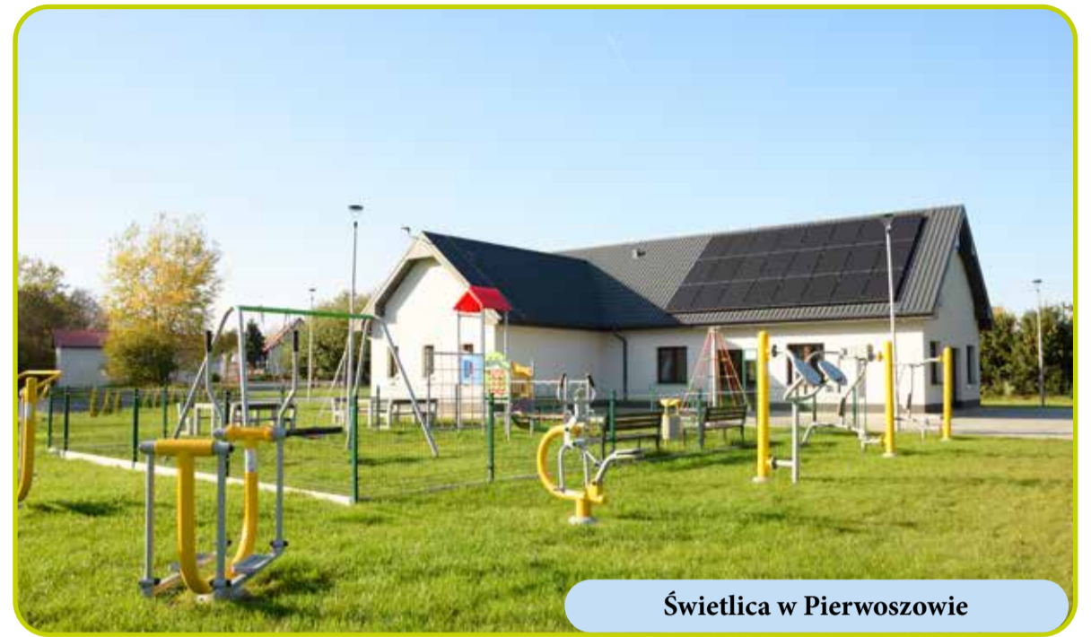
Świetlica w Pierwoszowie

Ponadto w bieżącym roku zostanie przygotowany projekt Dolnośląskiej Cyklostrady – Trasa EuroVelo 9 wraz z miejscem obsługi rowerzystów. Długość trasy przebie-