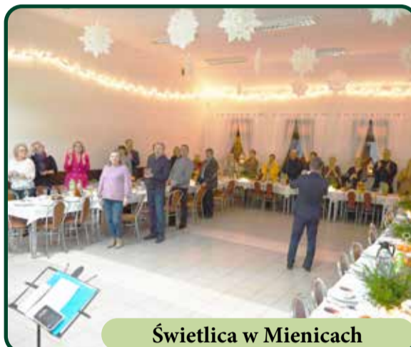
Świetlica w Mienicach