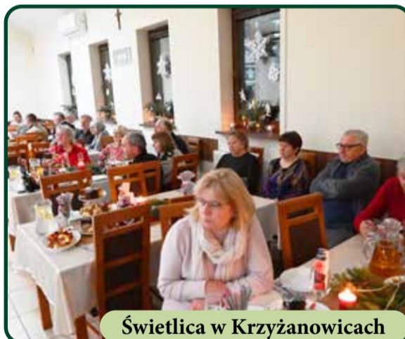
Świetlica w Krzyżanowicach