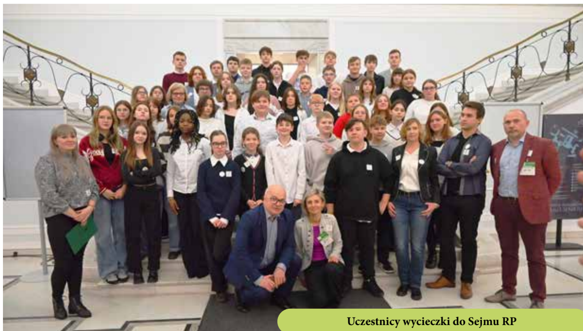
Młodzieżowa Rada Gminy Wisznia Mała