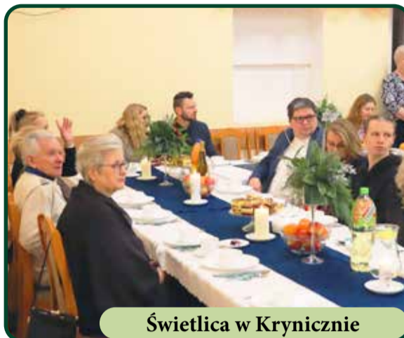
Świetlica w Krynicznie

Podczas imprez panuje miła i rodzinna atmosfera, a mieszkańcy chętnie włączają się do wspólnej zabawy. Jest to wyjątkowy czas, który integruje nasze społeczności.