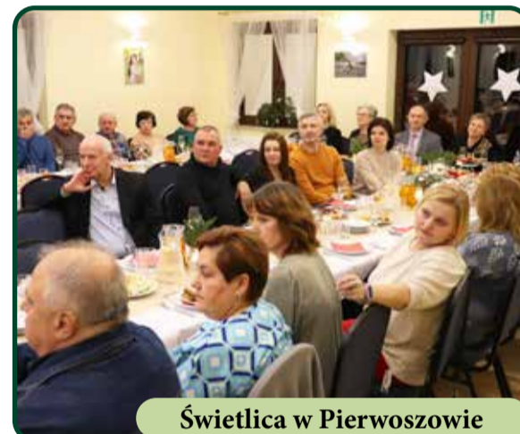
Świetlica w Pierwoszowie