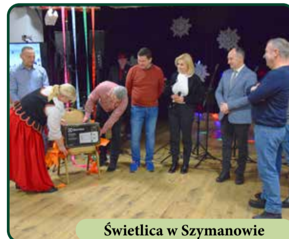
Świetlica w Szymanowie