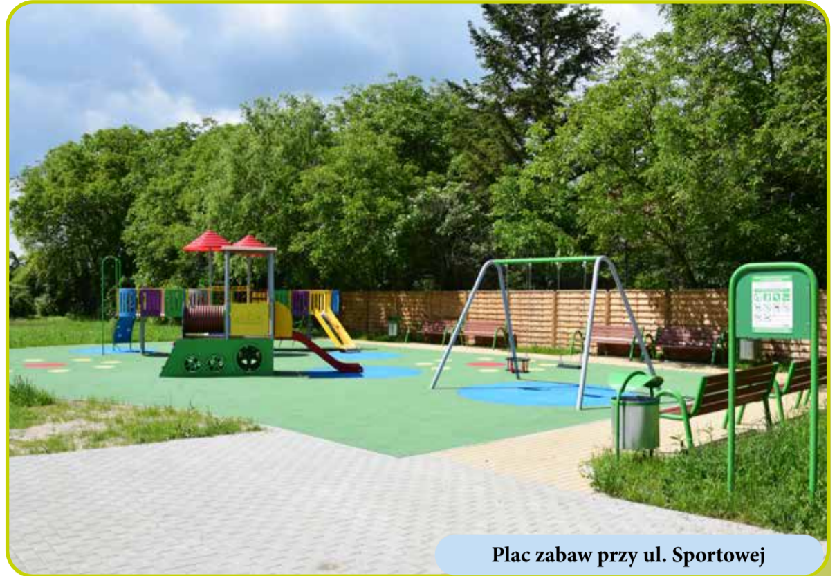
Plac zabaw przy ul. Sportowej

Udzielona dotacja na budowę przyłączy kanalizacyjnej na kwotę 107 tys. zł