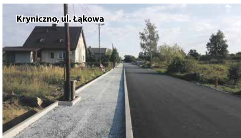
Kryniczno, ul. Łąkowa

wraz ze zjazdami do posesji i progi zwalniające. Wykonawcą inwestycji była firma Ravea Sp. z o.o. z Wrocławia. Koszt inwestycji to 589 tys. zł. Inwestycja jest dofinansowana z Funduszu Dróg Samorządowych w wysokości ponad 477 tys. zł.