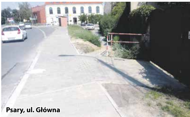
Psary, ul. Główna

Nabiera rozpędu budowa sieci kanalizacji sanitarnej w Krzyżanowicach i Szyma-