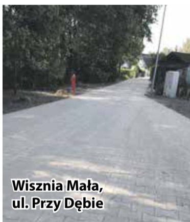
Wisznia Mała, ul. Przy Dębie

W Krynicznie na drodze gminnej nr 104933D relacji Kryniczno – Psary (ul. Łąkowa) została wykonana nawierzchnia bitumiczna oraz pobocza. Obecnie jest wykonywany chodnik i progi zwalniające. Przebudowa drogi jest realizowana dzięki dofinansowaniu z Funduszu Dróg Samorządowych. Wykonawcą jest firma Strabag Infrastruktura Południe Sp. z o.o. z Wysokiej, a koszt za-