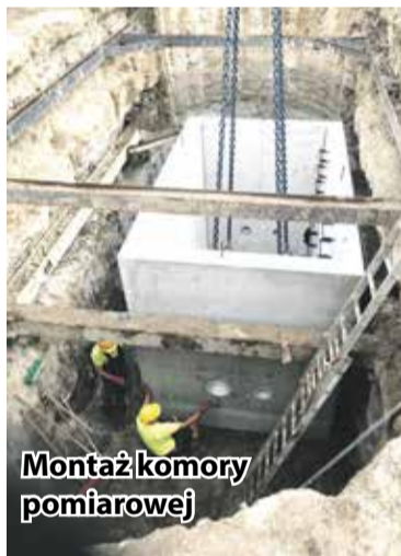
Montaż komory pomiarowej

nowie. Prace realizowane są aktualnie w rejonie ulic Ogrodniczej, Widawskiej i Parkowej w Szymanowie oraz ul. Polnej i Parkowej w Krzyżanowicach.