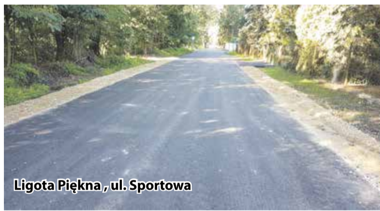
Ligota Piękna, ul. Sportowa

Trwa przebudowa ulicy Sportowej w Ligocie Pięknej. Na drodze została wykonana nakładka asfaltowa, pobocza