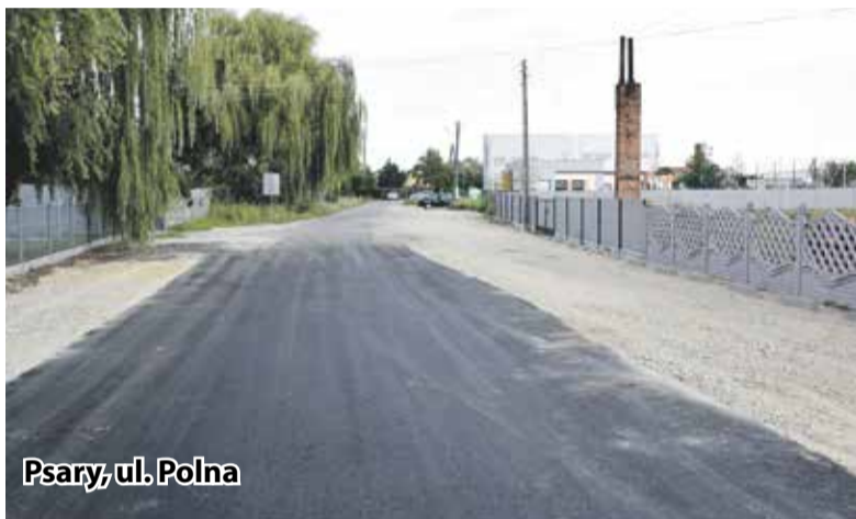
Psary, ul. Polna

nowie. Prace realizowane są aktualnie w rejonie ulic Ogrodniczej, Widawskiej i Parkowej w Szymanowie oraz ul. Polnej i Parkowej w Krzyżanowicach.