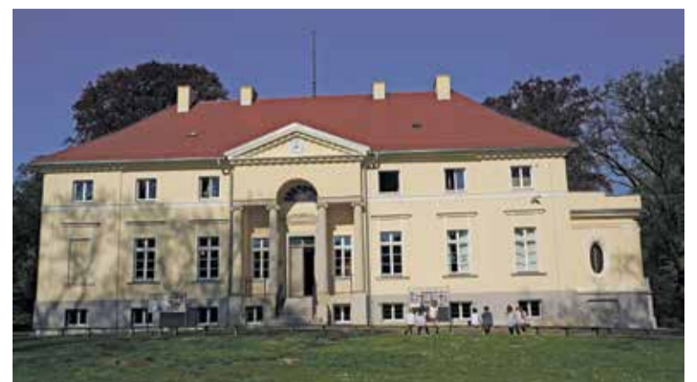
W 2015 r. zakończono rewitalizację Pałacu w Wiszni Małej, na którą Gmina pozyskała dofinansowanie z Programu Rozwoju Obszarów Wiejskich na lata 2007 - 2013 w kwocie 268 845 zł